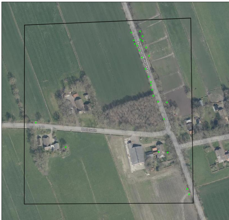
Verspreiding van alle bekende records in het plangebied.

Op 23 augustus 2023 is de NDFF geraadpleegd en is gekeken of waarnemingen van beschermde planten en dieren aanwezig zijn in de databank. In een ruime begrenzing van het zoekgebied rondom het plangebied, zijn 31 verschillende waarnemingen bekend in de NDFF. Voor de verspreiding van de waarnemingen, zie luchtfoto onder.