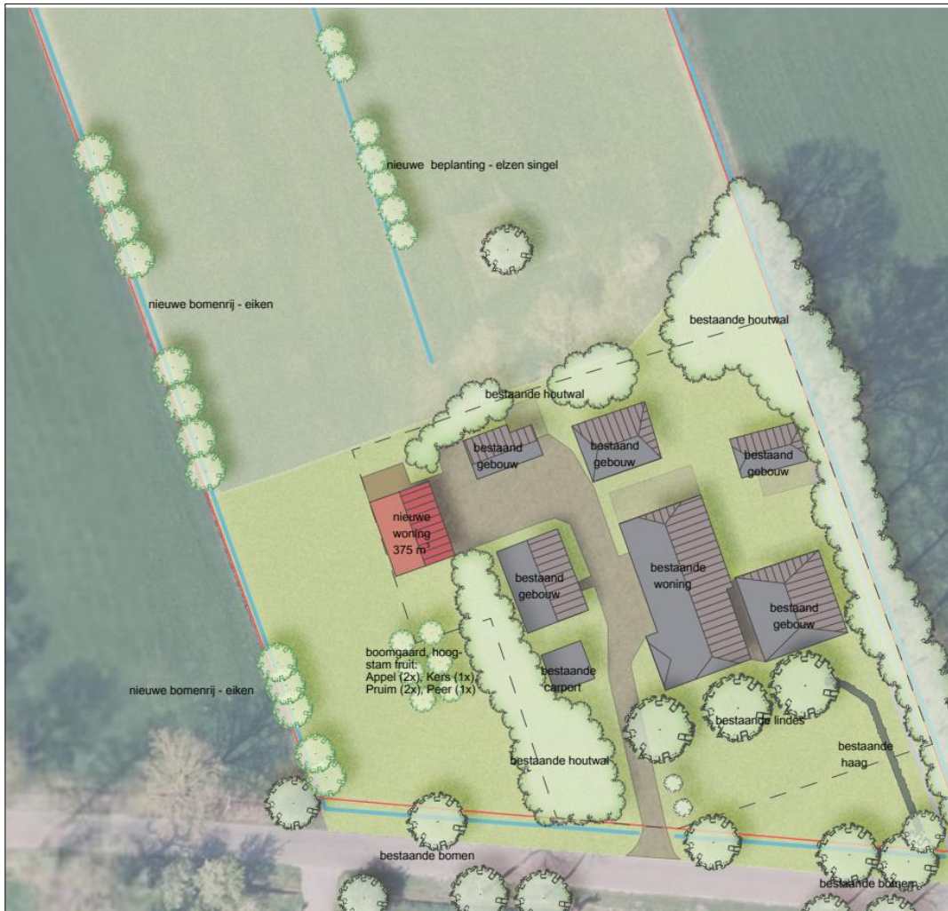
Plattegrond van het wenselijk eindbeeld.

Het voornemen bestaat om een extra woning in het plangebied te realiseren. De extra woning wordt d.m.v. erfverharding in verbinding gebracht met het bestaande erf. Het plangebied wordt nadien landschappelijk ingepast, middels aanplant van bomenrijen (eik en els) en een hoogstam fruitboomgaard. Op onderstaande afbeelding is een plattegrond van het wenselijk eindbeeld weergegeven.