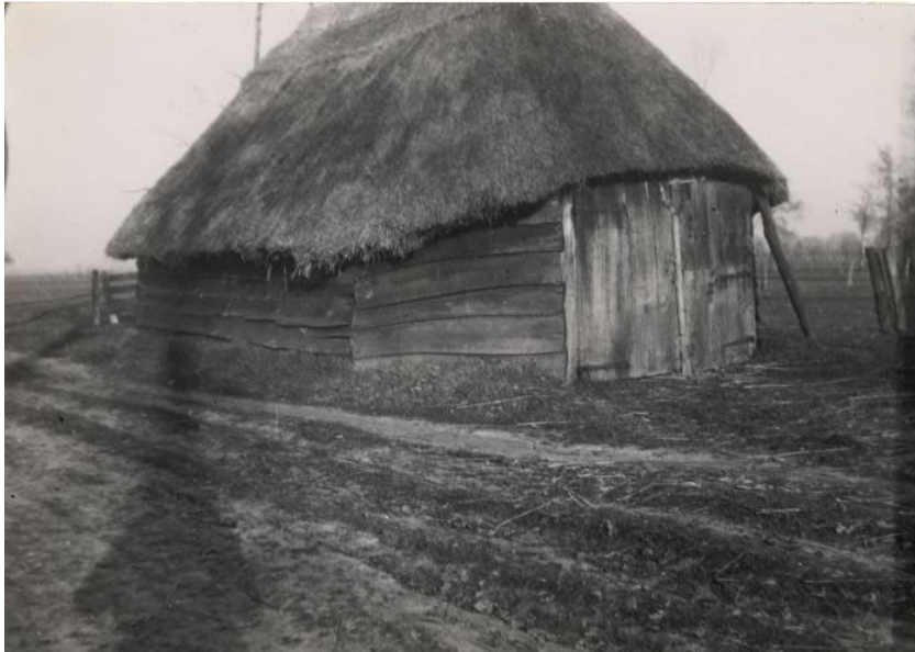
Een schaapskooi zoals er omstreeks 1900 ongeveer 42 van in Nieuwleusen stonden.

De schaapskooi zoals deze rond 1900 in Nieuwleusen voorkwamen: los in het land en aan de zijde van de erven