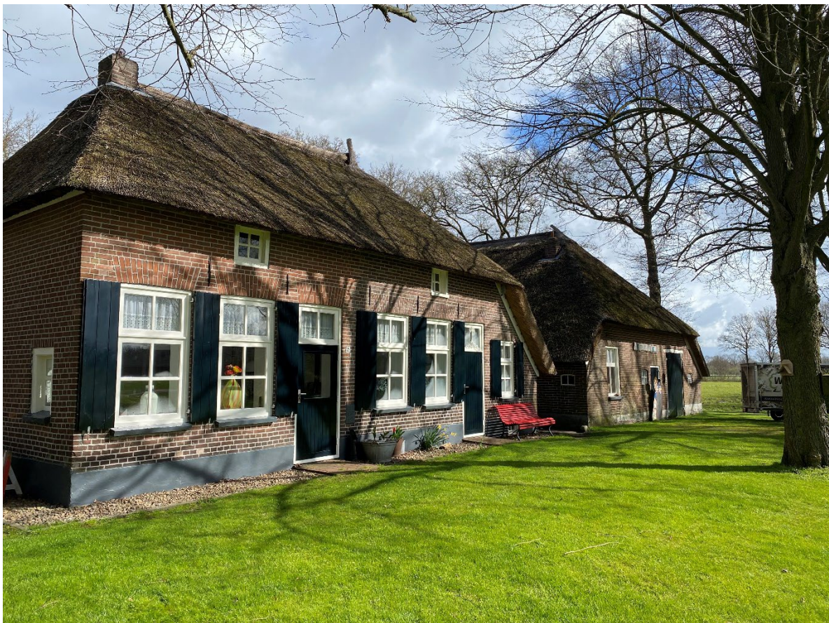
Huidige situatie erf aan de Oosterveenweg.

Datum : 17 mei 2023 Onderwerp: Kleine woning Status: Initiatief