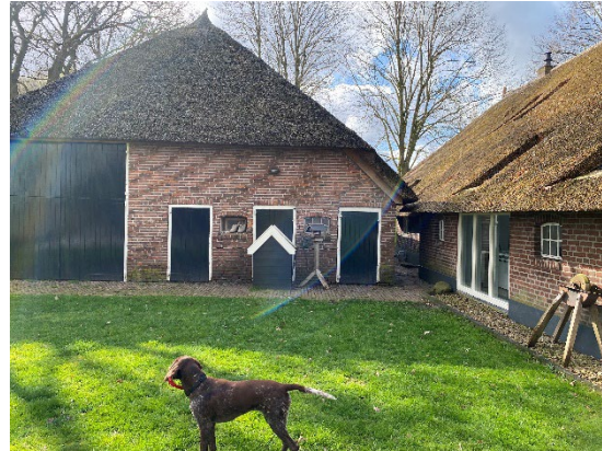
Het erfensemble met de verschillende bijgebouwen in agrarische sfeer. Zichtbaar zijn de tijdlagen op het erf.