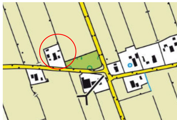
Uitsnede locatie erf.