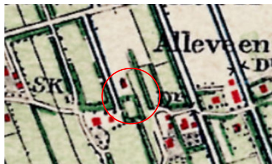
Een volume is zichtbaar op de plek op/nabij het huidige erf op de kaart van 1850 (links). Aan de oostzijde en zuidzijde van het volume een pad of een weg voor ontsluiting. In 1896 is een opstreckende verkaveling zichtbaar. De erfteogang lijkt westelijk te zijn. De erven die nabij liggen zijn ook al zichtbaar. SK duidt op een schaapskooi. Deze kleine kooien lagen verspreid in de linten. Het waren lage zwarte houten schuren met riet of een pannendak.