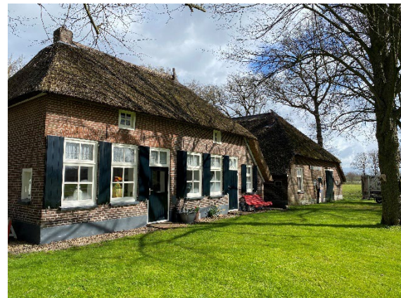
Het aanzicht van het erf met op de foto linksonder de locatie voor de kleine woning.