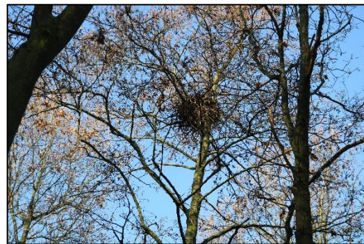
Figuur 3.3 Mogelijk jaarrond beschermd nest.