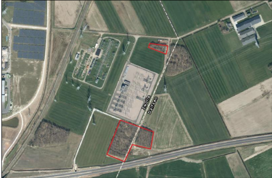
Figuur 1.1. Ligging onderzoeksgebieden voor jaarrond beschermde nesten, boomarter, steenarter, bunzing, hermelijn, wezel en egel (rode kaders).

dominanter aanwezig. Er zijn in dit bosperceel tevens grote takkenhopen aanwezig. Er zijn rustplekken waargenomen en meerdere wildwissels.