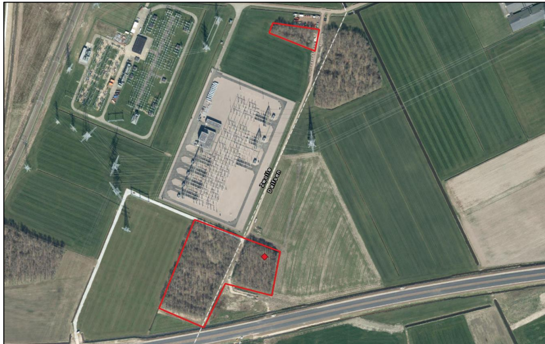
Figuur 3.1 Locatie (rode ruit) mogelijk jaarrond beschermd nest.

Voor de boomvalk en wespandief is geen kennisdocument van BIJ12 beschikbaar. De onderzoeksmethodiek voor deze soorten wordt daarom gebaseerd op de telrichtlijnen van SOVON. In totaal dienen tenminste 3 veldbezoeken uitgevoerd te worden waarvan 2 tussen mei en augustus, aangezien deze soorten relatief laat broeden. Tijdens de veldbezoeken wordt gekeken naar nest- en territorium indicerend gedrag (geluid en zichtwaarnemingen). Het nader onderzoek naar de boomvalk en wespandief kan gecombineerd worden met het nader onderzoek naar de buizerd.