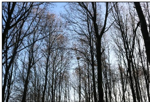
Figuur 3.2. Mogelijk jaarrond beschermd nest.