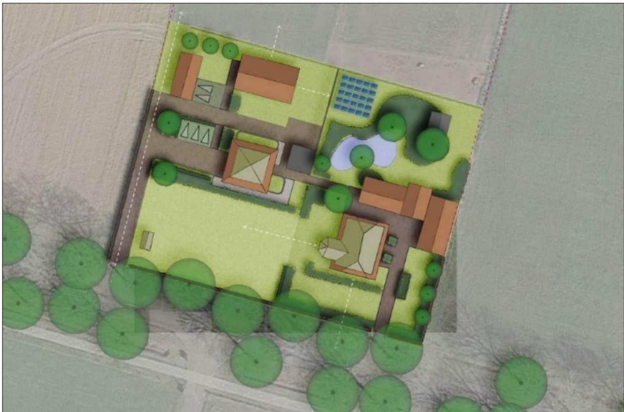
Plattegrond van het wenselijk eindbeeld.

Het voornemen bestaat om een extra woning met bijgebouw in het plangebied te realiseren. Tevens wordt de functie van de hooiberg gewijzigd naar een kattenpension. Er vinden geen sloopwerkzaamheden plaats. De nieuwe bebouwing wordt d.m.v. een nieuw aan te leggen verharde inrit in verbinding gebracht met de zuidelijk gelegen Weerdhuisweg. Aangenomen wordt dat een deel van de bestaande erfverharding verwijderd en vervangen wordt en dat er nieuwe erfverharding wordt aangelegd. Tevens wordt aangenomen dat de zonnepanelen worden verwijderd uit het plangebied. Het plangebied wordt nadien landschappelijk ingepast d.m.v. de aanplant van erfbeplanting. Op onderstaande afbeelding is een plattegrond van het wenselijk eindbeeld weergegeven.