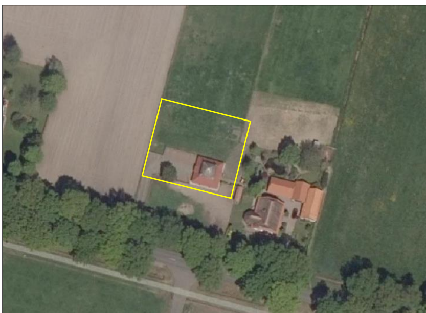
Begrenzing van het plangebied; deze wordt met de gele lijn aangeduid (bron luchtfoto: ruimtelijkeplannen.nl).

Het plangebied vormt een deel van een woonerf en bestaat uit bebouwing, agrarisch cultuurgrond, erfverharding en zonnepanelen. De bebouwing vormt een hooiberg welke beschikt over gemetselde buitengevels zonder luchtspouw. De hooiberg beschikt deels over een dakpannen gedekt dak en deels over een rieten dak. Het agrarisch cultuurgrond, tijdens het veldbezoek in gebruik als grasland, bestaat uit een soortenarme vegetatie van raagrass en wordt intensief beheerd (bemesten, maaien en afvoeren maaisel). De enkele zonnepanelen liggen ten noorden van de hooiberg. Op onderstaande luchtfoto is de begrenzing van het plangebied aangegeven. Voor een verbeelding van de huidige situatie wordt verwezen naar de fotobijlage.