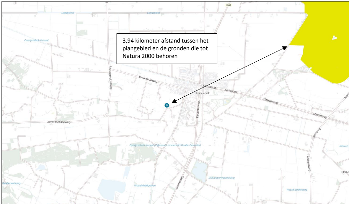
Ligging van Natura 2000-gebied in de omgeving van het plangebied. De ligging van het plangebied wordt met de blauwe marker aangeduid. Gronden die tot Natura 2000 behoren worden met de okergele kleur aangeduid.