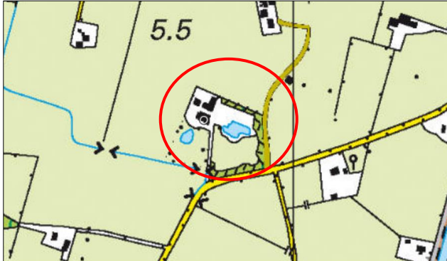
Globale ligging van het plangebied. De ligging van het plangebied wordt met de rode cirkel aangeduid.

Het plangebied ligt aan de Strenkhaarsweg 14 te Lemelerveld, gemeente Dalfsen. Het ligt circa 500 meter ten westen van de woonkern Lemelerveld en wordt omgeven door landelijk gebied. Op onderstaande afbeelding wordt de globale ligging van het plangebied weergegeven op een topografische kaart.