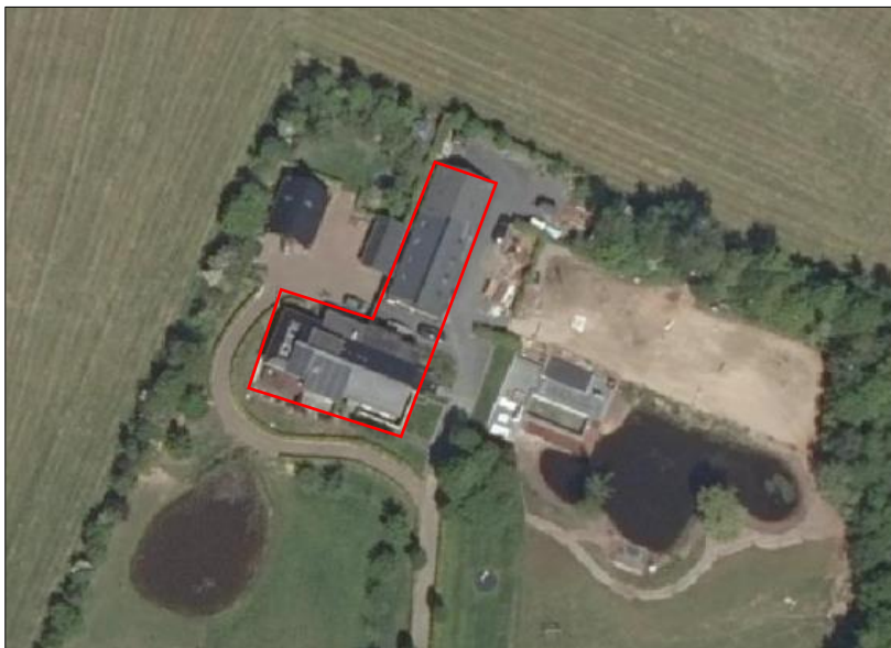
Begrenzing van het onderzoeksgebied; deze wordt met de rode lijn aangeduid.

Omdat er geen werkzaamheden uitgevoerd worden aan de bijgebouwen en poolhouse, zijn deze niet meegenomen in het onderzoek. Indien in dit rapport gesproken wordt over plangebied, wordt onderstaand onderzoeksgebied bedoeld.