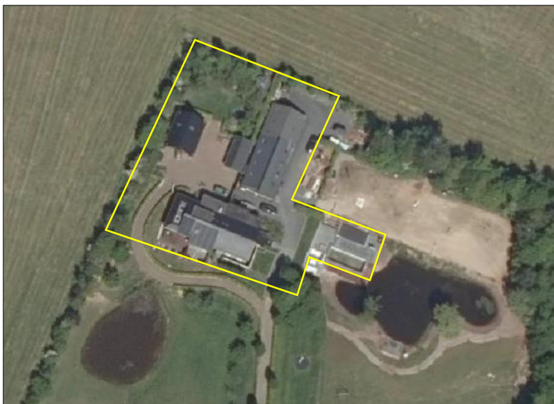
Begrenzing van het plangebied; deze wordt met de gele lijn aangeduid.

Het plangebied vormt een woonerf en bestaat uit bebouwing, beplanting, gazon en erfverharding. De bebouwing bestaat uit een woning, twee bijgebouwen, een schuur en poolhouse. De woning bestaat uit twee wooneenheden (Strenkhaarsweg 14 en 14a) en beschikt over gemetselde buitengevels met luchtspouw. De woning beschikt deels over een dakpannen gedekt zadeldak en deels over een plat dak. De schuur beschikt over gemetselde buitengevels met deels luchtspouw en is gedekt met golfplaten. De woning beschikt over dakbeschot en de schuur beschikt deels over dakisolatie. De buitengevels van de woning en de schuur zijn deels met hout betimmerd. De bijgebouwen beschikken over gemetselde buitengevels met luchtspouw en over een dakpannen gedekt zadeldak. Het poolhouse is volledig van hout en beschikt over een plat dak. De beplanting vormt in het noordelijke- en westelijke deel van het plangebied houtsingels, bestaande uit enkele loofbomen en heesters. Rondom de woning ligt een eenvoudige siertuin met sierplanten, heesters, scheerhagen en gazon. Tevens staan er beukhagen ten oosten van de schuur en langs het poolhouse. Op onderstaande luchtfoto is de begrenzing van het plangebied aangegeven. Voor een verbeelding van de huidige situatie wordt verwezen naar de fotobijlage.