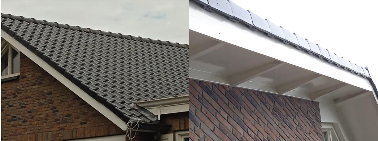
De dakpannen en gevelpannen sluiten nauw op elkaar aan.

Door het uitvoeren van de voorgenomen activiteiten wordt geen vogel gedood en wordt geen bezet vogelnest verstoord, beschadigd of vernield. Als gevolg van het uitvoeren van de voorgenomen activiteiten neemt de betekenis van het plangebied als foerageergebied voor vogels niet af.