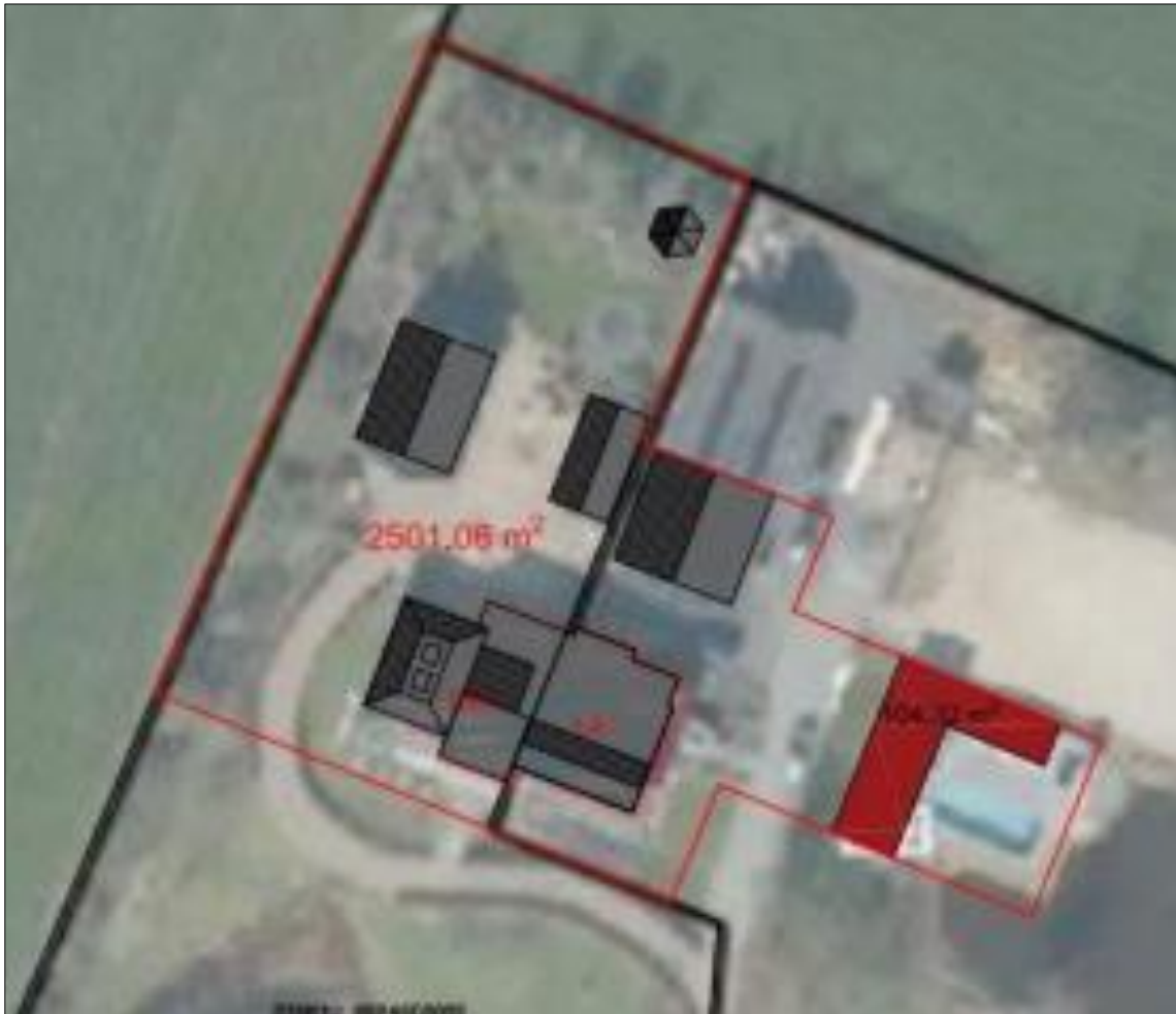
Verbeelding van het wenselijk eindbeeld.

Het voornemen bestaat om de bestaande woning te splitsen, een gedeelte van de schuur te slopen en het huidige bouwvlak te verplaatsen. Aangenomen wordt dat voor het splitsen van de woning alleen interne bouwwerkzaamheden plaatsvinden (zoals o.a. metselwerk). Het noordelijke deel van de schuur wordt gesloopt (145, 76m 2 ) en dit deel van het bouwvlak wordt verplaatst naar de locatie van het poolhouse. Op de locatie van het te slopen deel van de schuur komt erfverharding. Er wordt geen beplanting in het plangebied verwijderd. Op onderstaande afbeelding wordt een plattegrond van het wenselijk eindbeeld weergegeven.