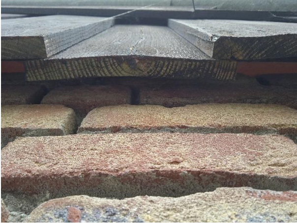
De houtbetimmering sluit naadloos aan op de buitengevels.

Door het uitvoeren van de voorgenomen activiteiten wordt geen vleermuis verstoord of gedood en wordt geen vaste rust- of voortplantingsplaats verstoord, beschadigd of vernield.