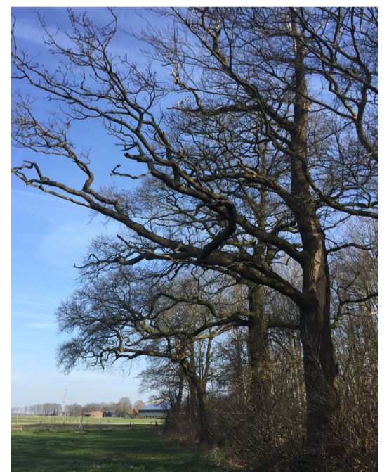
Huidig: rand oude eiken & ondergroei