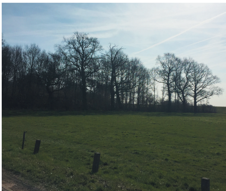
Huidig: gesloten bosrand, opener beeld richting dijk

Idem 'bomen nieuw' Vuilboom Rhamnus frangula Lijsterbes Sorbus aucuparia Krent Amelanchier lamarchkii Pijpenstrootje Molinia caerulea