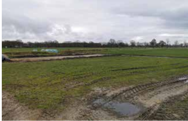
Figuur 7 Kuilvoerplaten op het voorerf.