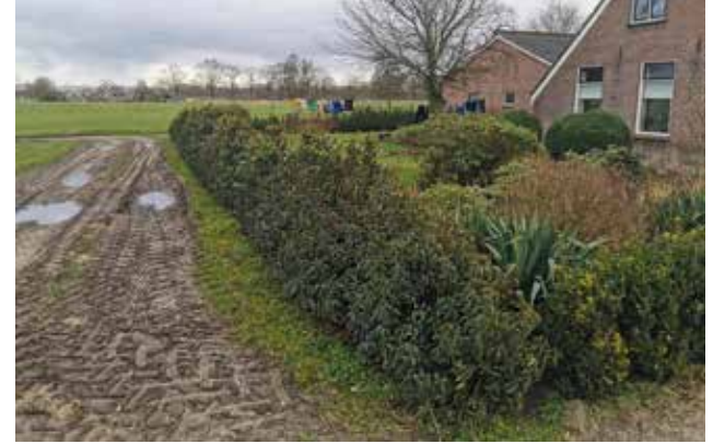
Figuur 8 Siertuin voor de woonboerderij.