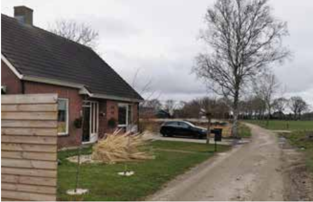
Figuur 6 Toegangsweg met links de plattelandswoning.