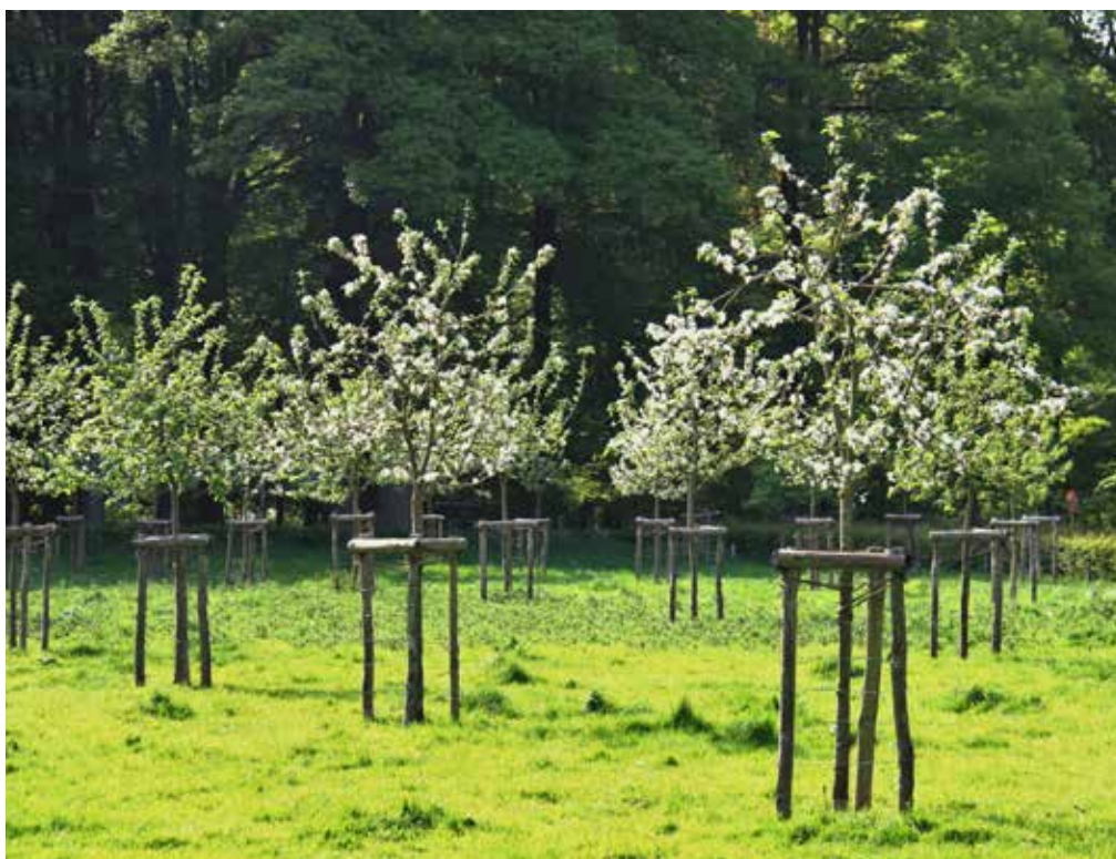
Figuur 18 Hoogstam fruitboomgaard