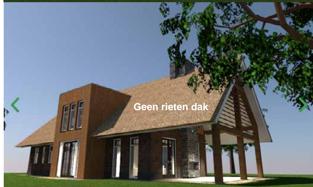
Rood voor Rood - Ruimtelijk kwaliteitsplan - Lemelerveldseweg 44 Lemelerveld