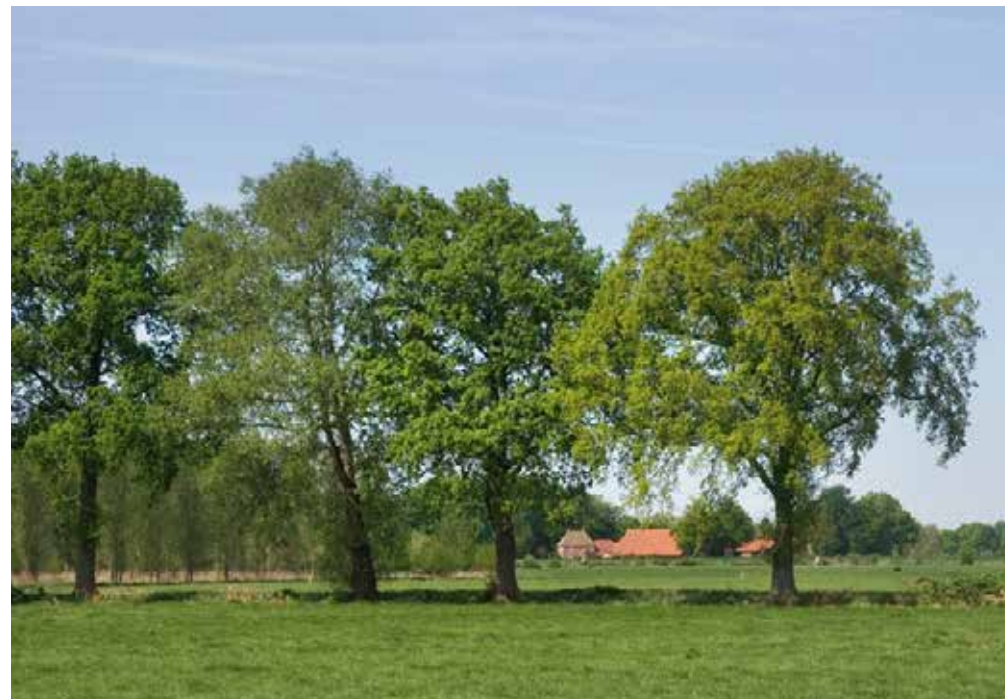
Figuur 19 Bestaande bomenrij op perceelsrand aanvullen met bomen

Op de perceelrand ten zuiden van het erf worden een aantal bomen ingeplant. Deze bomen zorgen voor een aanvulling van de bomenrij waardoor het erf aan de zuidkant landschappelijk wordt ingepast.