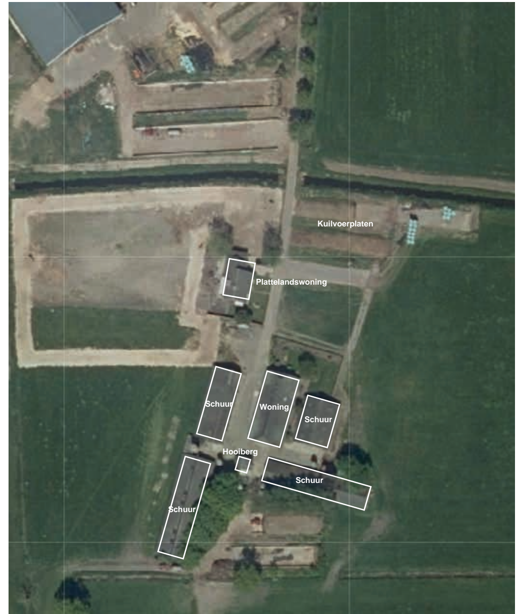
Figuur 5 Huidige erfopzet gebouwen

Op de volgende pagina staan een aantal foto's van de huidige situatie. De nieuwbouwwoning dient landschappelijk ingepast te worden op het erf.