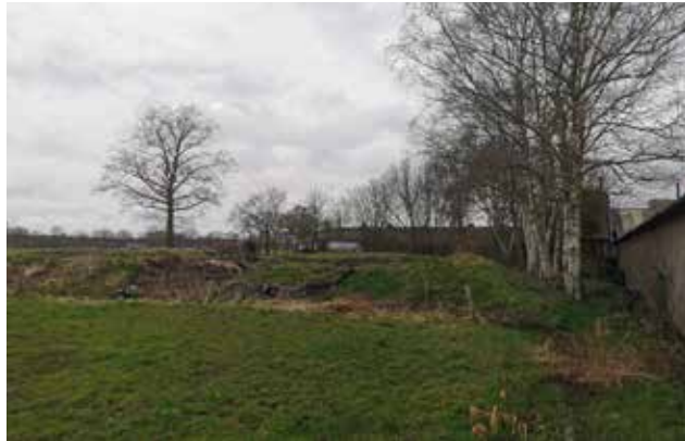
Figuur 10 Berkenrij, solitaire eik, kuilvoerplaten op het achtererf.