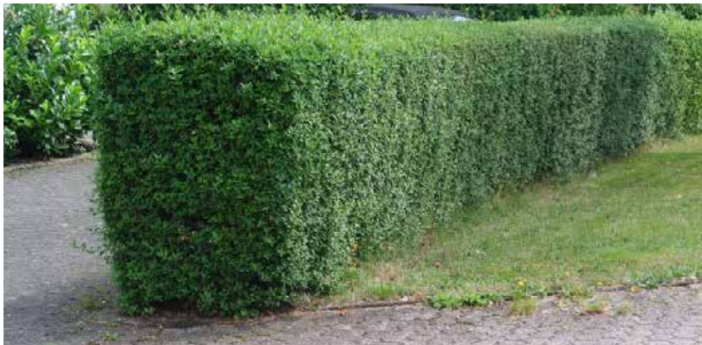
Figuur 17 Ligusterhaag rondom fruitboomgaard