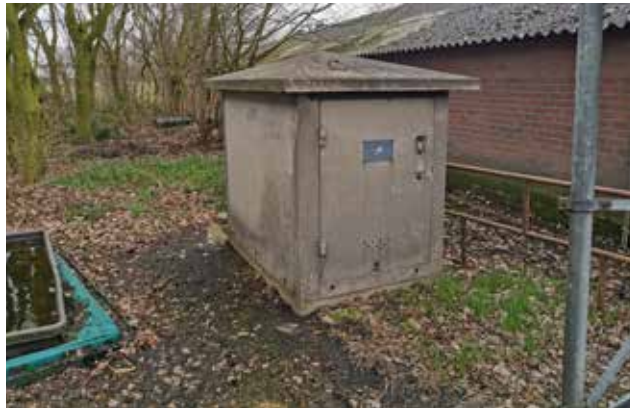
Figuur 13 Aanwezige trafo op het erf