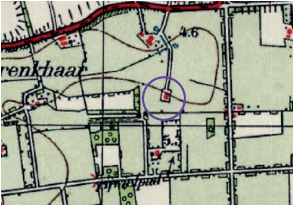
Figuur 4 Historische kaart 1955