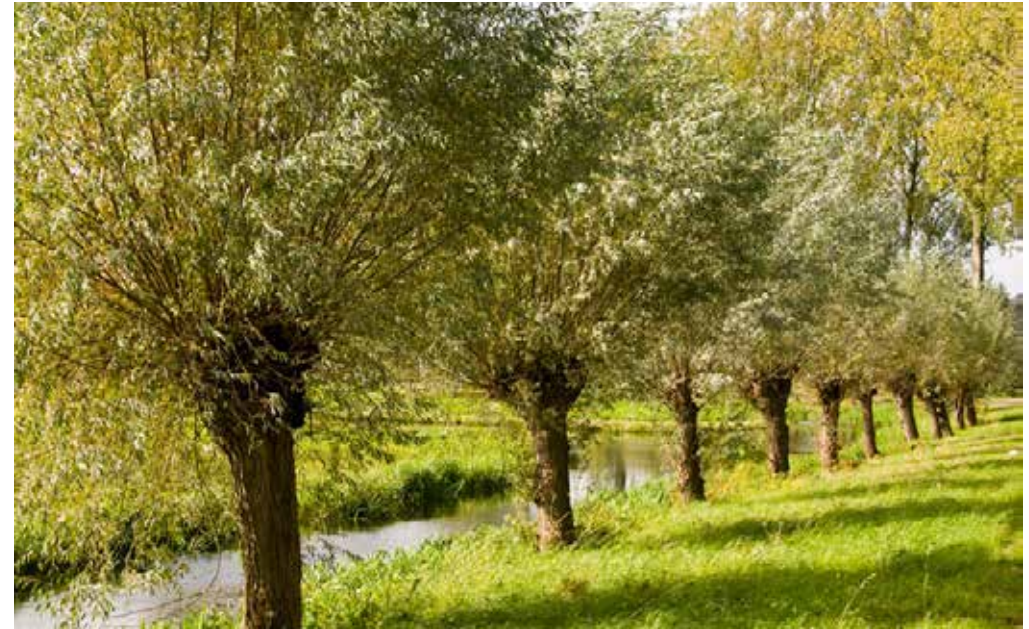
Figuur 20 Knotwilgen langs de watergang

Langs de watergang worden een aantal knotwilgen geplaatst. Het plaatsen gebeurt in overleg met het waterschap zodat het onderhoud van de watergang niet wordt belemmert.