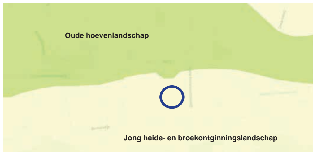
Figuur 2 Aardkundig waardevol gebied - aanwezigheid stuwwal

Wegen zijn lanen met lange rechtstanden. Vaak zijn het 'inbreidings'landschappen met rommelige driehoekstructuren als resultaat. Als ontwikkelingen plaats vinden in de agrarische ontginningslandschappen, dan dragen deze bij aan behoud en versterking van de dragende lineaire structuren van lanen, bosstroken en waterlopen en ontginningslinten met erven en de kenmerkende ruimtematen.