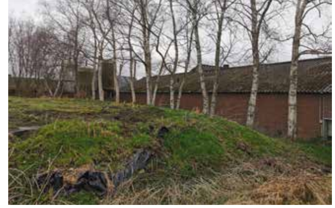
Figuur 11 Berkenrij naast de varkensstal.