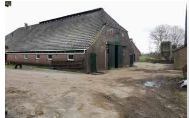
Figuur 14 Achterzijde woonboerderij, zuidkant.