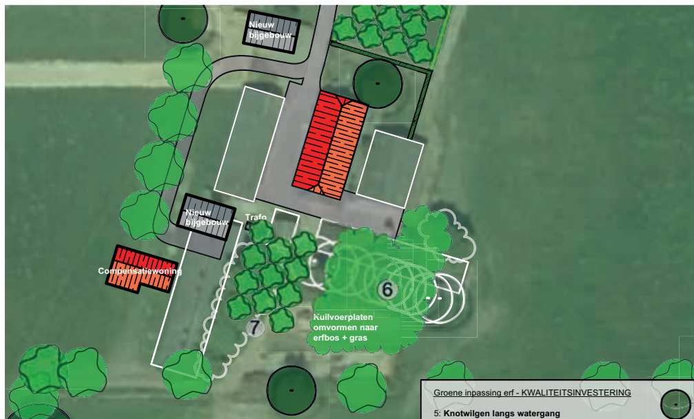
Figuur 15. Positionering compensatiewoning (linksonder) versus bestaande woning (midden)

Op het voorerf tussen de kuilvoerplaten en de siertuin van de bestaande boerderijwoning wordt een hoogstam fruitboomgaard - element 3 - gerealiseerd met rondom een ligusterhaag, element 2.