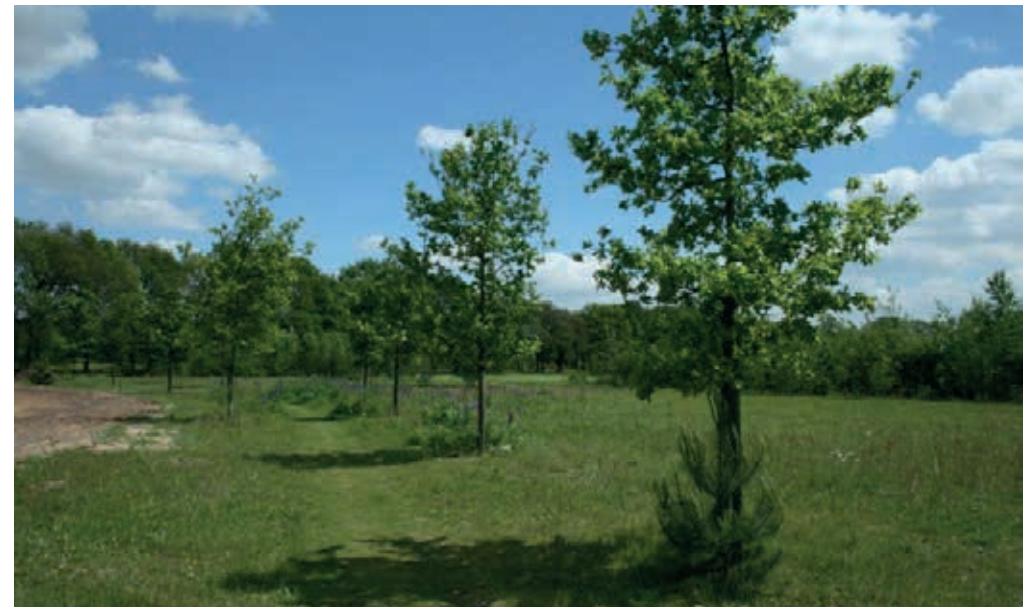
Figuur 16 Bomenrij ten westen van het erf sluit het erf af.