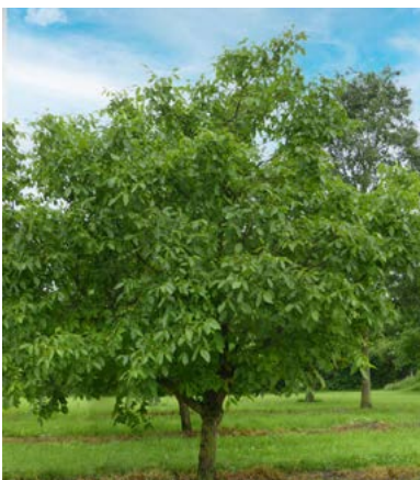
Solitaire Walnoot tussen bakhuis en open veeschuur