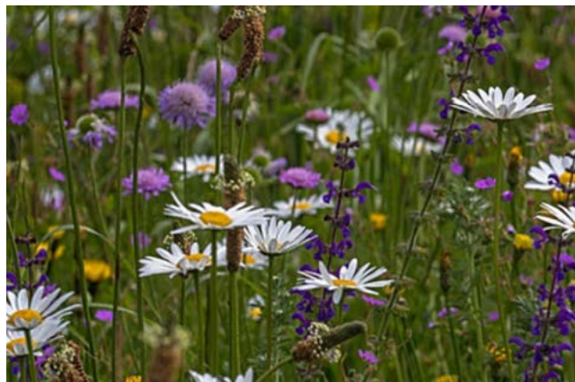
Bloemrijk graslandmengsel onder lindes en in weidje voor de boerderij

sfeerbeelden | formaat A4 | datum: 2 augustus 2021