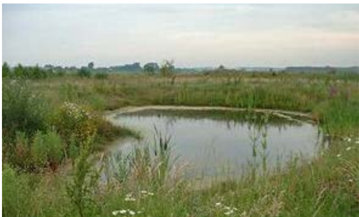
Plasdraszone langs sloot