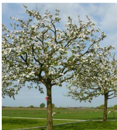
Rij fruitbomen aan de rand van de tuin langs de Molenhoekweg