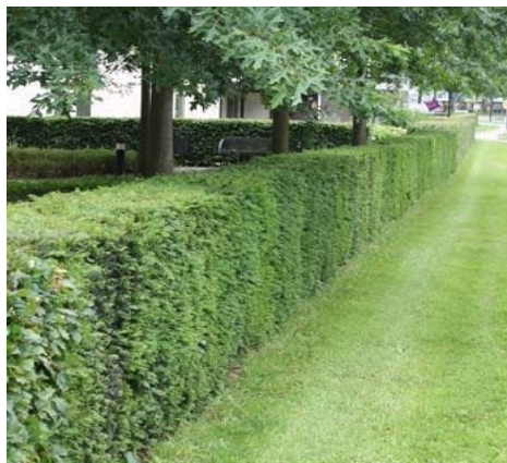
Strakke beukenhaag om de siertuin van de boerderij