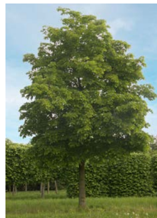
Lindes langs schuur Molenhoekweg