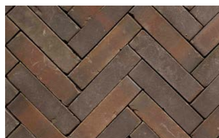
Klinkers aan woonzijde boerderij