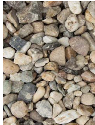
Grindstrook voor de boerderij