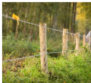
Paaltjes afrastering als transparante overgang