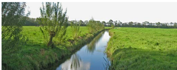
Rij knotwilgen in bocht Molenhoekweg, Oude Twentseweg