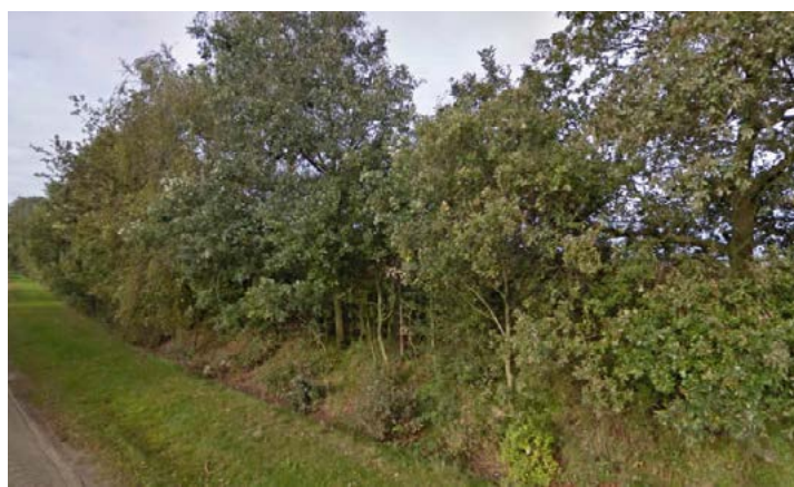
Singel met enkele boomvormers bestaande uit esdoorn, eik, krent, liguster, hondsroos, kornoelje en vuilboom