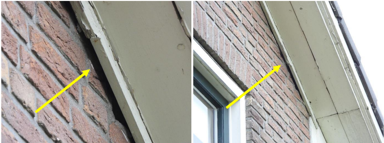
Potentiële invliegopening van vleermuizen.

waargenomen. Soorten die mogelijk een verblijfplaats in de woning bezetten zijn gewone dwergvleermuis en laatvlieger. Vleermuizen kunnen de woning benutten als zomer-, winter- kraam- en paarverblijfplaats.