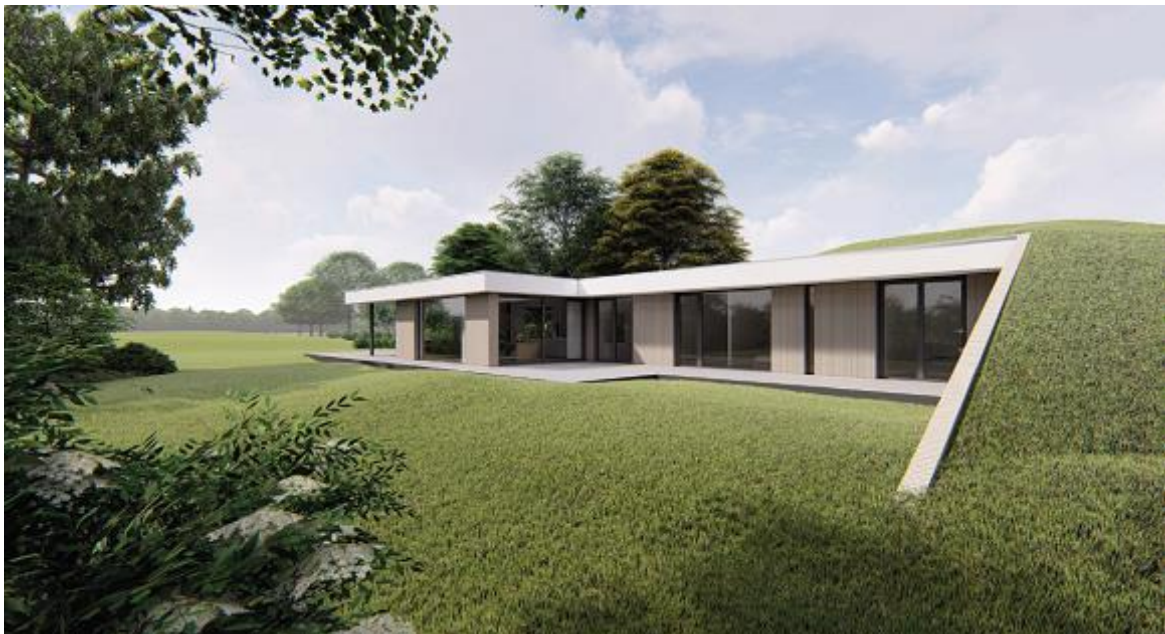
Impressie van de te bouwen woning.

De volgende activiteiten worden getoetst op relevantie t.a.v. de Wet natuurbescherming: