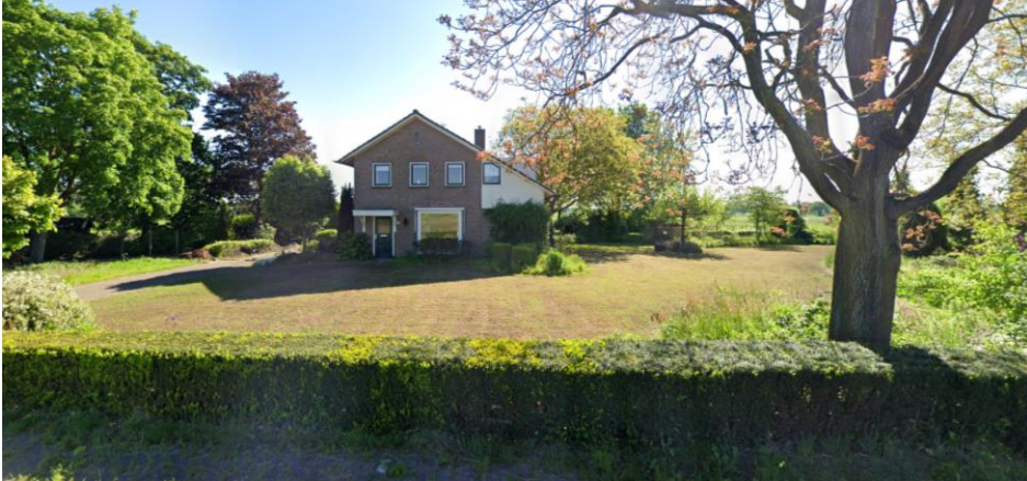
Aanzicht op het plangebied vanaf de Retraiteweg in het voorjaar (2021) (bron: Google streetview).