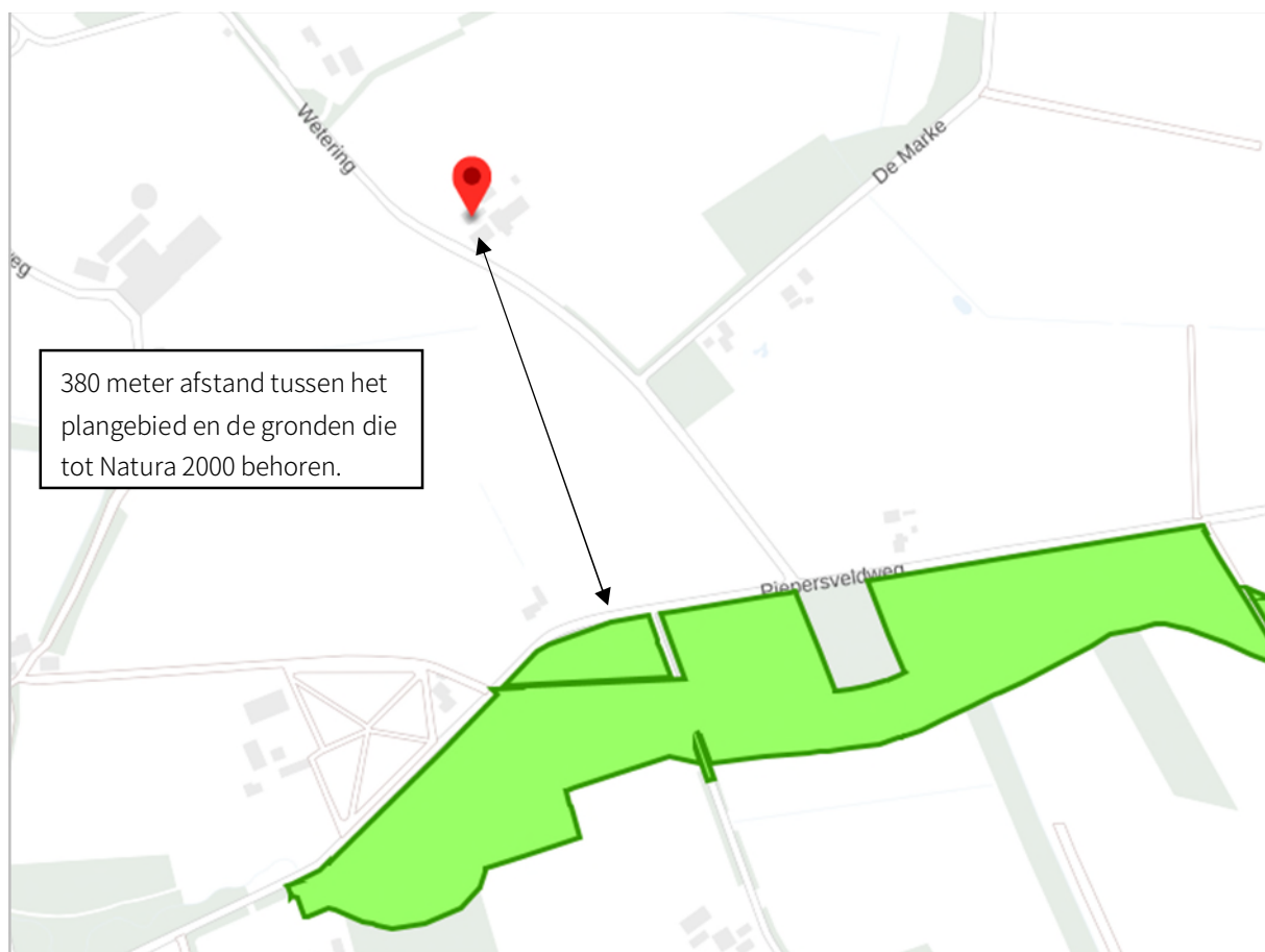
Figuur 4.1: Ligging plangebied t.o.v. Natuurnetwerk Nederland.