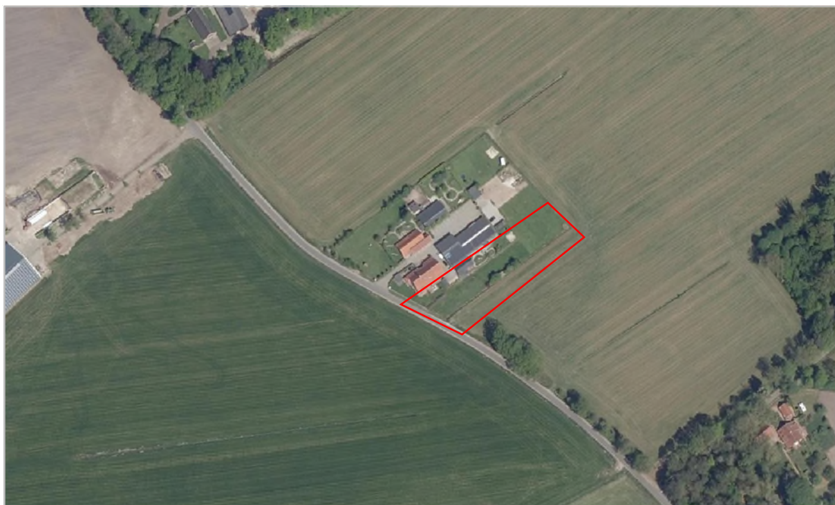
Figuur 2.2: Begrenzing van het plangebied.