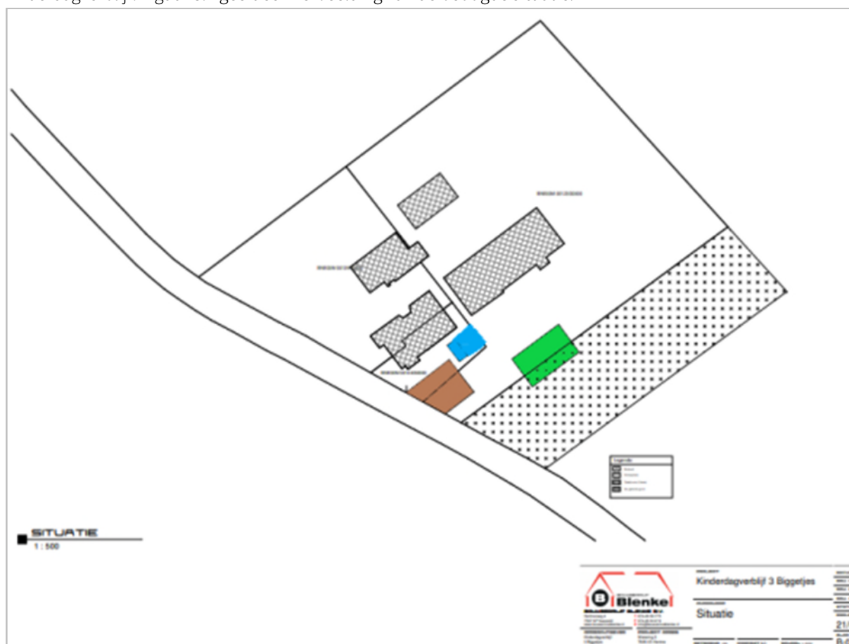
Figuur 3.1: Verbeelding van de beoogde situatie.

Er zijn concrete plannen voor de uitbreiding van het kinderdagverblijf De Drie Biggetjes aan Wetering 3 te Hertme. De uitbreiding gaat plaatsvinden ten zuidoosten van de bestaande bebouwing. Hiervoor wordt verharding aangebracht voor de parkeerplaats met extra inrit ter plaatse van het bruine vlak. De uitbreiding is gewenst op de locatie van het groene vlak. Het erf wordt na de uitbreiding landschappelijk ingericht door middel van het aanplanten van beplanting in zowel het plangebied als op het erf van het bestaande kinderdagverblijf. Figuur 3.1 geeft een verbeelding van de beoogde situatie.