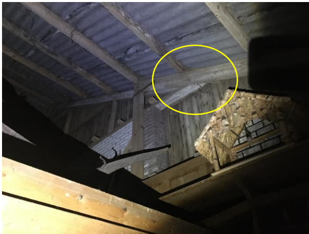
Oud nest van een houtduif in de grote schuur.

Het plangebied wordt als functioneel leefgebied voor vogels beschouwd. Vogels benutten het plangebied als foerageergebied, en vermoedelijk nestelen er jaarlijks vogels in de beplanting en de grote schuur. Er nestelen geen vogels in de woning. Vogelsoorten die mogelijk in het plangebied nestelen zijn vink, merel, koolmees, pimpelmees, winterkoning, witte kwikstaart, holenduif en houtduif. Er zijn in het plangebied geen huismussen waargenomen en er zijn geen aanwijzingen gevonden dat steen- of kerkuil er een vaste rust- of voortplantingsplaats bezetten in het plangebied. Vaste rust- en voortplantingsplaatsen van steen- en kerkuil in gebouwen zijn doorgaans eenvoudig vast te stellen aan de hand van schijfsporen, braakballen en ruiveren. Ook zijn geen (oude) nesten van huiszwaluw of boerenzwaluw in het plangebied aangetroffen.