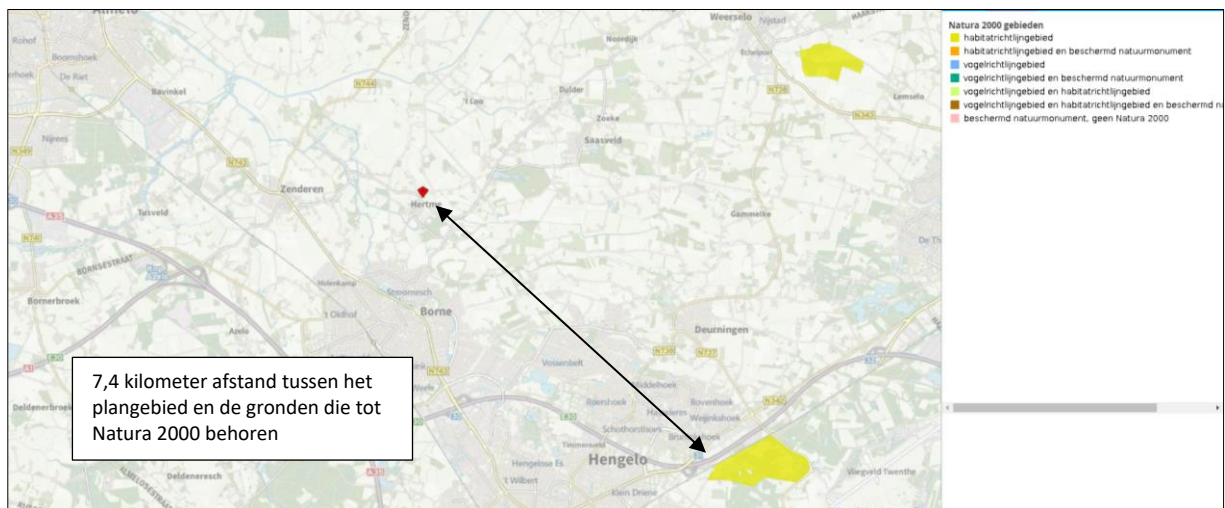
Ligging van Natura 2000-gebied in de omgeving van het plangebied. De ligging van het plangebied wordt met de rode marker aangeduid. Gronden die tot Natura 2000 behoren worden met de okergele kleur aangeduid.

Het plangebied ligt op minimaal 7,4 kilometer afstand van het Natura 2000-gebied Lonnekermeer. Op onderstaande afbeelding wordt de ligging van Natura 2000-gebied in de omgeving van het plangebied weergegeven.