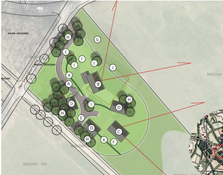
Concept-inrichtingsplan voor het nieuwe erf. Het definitieve inrichtingsplan is nog niet vastgesteld.

Het voornemen bestaat om alle bebouwing in het plangebied te slopen en verharding te verwijderen om vervolgens twee woningen met bijgebouw in het plangebied te bouwen. Vermoedelijk wordt een deel van de aanwezige beplanting geroid. Het erf wordt nadien landschappelijk ingepast d.m.v. de aanplant van erfbeplanting.