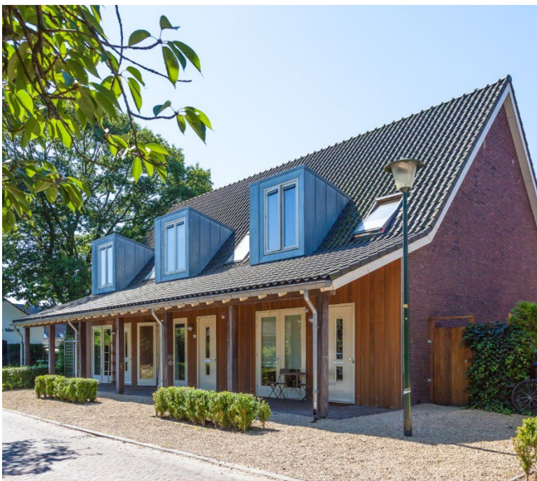
Figuur 1 openslaande deuren of een schuifpui zorgen voor een directe verbinding tussen binnen en buiten; ook bij smalle woningen