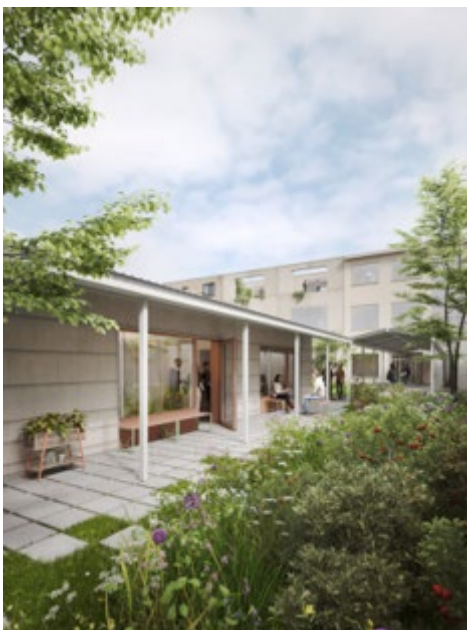
een bankje als onderdeel van de stoep leidt tot sneller gebruik van deze zone