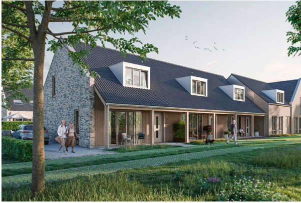
overstekken en veranda's boven de stoep maken deze overgangszone tussen binnen en buiten aantrekkelijker om te gebruiken