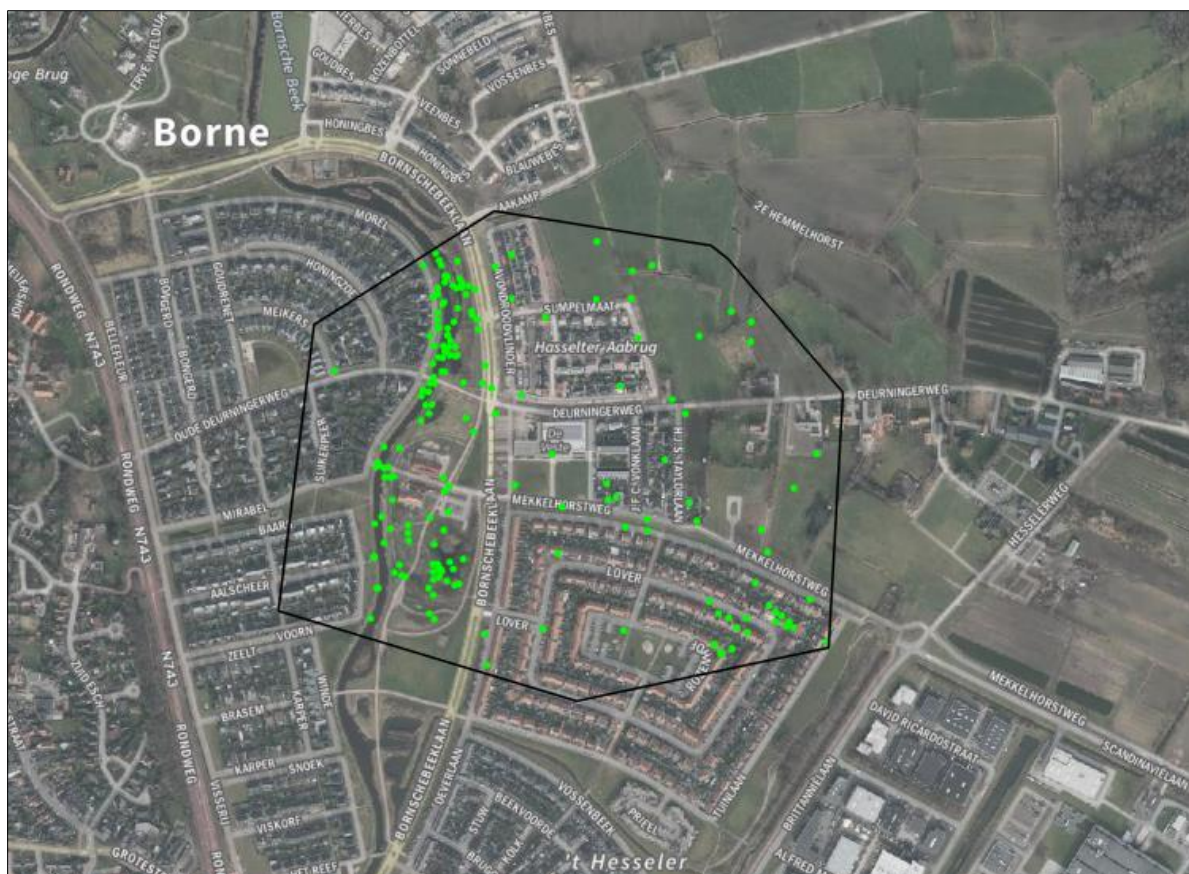
Waarnemingen van planten en dieren in het plangebied en omgeving.

Uit de NDFF is gebleken dat het plangebied, en de directe omgeving (zie kaart onder) tot functioneel leefgebied van verschillende (beschermd) planten en dieren behoort, waaronder vleermuizen, grondgebonden zoogdieren, vogels, amfibieën, planten en ongewervelden.