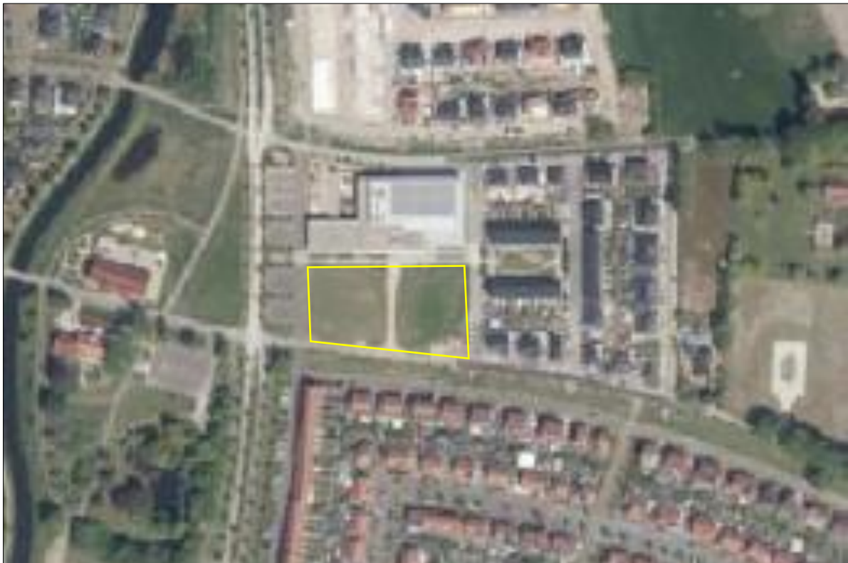
Begrenzing van het plangebied; deze wordt met de gele lijn aangeduid.

Het plangebied ligt direct ten zuiden van de KBS De Vonder gelegen aan de H.F. Roetgerinklaan 1 en ligt in het oostelijke deel van de woonkern Borne en wordt omgeven door stedelijk gebied. Het plangebied bestaat uit grasland en onverharde weg. Dit grasland bestaat uit een soortenarme vegetatie en wordt intensief beheerd (bemesten, maaien en afvoeren maaisel). Op onderstaande afbeelding wordt de begrenzing van het plangebied weergegeven. Voor een verbeelding van de huidige situatie wordt verwezen naar de fotobijlage.