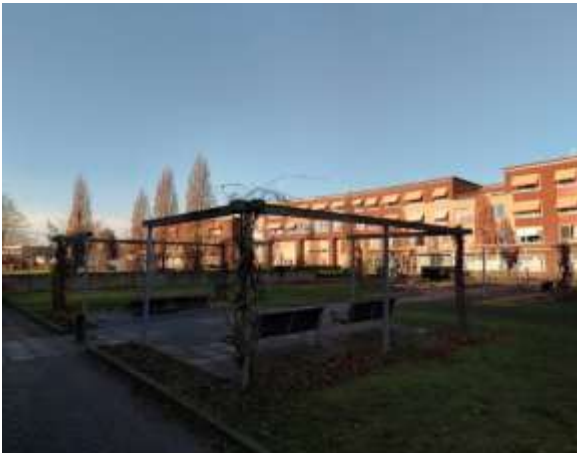
Vogels kunnen nestelen in de klimop in het plangebied.

Te beoordelen activiteit in het kader van de Wnb: