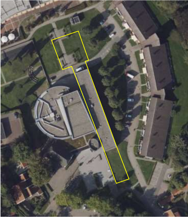
Begrenzing van het plangebied; deze wordt met de gele lijnen aangeduid.