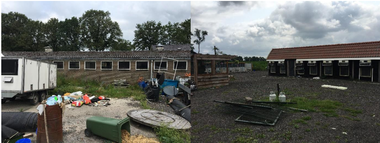
Amfibieën kunnen een (winter)rustplaats bezetten onder verspreide spullen/materialen in de buitenruimte.

Tijdens het veldbezoek zijn geen amfibieën waargenomen, maar gelet op de inrichting en het gevoerde beheer, wordt het plangebied als functioneel leefgebied voor sommige algemene en weinig kritische amfibieënsoorten beschouwd. Amfibieën als bruine kikker en gewone pad benutten het plangebied als foerageergebied en mogelijk bezetten ze er een (winter)rustplaats. Deze soorten kunnen een (winter)rustplaats bezetten onder de verspreide spullen/materialen in de buitenruimte. De bebouwing is voor amfibieën niet toegankelijk en daardoor niet geschikt om een (winter)rustplaats in te bezetten. Het plangebied wordt niet als functioneel leefgebied van zeldzame amfibieënsoorten als kamsalamander, rugstreppad of poelkikker beschouwd. Geschikt voortplantingsbiotoop ontbreekt in het plangebied.