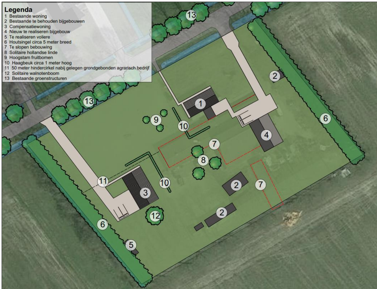
Verbeelding van het wenselijk eindbeeld.

Het voornemen bestaat om één extra woning met bijgebouw in het plangebied te realiseren. Om deze nieuwbouw in het plangebied te realiseren dient de stal met aanbouw, de hondenverblijven en de veranda gesloopt te worden. De nieuwbouw wordt d.m.v. nieuw aan te leggen verharde inritten in verbinding gebracht met de Westermaatweg. Aangenomen wordt dat een deel van de bestaande erfverharding verwijderd en vervangen wordt en dat er nieuwe erfverharding wordt aangelegd. Het plangebied wordt nadien landschappelijk ingepast middels aanplant van erfbeplanting. Op onderstaande afbeelding is een plattegrond van het wenselijk eindbeeld weergegeven.