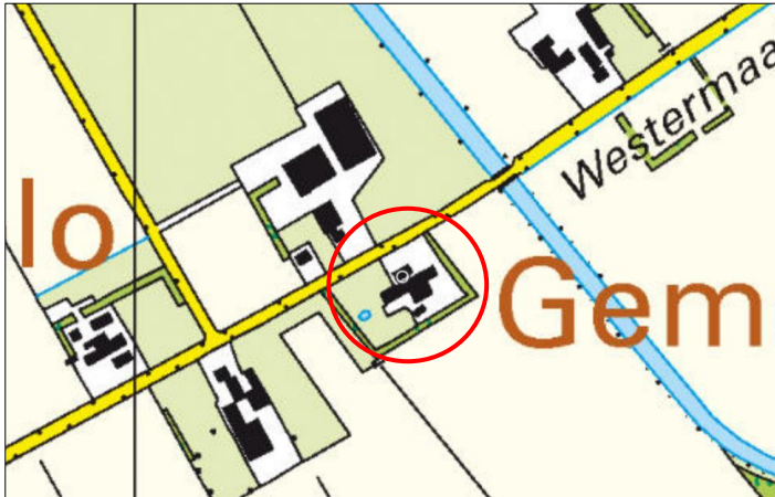
Globale ligging van het plangebied. De ligging van het plangebied wordt met de rode cirkel aangeduid.

Het plangebied ligt aan de Westermaatweg 7 te Almelo. Het ligt circa 1 kilometer ten noorden van de woonkern Almelo en wordt omgeven door landelijk gebied. Op onderstaande afbeelding wordt de globale ligging van het plangebied weergegeven op een topografische kaart.