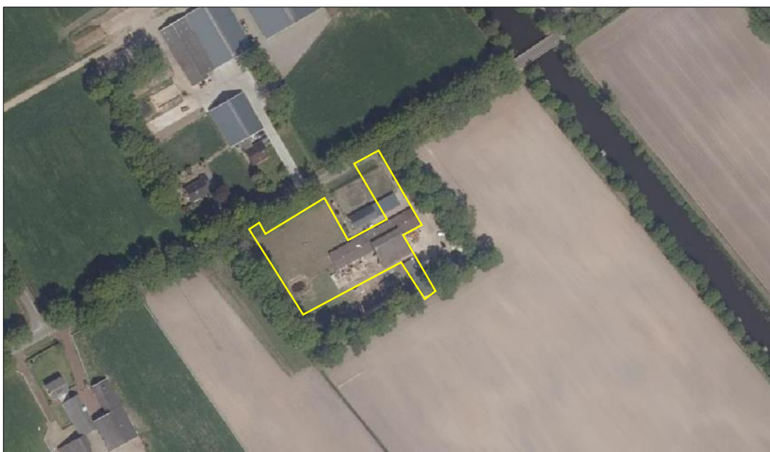
Begrenzing van het plangebied; deze wordt met de gele lijn aangeduid.

Het plangebied bestaat uit bebouwing, beplanting, erfverharding, grasland en opgeslagen spullen/materialen. De bebouwing bestaat uit een stal met aanbouw, hondenverblijven en een veranda. De stal en aanbouw beschikken over gemetselde buitengevels met luchtspouw. De buitengevels van de aanbouw zijn deels met golfplaten betimmerd. De stal en de aanbouw zijn gedekt met golfplaten maar alleen de stal beschikt over dakisolatie. De hondenverblijven zijn gedekt met golfplaten. De veranda staat tegen de oostzijde van de woning gebouwd. Het grasland bestaat uit een soortenarme vegetatie en wordt intensief beheerd. In de stal met aanbouw en buitenruimte liggen spullen/materialen opgeslagen/verspreid (o.a. planken, oud ijzer, plastic en bakstenen). Op onderstaande luchtfoto is de begrenzing van het plangebied aangegeven. Voor een verbeelding van de huidige situatie wordt verwezen naar de fotobijlage.