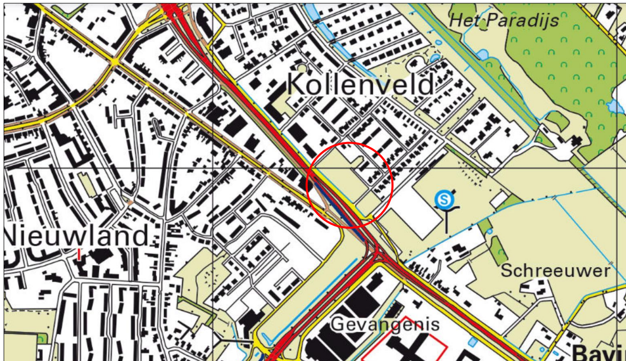
Globale ligging van het plangebied. De ligging van het plangebied wordt met de rode cirkel aangeduid.

Het plangebied is een braakliggend stuk grasland dat in het zuidoosten van de stad Almelo ligt. Het is gesitueerd tussen Hospitaalweg, Toekomstweg, Het Vossenkamp en Het Grote Hofstee in Almelo. Op onderstaande afbeelding wordt de globale ligging van het plangebied weergegeven op een topografische kaart.