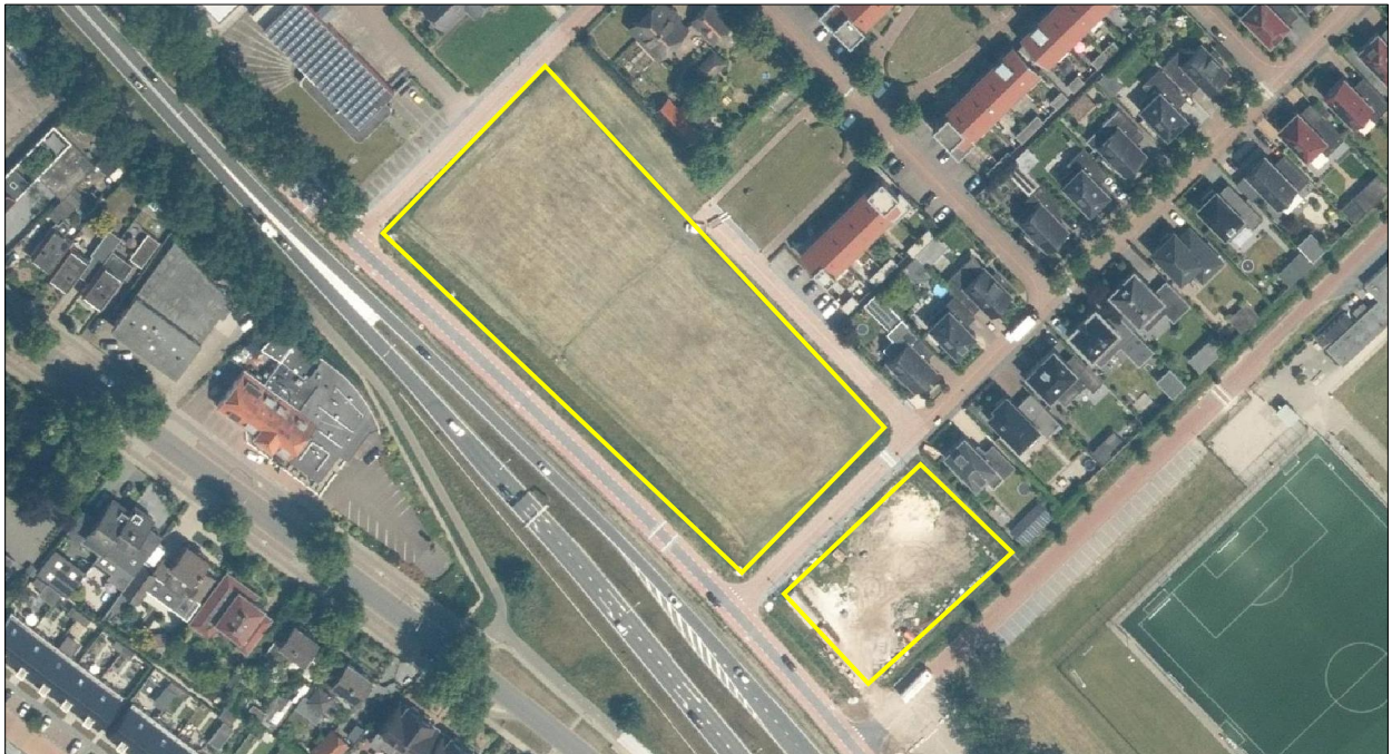
Luchtfoto en begrenzing van het plangebied aangegeven met de gele lijn.

Het plangebied bestaat uit twee een braakliggende stukken grasland. De randen van het grasland zijn ingezaaid met een bloemenmengsel.