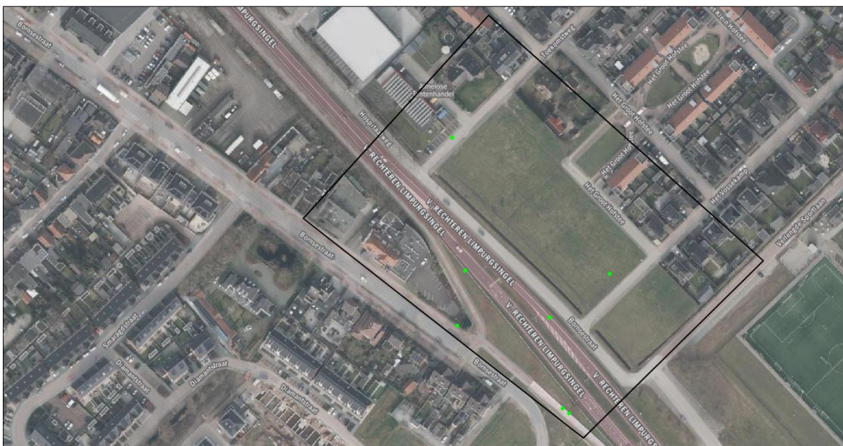
Verspreiding van alle bekende flora- en faunawaarnemingen records in het plangebied; deze worden met de groene stip aangeduid. Met de zwarte lijn wordt het zoekgebied weergegeven.

Op 18 juli 2023 is de NDFF geraadpleegd en is gekeken of waarnemingen van beschermde planten en dieren aanwezig zijn in de databank. In de NDFF zijn 7 waarnemingen vastgesteld in de directe omgeving van het plangebied. Er is in het plangebied op het grasveld een roek waargenomen. Op de toekomstweg ten noordwesten van het plangebied is een donker kaasjeskruid waargenomen. Op de weg ten zuiden van het plangebied is een witte kwikstaart, een groenling, een zwarte kraai, een ekster en een aardhommel waargenomen. De opgenomen waarnemingen betreft een algemeen en veelvoorkomende vaatplant. De vogels die zijn waargenomen betreffen losse waarnemingen. Er zijn geen broedende vogels waargenomen in het plangebied. Op de onderstaande afbeelding staat het zoekgebied in de NDFF weergegeven.