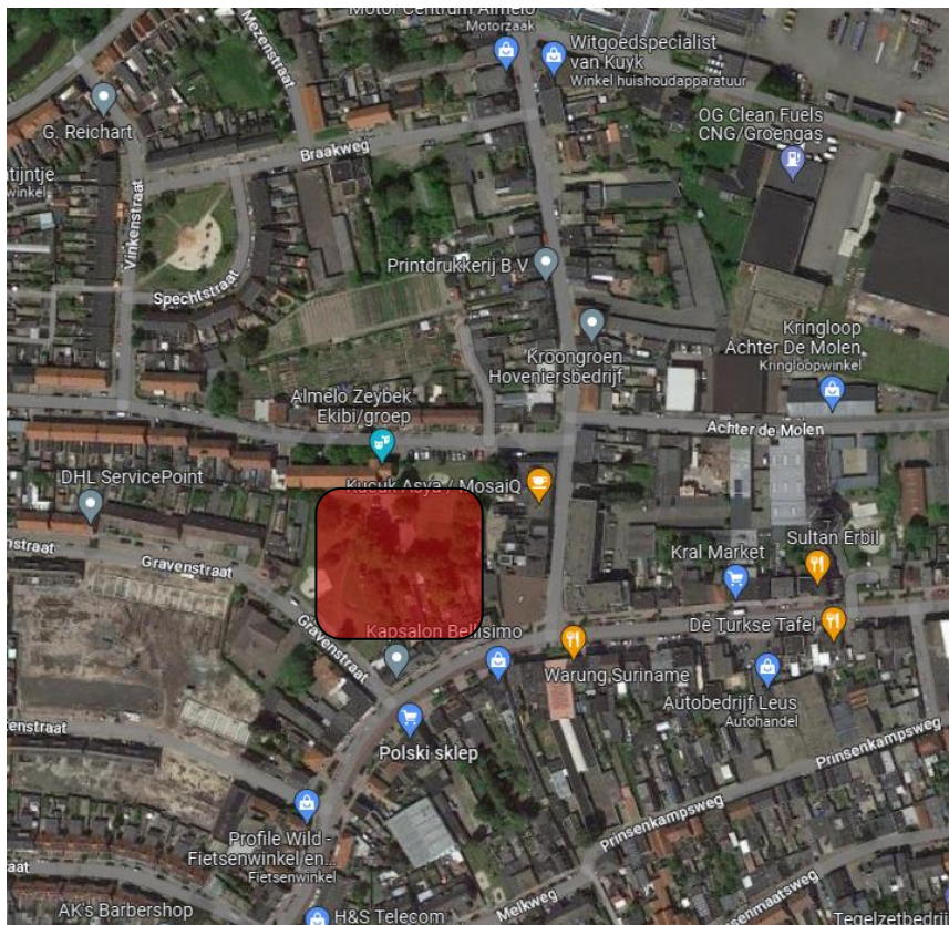
Ligging plangebied tov haar omgeving

Het plangebied ligt niet in of nabij een gebied dat beschermd wordt vanuit de natuurwaarden en maakt geen onderdeel uit van de Ecologische Hoofdstructuur. Het plangebied valt niet binnen een Habitatrichtlijn- of Vogelrichtlijngebied en heeft door de afstand geen relatie met de dichtstbijzijnde speciale beschermingszones. Het plangebied is dus niet in of nabij een gevoelig gebied gelegen.