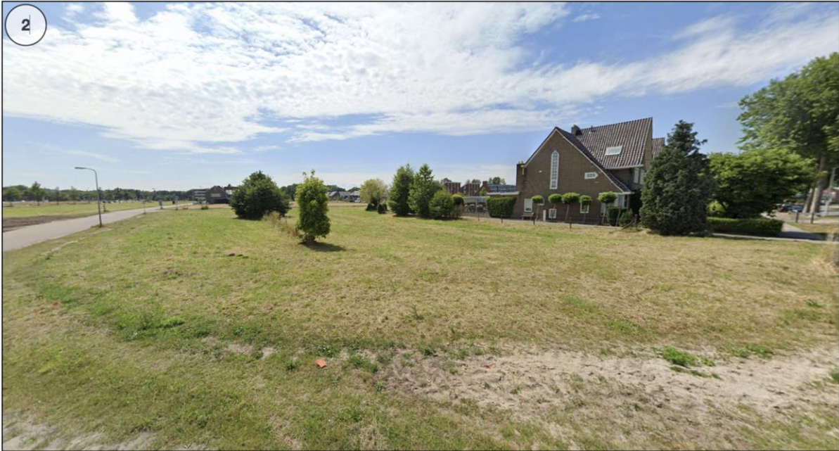
Afbeelding 4 Straatbeeld huidige situatie van het projectgebied noordzijde (Bron: Google streetview, opname juni 2022)