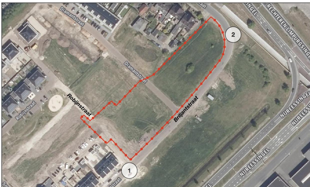
Afbeelding 2 Luchtfoto huidige situatie van het projectgebied en de omgeving