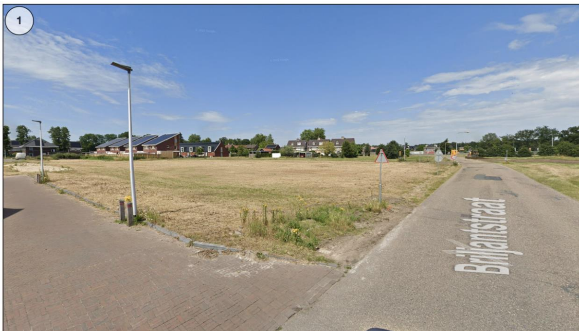
Afbeelding 3 Straatbeeld huidige situatie van het projectgebied zuidzijde