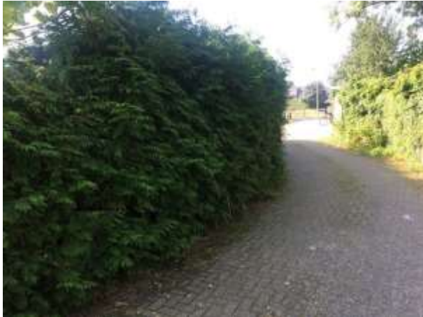
Een coniferenhaag vormt een nestplaats voor vogels.

huismussen waargenomen en de bebouwing wordt niet beschouwd als potentiële nestplaats voor gierzwaluwen. Gierzwaluwen nestelen in Overijssel in grotere dorpen en in steden, niet in kleine kernen zoals Bornerbroek (bron: NDFF). Vogelsoorten die mogelijk in het plangebied nestelen zijn merel, vink, roodborst, zwartkop en houtduif. Tevens zijn er in het plangebied geen aanwijzingen gevonden dat uilen en roofvogels er een vaste rust- of nestplaats bezetten.