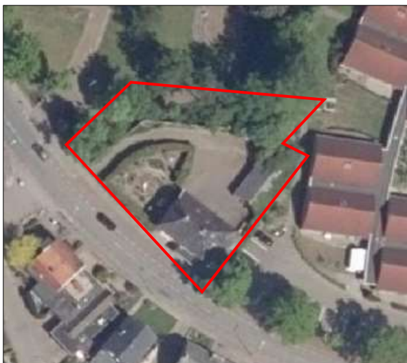
Begrenzing van het onderzoeksgebied; deze wordt met de rode lijn aangeduid.