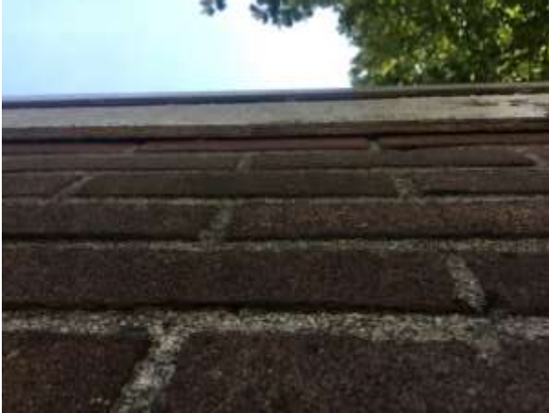
De houten boeiboord is strak tegen de buitengevel bevestigd en biedt vleermuizen geen verblijfplaats tussen de muur en de boeiboord.

aangetroffen in de buitengevels, die vleermuizen de kans bieden een verblijfplaats te bezetten in de luchtspouw of het gebouw. Verder zijn in het plangebied geen potentiële verblijfplaatsen van vleermuizen waargenomen, zoals een holle ruimte achter een boeiboord, windveer, loodslab, vensterluik, zonnewering of gevelbetimmering aangetroffen. Ook sluit de betimmering van de overstek naadloos aan op de buitengevels. De aanbouw beschikt over een houten boeiboord, maar deze is naadloos op de buitengevel bevestigd, zodat vleermuizen er geen verblijfplaats achter kunnen bezetten. Tevens zijn er geen holenbomen waargenomen die vleermuizen een potentiële verblijfplaats kunnen bieden.