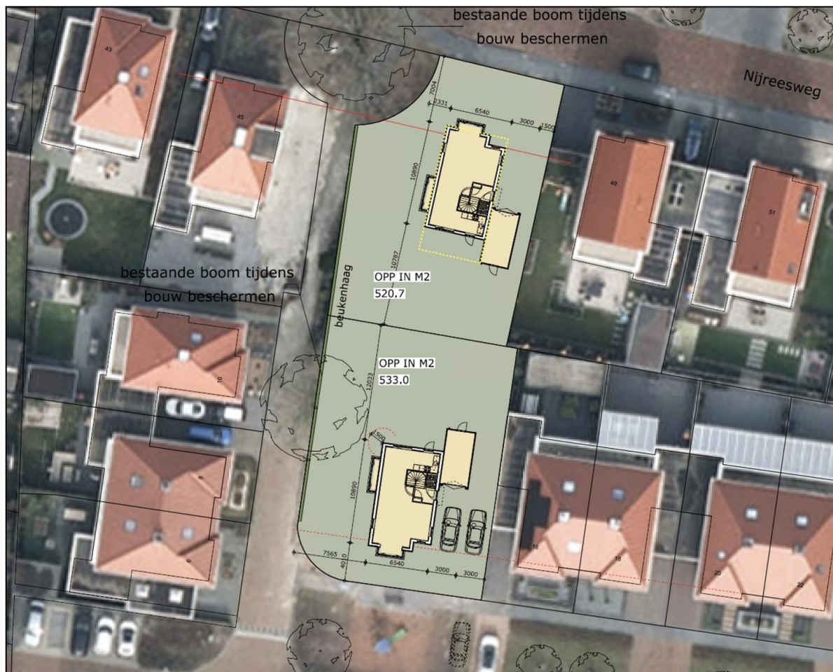
Afbeelding 3.1 Impressie gewenste situatie

In afbeelding 3.1 is de gewenste situatie weergegeven. Het gaat om de realisatie twee vrijstaande woningen. In onderstaande situatie is een eerste schets opgenomen.