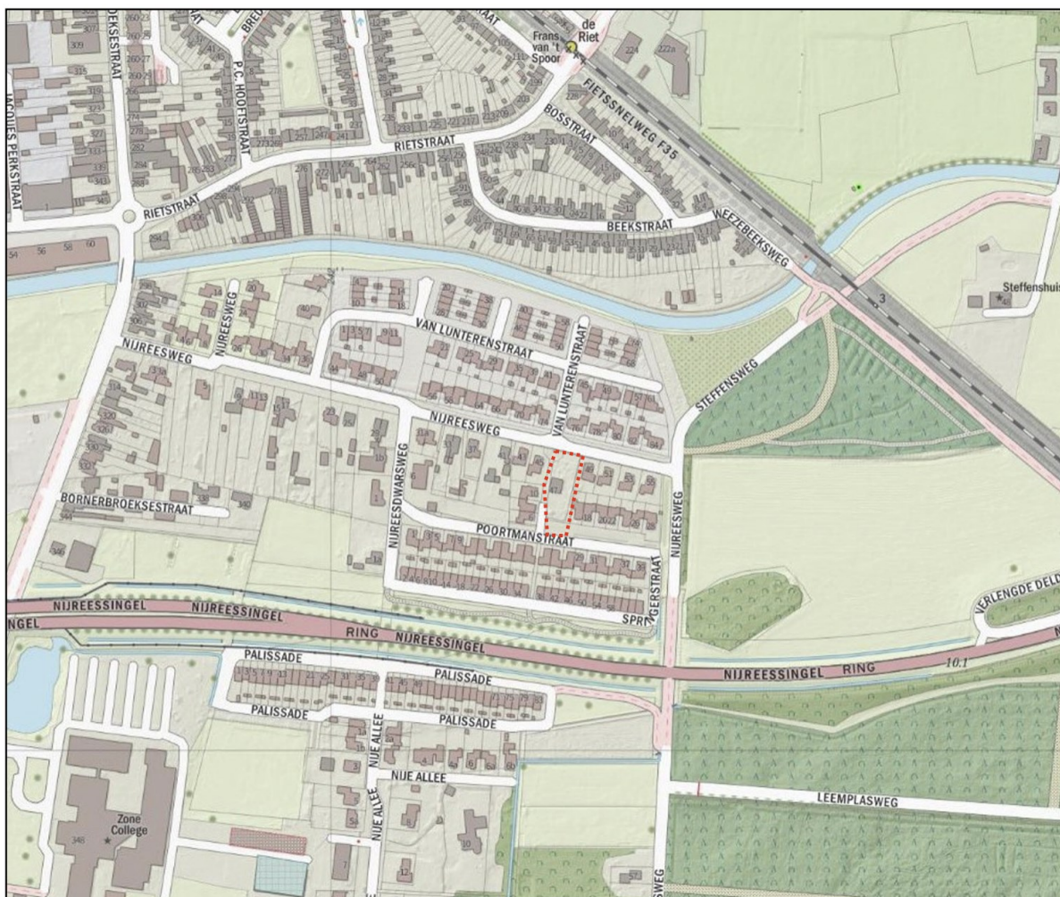
Afbeelding 1.1: Locatie projectgebied ten opzichte van de directe omgeving

Op het perceel aan de Nijreesweg 47 te Almelo bestaat het voornemen om twee nieuwe, vrijstaande woningen te bouwen. De bestaande verouderde woning ter plaatse wordt gesloopt. In afbeelding 1.1 is de locatie van het projectgebied indicatief met rode stippellijn weergegeven.