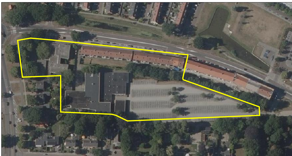
Detailopname en begrenzing van het plangebied. De begrenzing van het plangebied wordt met de gele lijn aangeduid.