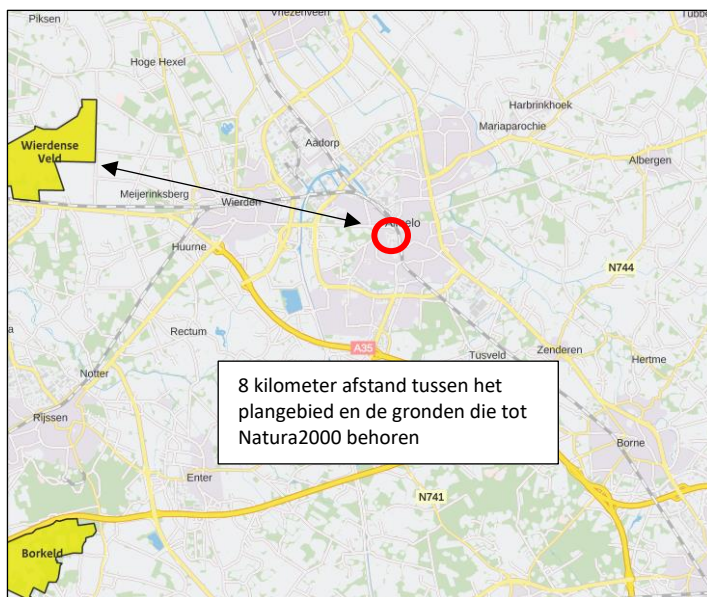
Ligging van Natura2000-gebied in de omgeving van het plangebied. De ligging van het plangebied wordt met de rode cirkel aangeduid. Gronden die tot Natura2000 behoren worden met de okergele kleur aangeduid.

Het plangebied ligt op minimaal op 8 kilometer afstand van Natura 2000-gebied. Het meest nabij gelegen Natura 2000-gebied, is het Wierdense Veld. Er ligt nog een ander Natura 2000-gebied in de omgeving van het plangebied maar deze ligt op grotere afstand (>10km). Op onderstaande afbeelding wordt de ligging van het Natura 2000-gebied in de omgeving van het plangebied weergegeven.