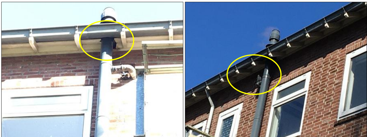
Afbeelding links: invliegopening van de kauw. Afbeelding rechts: één van de nestelende kauwen in het plangebied.

Het plangebied behoort tot functioneel leefgebied voor verschillende vogelsoorten. Vogels benutten de buitenruimte als foerageergebied en er nestelen jaarlijks vogels in de nestkastjes, gebouwen, bomen, struiken en in dichte vegetatie op de grond. Er zijn bezette nestkasten van kool- en pimpelmees aangetroffen, evenals nesten van kauwen in de woonblokken en een eksternest in een boom. Andere vogelsoorten die mogelijk in het plangebied nestelen zijn houtduif, Turkse tortel, wilde eend, waterhoen, merel, winterkoning, heggenmus, vink, tijftjaf, zwartkop, gierzwaluw en roodborst. Er zijn tijdens het veldbezoek geen huismussen in het plangebied waargenomen. Gelet op de bouwstijl van de woonblokken, worden de woonblokken niet als potentiële nestplaats voor de huismus beschouwd. De woonblokken bestaat uit vier bouwlagen. Indien huismussen een nestplaats zouden hebben bezet in het plangebied, dan waren ze opgemerkt tijdens het veldbezoek. Gelet op de tijd van het jaar en het weer tijdens het veldbezoek, zouden huismussen luidruchtig zijn geweest. Op basis van reeds uitgevoerd nader onderzoek naar gierzwaluwen, wordt een nestlocatie van deze soort in de bebouwing uitgesloten. Er zijn geen oude of potentiële nesten van roofvogels of uilen in of rondom het plangebied waargenomen. Deze nesten zijn doorgaans gemakkelijk te vinden aan de hand van schijfsporen en braakballen.