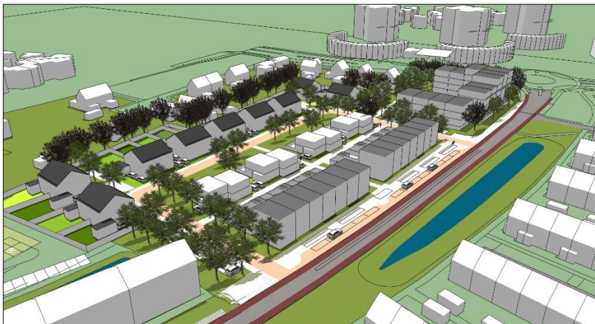
Verbeelding van het wenselijke eindbeeld.

De volgende activiteiten worden getoetst op relevantie t.a.v. de Wet natuurbescherming: