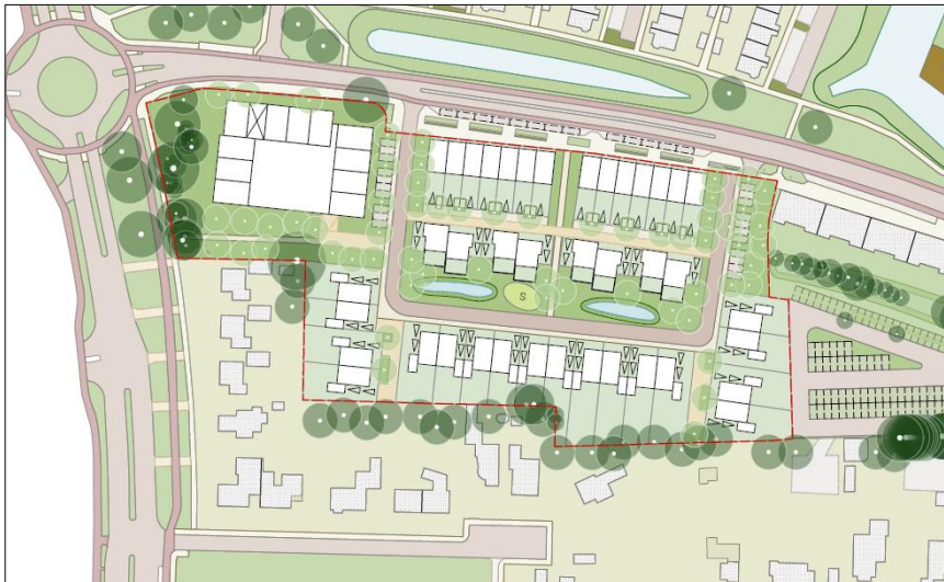
Schets van de wenselijke nieuwe situatie (bron: projectontwikkelaar).

Het voornemen bestaat alle bebouwing aan de Thorbeckelaan te slopen en het terrein te ontwikkelen als woningbouwlocatie. Tevens wordt de watergang vergraven en wordt er beplanting geroid. Op onderstaande afbeeldingen wordt een stedenbouwkundige schets van het plangebied en een verbeelding van het wenselijke eindbeeld weergegeven.