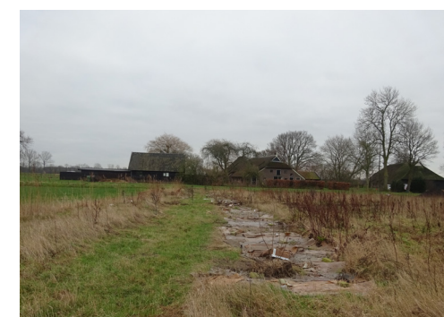
Zicht op de kavel richting Zegelhorstweg met op de achtergrond nr. 3(a) en 4