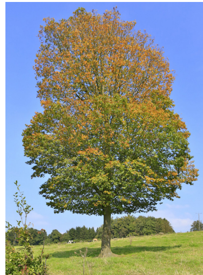
Haagbeuk ( Carpinus betulus )