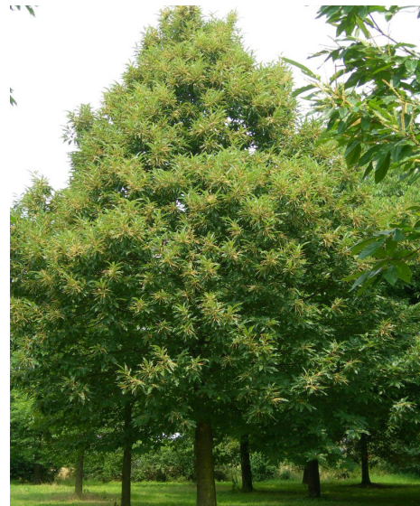
Tamme kastanje ( Castanea sativa )