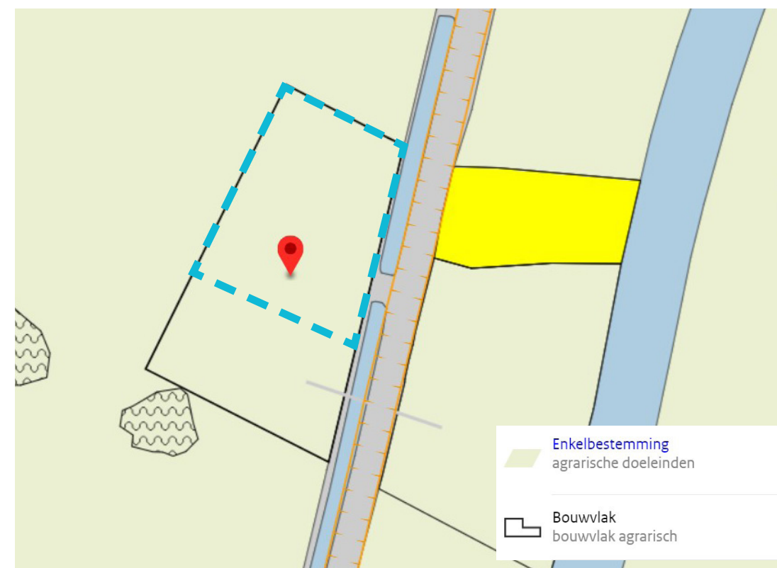
Uitsnede bestemmingsplan 'Meppel buitengebied' (vastgesteld 3 september 2009).