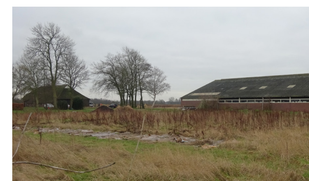
Zicht op de kavel richting melkstal met op de achtergrond nr. 4