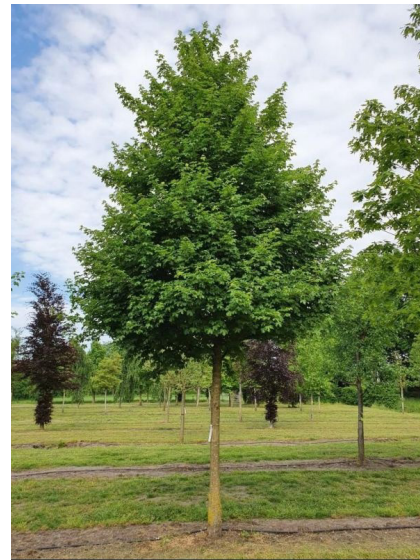
Veldesdoorn ( Acer campestre )