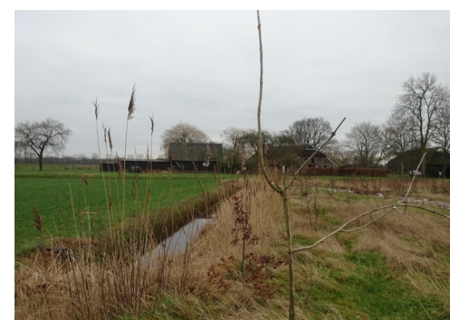
Sloot noordzijde met op de achtergrond nr. 3(a)