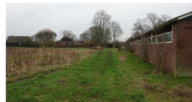
Zijkant van de melkstal richting Zegelhorstweg met zicht op nr. 3(a)