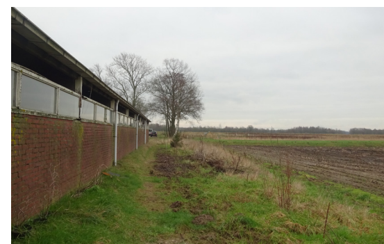
Zijkant van de melkstal met zicht over het slagenlandschap