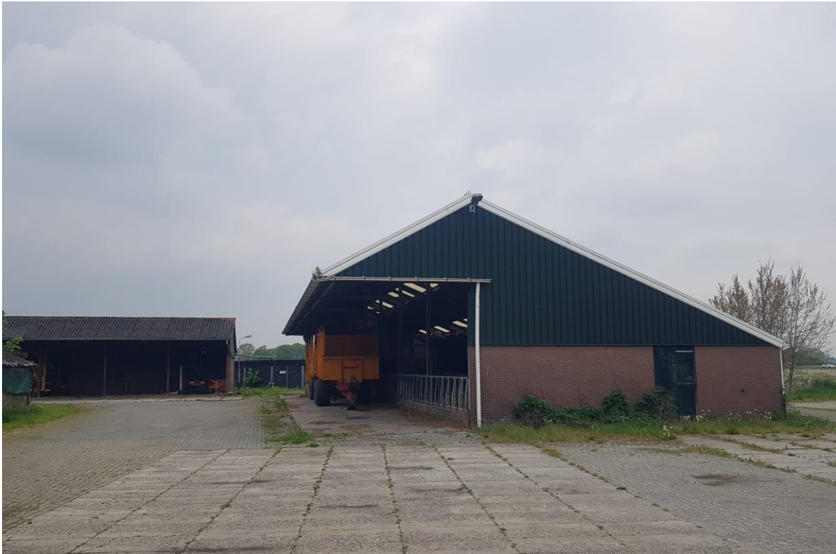
Afbeelding 2: beeld van de te slopen opstallen

Het veldwerk is uitgevoerd door [REDACTED], medewerker Beleid Natuur & Landschap bij Het Drentse Landschap.