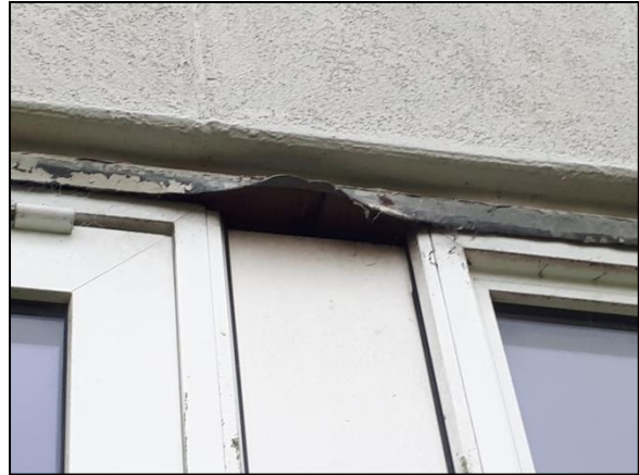
Figuur 20. Ruimte achter daklijst van laagbouw.