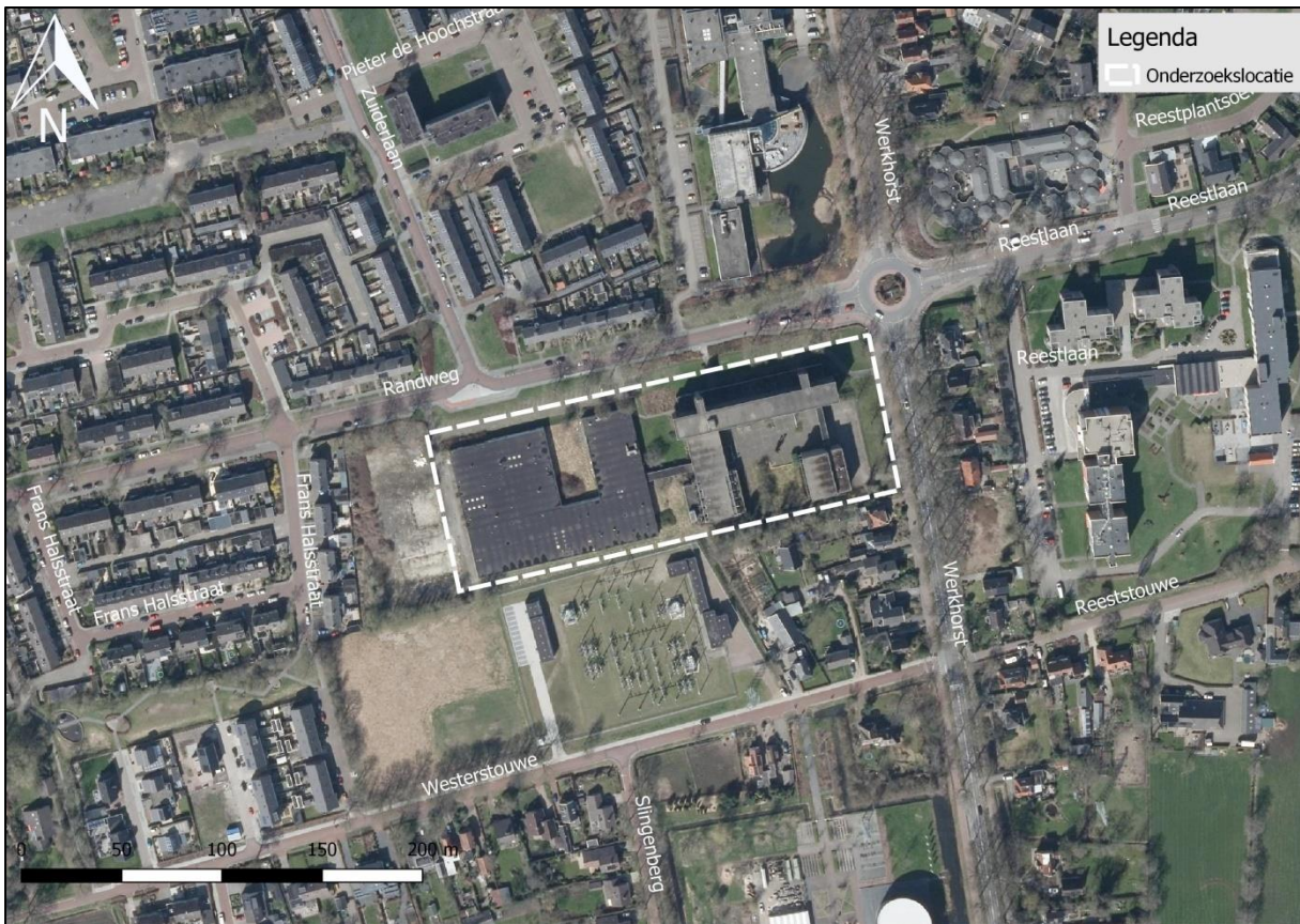
Figuur 2. Luchtfoto onderzoekslocatie en directe omgeving.