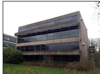
Figuur 5. Oostelijke hoogbouw, gezien vanuit het westen.