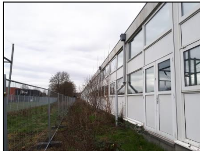
Figuur 10. Westelijke laagbouw, gezien vanuit het zuidoosten.