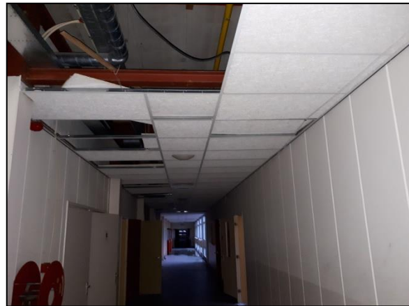
Figuur 23. Grote ruimte tussen verlaagd plafond en beton.

Steenmarters gebruiken hoozolders, loze ruimtes onder het dak, schuurtjes en dergelijke, als verblijfplaats. Een steenmarter heeft binnen zijn territorium verscheidene verblijfplaatsen. Binnen de onderzoekslocatie is bebouwing aanwezig met een verlaagd plafond. De ruimte tussen het verlaagd plafond en het beton is dermate groot dat dit geen geschikte verblijfplaats vormt voor de steenmarter (zie figuur 23). Tijdens het veldbezoek zijn de onderzoekslocatie en alle ruimten binnen de gebouwen grondig onderzocht en zijn geen sporen, zoals uitwerpselen of prooi-resten, aangetroffen die duiden op het gebruik van de onderzoekslocatie als vaste rust- of verblijfplaats door deze soort. Bij intensief gebruik van een locatie door deze soort zijn dergelijke sporen vrij eenvoudig aan te treffen. Gelet op het ontbreken van sporen en meldingen in het NDFF van waarnemingen in de directe omgeving kan worden gesteld dat de onderzoekslocatie niet in gebruik is door de steenmarter. Overtreding van de Wet natuurbescherming ten aanzien van de steenmarter is uitgesloten.