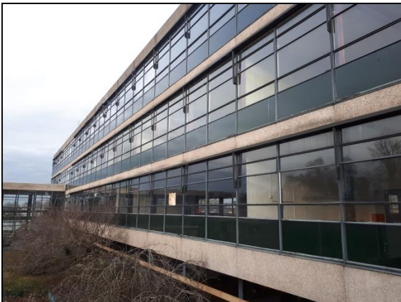
Figuur 21. Zonwering aan zuidzijde van oostelijke hoogbouw.