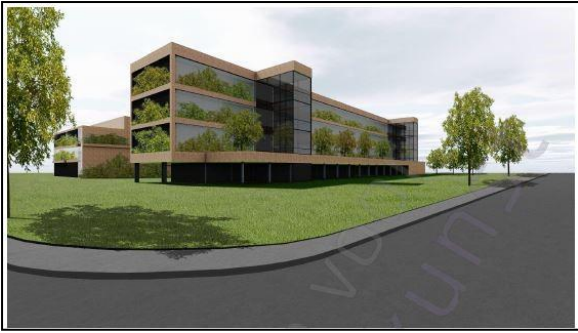
Figuur 17. Impressie van appartementen, gezien vanuit het noordoosten.