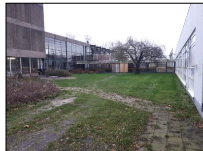
Figuur 8. Loopgang tussen hoog- en laagbouw, gezien vanuit het noorden.