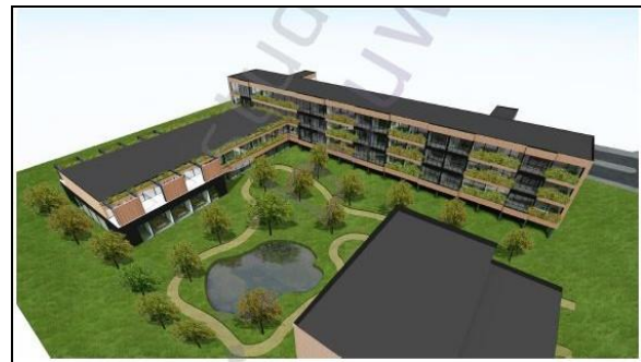
Figuur 16. Impressie van appartementen, gezien vanuit het zuidoosten.