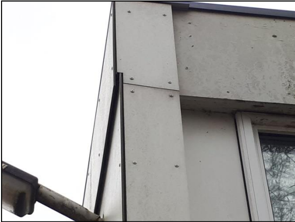
Figuur 19. Ruimte achter betimmering van laagbouw.

De oostelijke hoogbouw (figuur 4 en 5) is niet geschikt als verblijfplaats voor vleermuizen. De aanwezigheid van (massa)winterverblijfplaatsen is, wegens het ontbreken van toegang tot de spouw, uitgesloten.