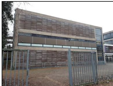
Figuur 4. Oostelijke hoogbouw, gezien vanuit het oosten.