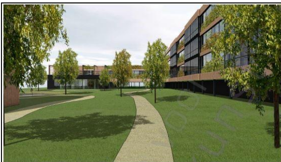
Figuur 15. Impressie van appartementen, gezien vanuit het oosten.

De initiatiefnemer is voornemens de laagbouw op het westelijk deel van de onderzoekslocatie te slopen. De hoogbouw op het oostelijk deel wordt gerenoveerd en herontwikkeld tot appartementencomplex. Figuur 15 t/m 18 geven een impressie van de toekomstige situatie.