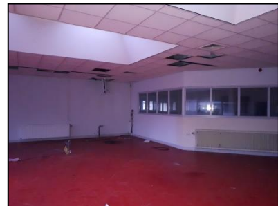
Figuur 14. Eén van de klaslokalen in de laagbouw.