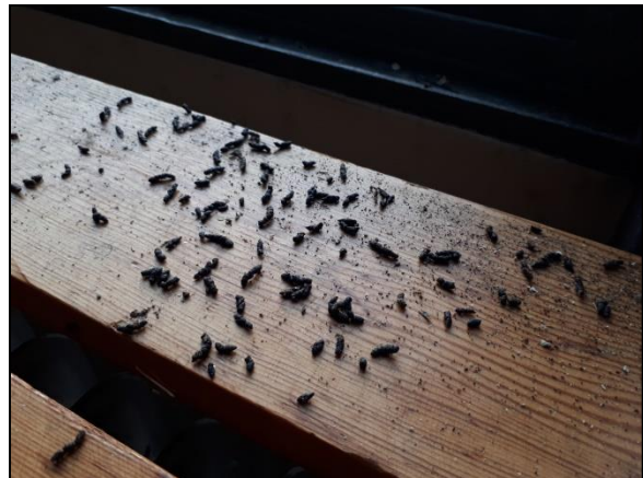
Figuur 22. Vleermuisontlasting op de vensterbank van één van de klaslokalen in de hoogbouw.

De aanwezige bomen op de onderzoekslocatie zijn onderzocht op holtes, spleten en loshangend schors, wat kan dienen als potentiële vaste rust- en verblijfplaats voor boombewonende vleermuizen. Dit is niet aangetroffen en daarmee zijn boombewonende vleermuizen uit te sluiten.