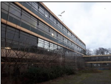
Figuur 6. Noordelijke hoogbouw, gezien vanuit het zuidwesten.