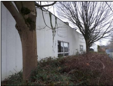
Figuur 9. Westelijke laagbouw, gezien vanuit het noordoosten.