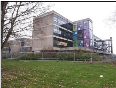
Figuur 3. Noordelijke hoogbouw, gezien vanuit het noordoosten.