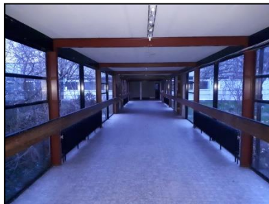
Figuur 13. Loopgang tussen hoog- en laagbouw.