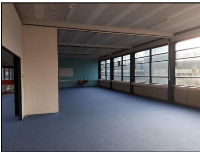
Figuur 12. Eén van de klaslokalen in de hoogbouw.