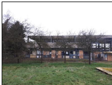
Figuur 7. Westelijke hoogbouw, gezien vanuit het oosten.