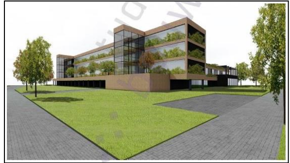
Figuur 18. Impressie van appartementen, gezien vanuit het noordwesten.