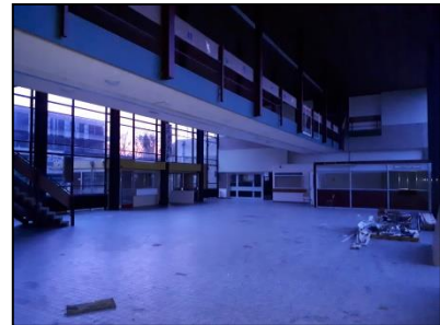
Figuur 11. Centrale hal van hoogbouw.