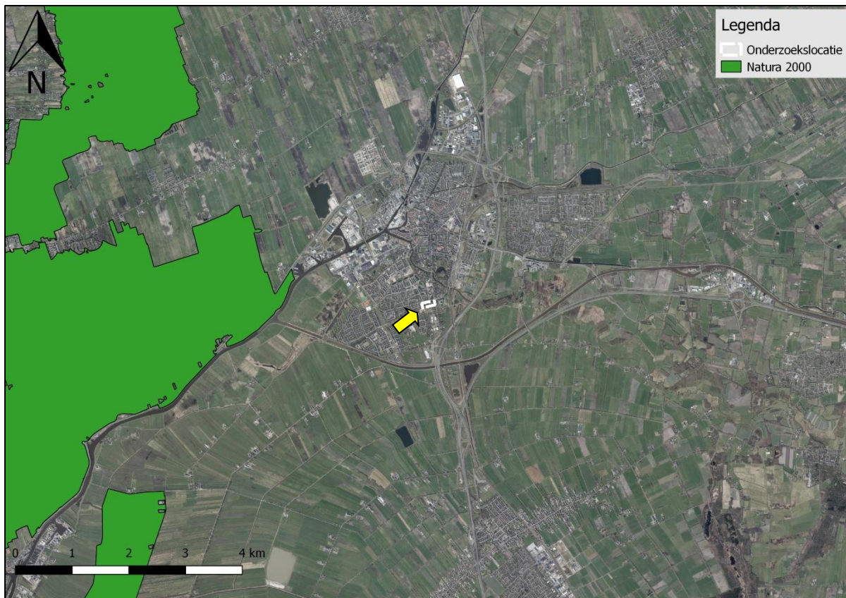
Figuur 24. Ligging onderzoekslocatie ten opzichte van Natura 2000.

De onderzoekslocatie is niet gelegen binnen de grenzen. Het ligt echter wel in de nabijheid van een gebied dat aangewezen is als Natura 2000. Het meest nabijgelegen Natura 2000-gebied, De Wieden, bevindt zich op circa 2,5 km afstand ten westen van de onderzoekslocatie (zie figuur 24). De Wieden bestaan onder andere uit de volgende habitattypen die zeer gevoelig zijn voor stikstofdepositie: H3140 Kranswierwateren, H4010B Vochtige heiden (laagveengebied), H6410 Blauwgraslanden, H7140A Overgangs- en trilvenen (trilvenen) en H7140B Overgangs- en trilvenen (veenmosrietlanden).