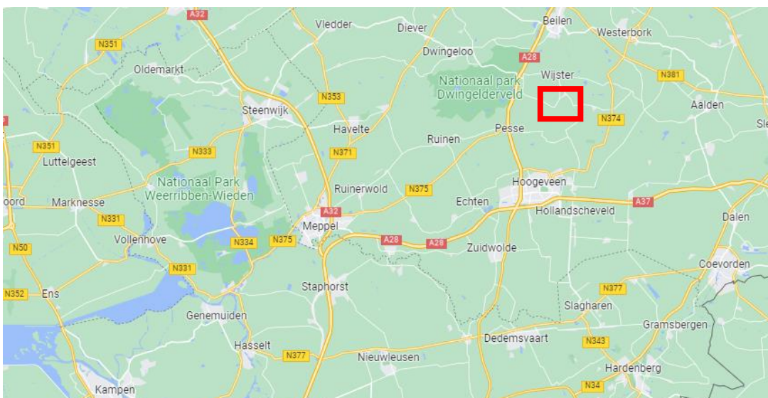
Figuur 1.1 | geografische ligging van het voorgenomen hoogspanningsstation Wijster

De nieuwe hoog- en middenspanningsstations die TenneT, Enexis Netbeheer en Rendo gaan bouwen, worden met ondergrondse hoog- en middenspanningskabels of bovengrondse hoog- en middenspanningsverbindingen verbonden met het bestaande elektriciteitsnetwerk van TenneT. Dit gebeurt met nieuwe of bestaande ondergrondse kabels en bovengrondse verbindingen. Zo worden de nieuwe stations onderdeel van het elektriciteitsnetwerk en zorgen zowel de nieuwe kabels als de nieuwe stations voor versterking van het elektriciteitsnetwerk. In figuur 1.2 is de geografische ligging van het te realiseren hoogspanningsstation Wijster weergegeven.