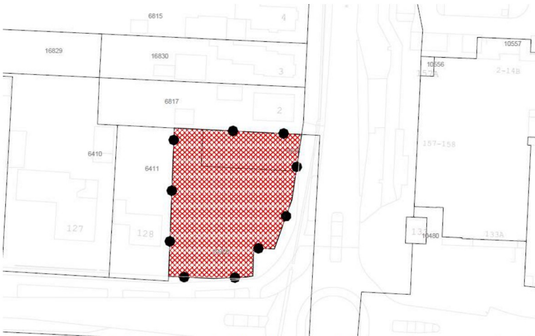
Figuur 1: Besluitvlak behorende bij ontwerpbesluit omgevingsvergunning (oud)