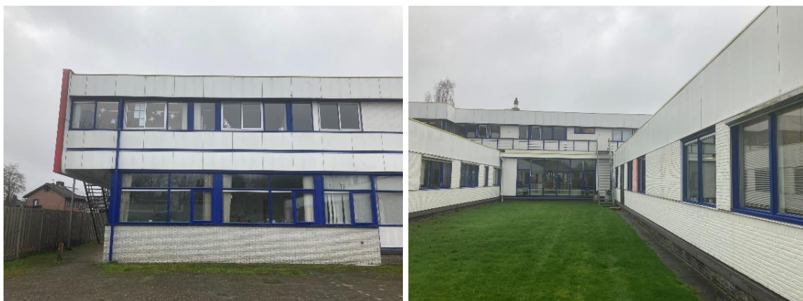
Figuur 2 impressie van het projectgebied