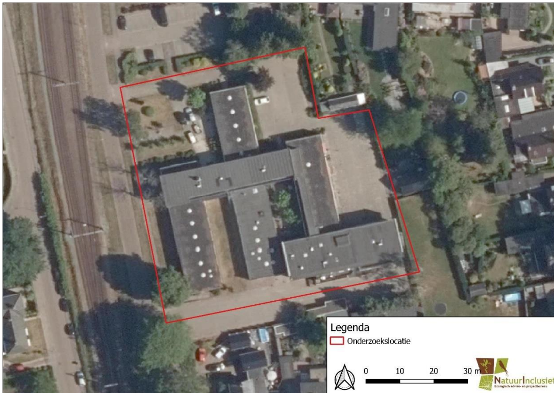
Figuur 1 Begrenzing totale onderzoekslocatie

Het projectgebied is gelegen aan de Parallelweg te Emmen, gemeente Emmen in de provincie Drenthe. Het middelpunt van het projectgebied bevat de coördinaten N 52.788971, E 6.900303). Het projectgebied bestaat uit een kantoorgebouw met twee verdiepingen. Verder is het plangebied gevuld met erfverharding in de vorm van oprit, parkeerplaatsen en wandelpaden, intensief beheerd gazon en struweel, zie figuur 2 voor een impressie. In figuur 1 is het projectgebied op een topografische kaart weergegeven.