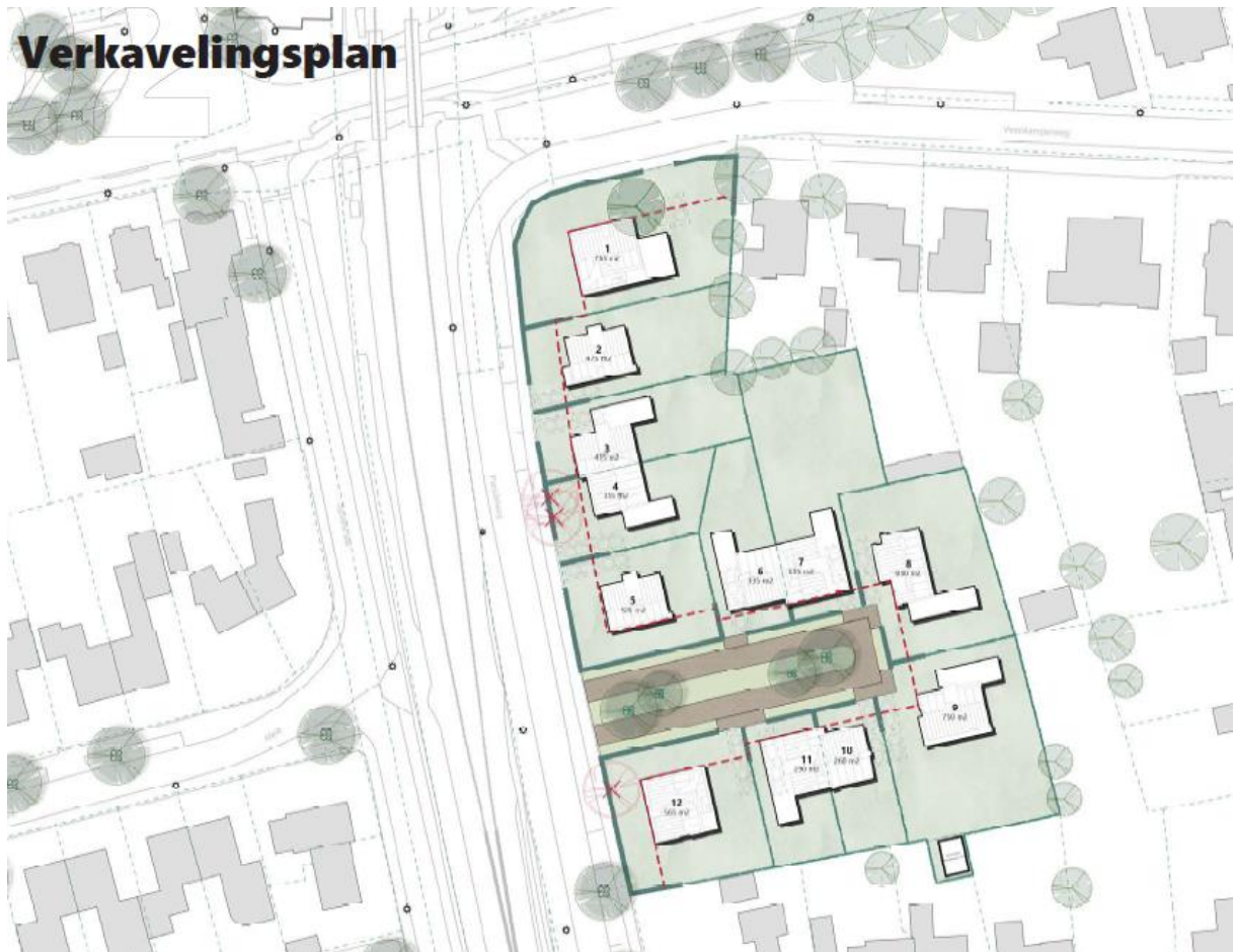
Figuur 3 Verbeelding van een mogelijk eindbeeld.

IAA Architecten is voornemens om het pand aan de Parallelweg in Emmen te slopen en 12 nieuwbouw woningen te plaatsen.