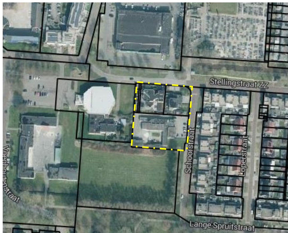
Fig. 1.1: Indicatieve weergave van het plangebied.

Het plangebied is gelegen op de hoek Stellingstraat Zuidzijde en Schoorstraat in Klazienaveen. Het plangebied is gelegen aan de rand van het centrum. Ten noorden zijn een supermarkt en begraafplaats gelegen. Ten westen is een kerkgebouw gelegen en ten zuiden een grasveld. In oostelijke richting zijn woningen van de wijk Molenbuurt gelegen. Het plangebied met de beoogde woonbestemmingen is daarin ruimtelijk en functioneel passend. Op onderstaande luchtfoto is het plangebied bij benadering weergegeven.