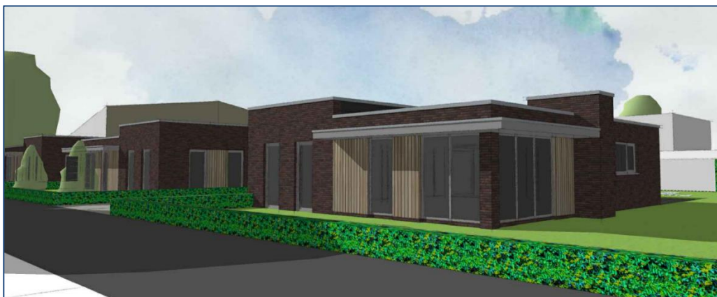
Fig. 1.5: Een 3D-impressie van de nieuwe woningen.