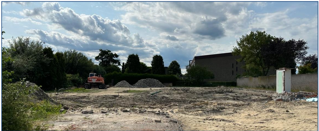
Fig. 4.2: Een weergave van het plangebied waar de voormalige bebouwing is gesloopt (foto d.d. 18 juli 2023).

In het plangebied worden geen sloten gedempt en/of geen bomen gekapt. De bestaande bomen langs de Schoorstraat en langs het grasveld / voetbalveld – die buiten het plangebied zijn gelegen (zie onderstaande verbeelding) - blijven behouden.