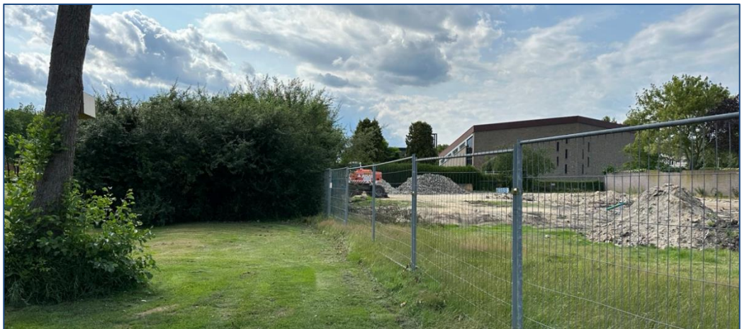
Fig. 4.3: Een weergave van het plangebied (binnen de begrenzing van de hekwerken) waar de voormalige bebouwing is gesloopt (foto d.d. 18 juli 2023).

In het plangebied worden geen sloten gedempt en/of geen bomen gekapt. De bestaande bomen langs de Schoorstraat en langs het grasveld / voetbalveld – die buiten het plangebied zijn gelegen (zie onderstaande verbeelding) - blijven behouden.