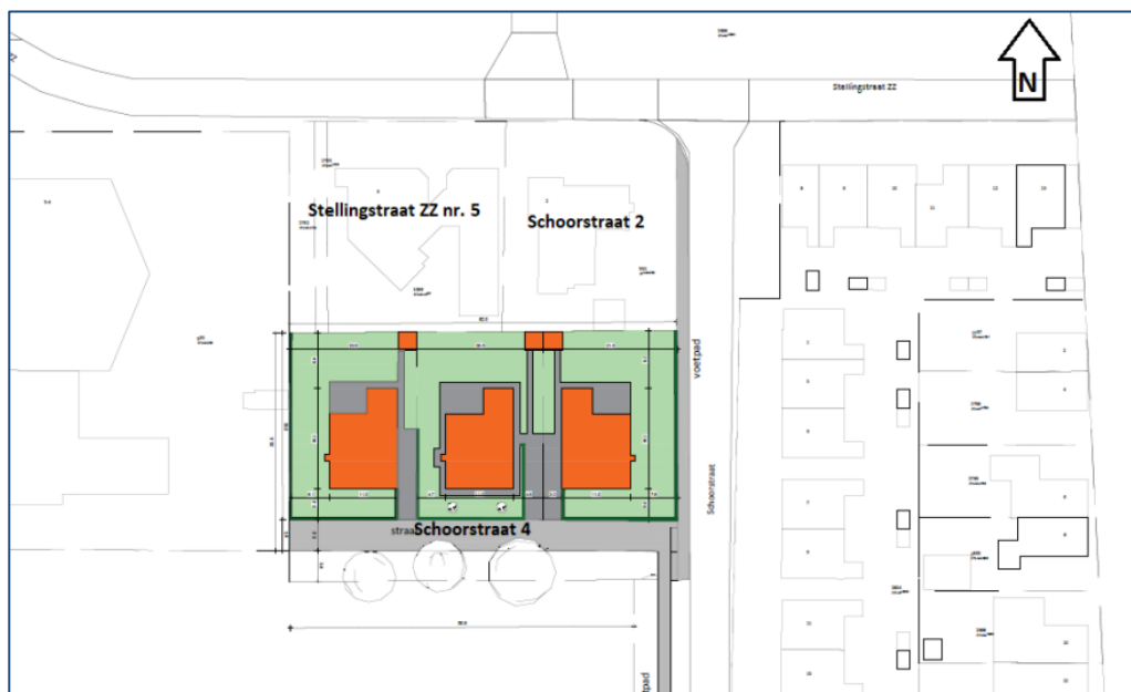
Fig. 1.3: Een indicatieve weergave van de situatietekening van de drie nieuwe woningen.

Tevens voorziet het plan in een nieuwbouwlocatie voor nieuwe woningen. In overeenstemming met de gemeente is gesproken over een invulling van maximaal vier woningen (2x vrijstaand en een 2-onder-1 kapwoning). Uiteindelijk is gekozen voor drie vrijstaande woningen omdat hiervoor in het dorp meer animo bestaat. De nieuwe woningen worden gesitueerd aan doodlopende straat welke worden ontsloten aan de Schoorstraat.