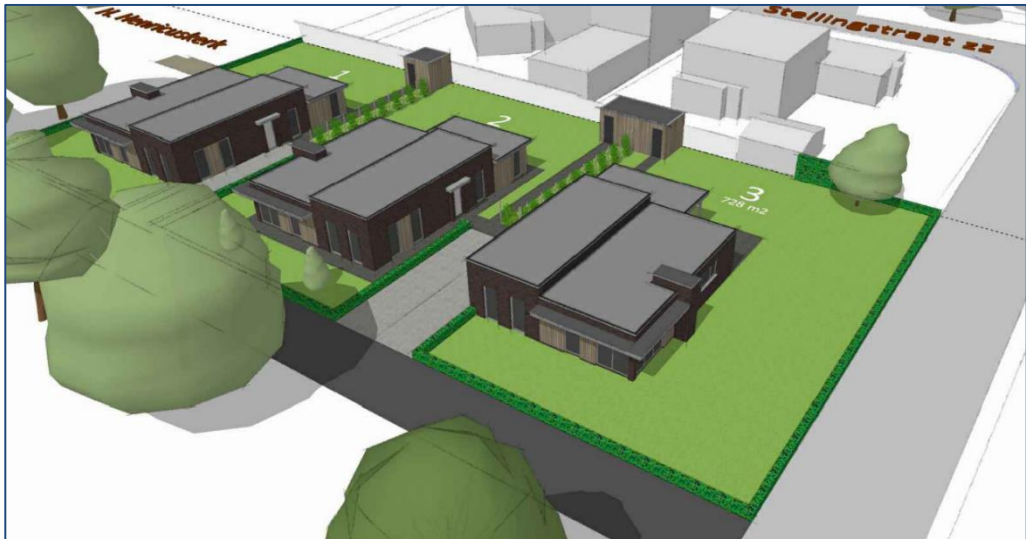
Fig. 1.4: Een 3D-impressie van de nieuwe woningen.

De nieuwe woningen aan Schoorstraat bestaan uit 1 bouwlaag (zonder kap). De hoogte van de platte daken variëren met 3,2 en 3,7 meter. De woningen hebben een eigentijdse uitstraling. Qua materiaal en kleuren is het uitgangspunt om aan te sluiten bij de woningen in de omgeving. Dit betekent als hoofdmateriaal gevels van baksteen, in gedekte, natuurlijke basiskleuren: donker bruin of aarde tinten. De baksteen wordt eventueel gecombineerd met hout (ondergeschikt). De platte kap bestaat uit bitumen of kunststof dakbedekking waarop zonnepanelen kunnen worden geplaatst.