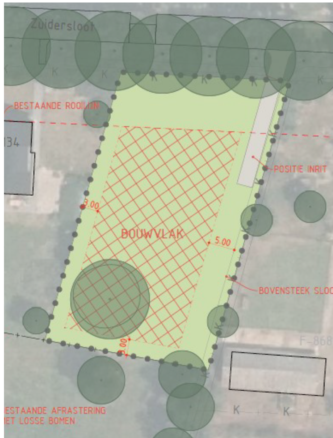
Figuur 3: Voorgenomen bestemmingswijziging

Met de voorgenomen ontwikkelingen wordt de bestemming gewijzigd en een nieuwe woning gerealiseerd. De huidige inrit blijft behouden en de slootranden blijven ongemoeid. Ten behoeve van de nieuwbouw verdwijnt plaatselijk begroeiing, maar dit blijft beperkt tot de kruidlaag. De twee bomen blijven ongemoeid.