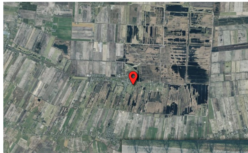
Figuur 1&2. Locatie plangebied (rood) (Pdok, z.d.)

In Figuur 1 en 2 wordt de projectlocatie weergegeven.