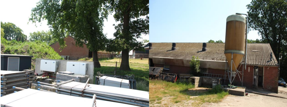
Amfibieën kunnen een (winter)rustplaats bezetten onder spullen/materialen in de buitenruimte.

amfibieënsoorten beschouwd. Amfibieën als bruine kikker en gewone pad benutten het plangebied als foerageergebied en mogelijk bezetten ze er een (winter)rustplaats. Deze soorten kunnen een (winter)rustplaats bezetten onder spullen/materialen in de buitenruimte. De bebouwing is voor amfibieën niet toegankelijk en vormt daardoor geen geschikte (winter)rustplaats. Agrarisch cultuurland vormt geen functioneel leefgebied voor amfibieën. Het plangebied wordt niet als functioneel leefgebied van zeldzame amfibieënsoorten als kamsalamander, rugstreepad of poelkikker beschouwd. Geschikt voortplantingsbiotoop ontbreekt in het plangebied.