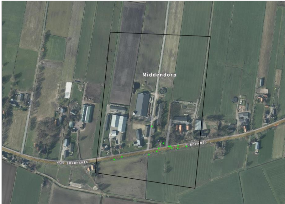
Verspreiding van alle bekende records (groene stippen) in het plangebied.

Op 5 juli 2023 is de NDFF geraadpleegd en is gekeken of waarnemingen van beschermde planten en dieren aanwezig zijn in de databank. In een ruime begrenzing van het zoekgebied rondom het plangebied, zijn 191 verschillende waarnemingen bekend in de NDFF. Voor de verspreiding van de waarnemingen, zie luchtfoto onder.