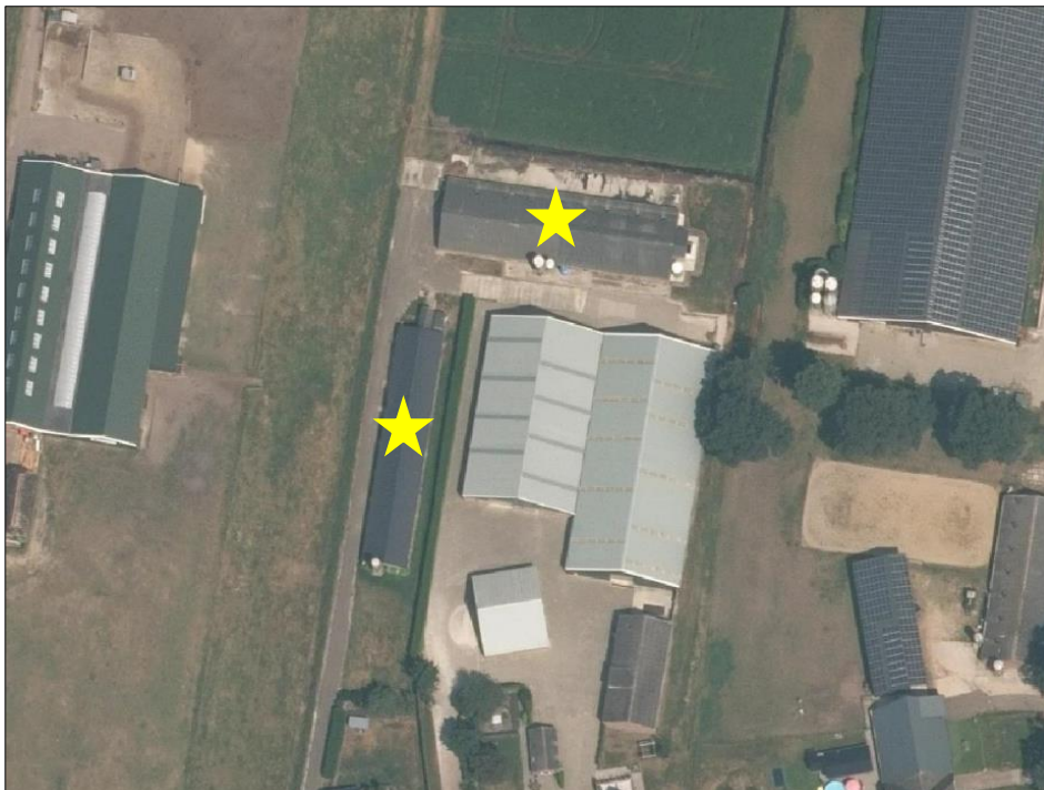
Ligging van het plangebied op de luchtfoto. De beide stallen worden met de gele sterren aangeduid.

Het plangebied bestaat volledig uit bebouwing. De bebouwing bestaat uit twee stallen welke beschikken over gemetselde buitengevels met deels spouwmuur. De buitengevels van de meest zuidelijk gelegen stal zijn deels met damwandplaten betimmerd. Beide stallen zijn gedekt met golfplaten en beschikken over dakisolatie. Het plangebied grenst aan erfverharding en grasland. Op onderstaande afbeelding wordt de begrenzing van het plangebied weergegeven. Voor een verbeelding van de huidige situatie wordt verwezen naar de fotobijlage.