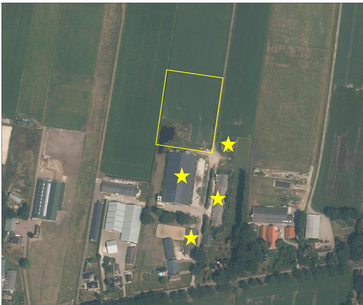
Ligging van het plangebied op de luchtfoto. De 3 stallen en het mestbassin worden met de gele sterren aangeduid en de locatie waar de zonnepanelen geplaatst worden met de gele lijn aangeduid.