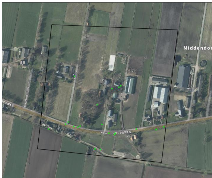
Verspreiding van alle bekende records (groene stippen) in het plangebied.

Op 5 juli 2023 is de NDFF geraadpleegd en is gekeken of waarnemingen van beschermde planten en dieren aanwezig zijn in de databank. In een ruime begrenzing van het zoekgebied rondom het plangebied, zijn 193 verschillende waarnemingen bekend in de NDFF. Voor de verspreiding van de waarnemingen, zie luchtfoto onder.