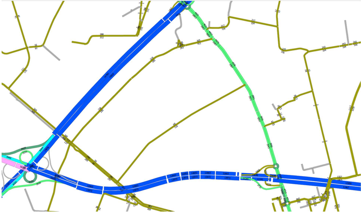
Figuur 1: Plot verkeersintensiteiten 2030 (mv/etm) met distributiecentrum De Tweeling

Op basis van de hiervoor beschreven uitgangspunten is de doorrekening uitgevoerd voor het jaar 2030 en is de situatie met en zonder het distributiecentrum in beeld gebracht. Navolgende visualisaties geven de uitkomsten van de modelberekeningen en het verschil met de situatie zonder distributiecentrum.