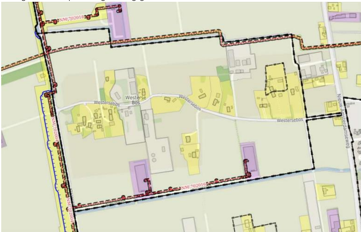
Afbeelding 3.1 Uitsnede EV-signaleringskaart Westerse Bos, 23 januari 2023

In de figuur hieronder is het plangebied Westerse bos met de ligging van de bovengrondse en ondergrondse transportleidingen weergegeven.