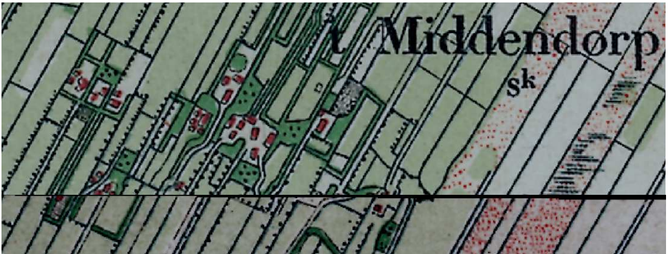
De langgerekte hoevestroken in Middendorp in 1900

Binnen elk buurtschap lagen de boerderijen naast elkaar op langgerekte hoevestroken die het dorpsgebied van noord naar zuid opvulden. Deze hoevestroken, in Schoonebeek 'opgaande' of 'opstrek'nde plaats'n' genoemd, strekten zich noordwaarts op in het hoogveen en naar het zuiden tot het Schoonebekerdiep. Het recht van opstrek bepaalde de richting en de vorm van deze opvallende strokenverkaveling. Dit is een eigendomsrecht dat een grondbezitter heeft op de onontgonnen gronden voor en achter zijn in cultuur gebrachte grond, voor zover ze liggen binnen het verlengde van zijn grensslotten en binnen de grenzen van zijn dorp. In Schoonebeek heeft dit recht de inrichting van het cultuurlandschap bepaald. De 'opgaanden' vormden parallelle stroken van 50-100 breedte. De opstrek van de buurtschap Westeinde liep niet evenwijdig met die van de overige buurtschappen vanwege het onregelmatige verloop van de zandrug en de doorbraak van de Bargerbeek met zijn groenlanden door het zandruggencomplex tussen Westeinde en Kerkeinde.