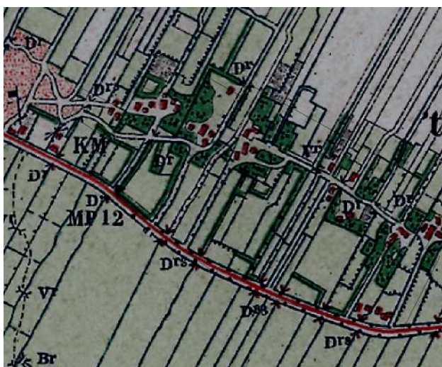
Oosterse Bos in 1904

In 1932 een werkverschaffingsproject startten die het beeld van de drie gehuchten danig zou veranderen. In alle drie de gehuchten werden namelijk de boerderijen verbonden door aanleg van een nieuwe bestraten weg die parallel met de Europaweg liep. Vooral voor Westerse Bos en Middendorp had dit project ruimtelijk gevolgen omdat de wegen een nieuw tracé namen. Voor Oosterse bos kon er grotendeels gebruik worden gemaakt van een bestaand zandpad.