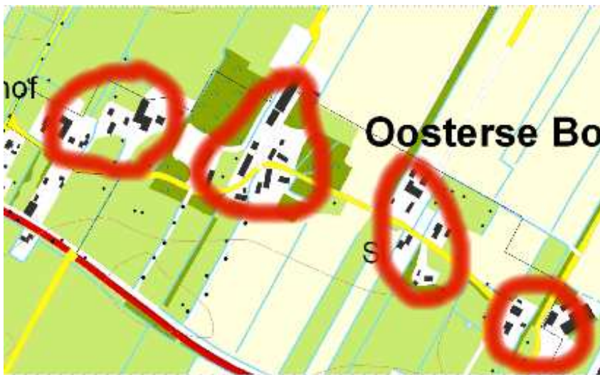
Clusters van boerderijen met daartussen open gebieden en wijdse doorzichten in Oosterse Bos

Qua diversiteit van inrichting van de ruimte valt het gebied uiteen in clusters van boerderijen en daartussen open gebieden met wijdse doorzichten.