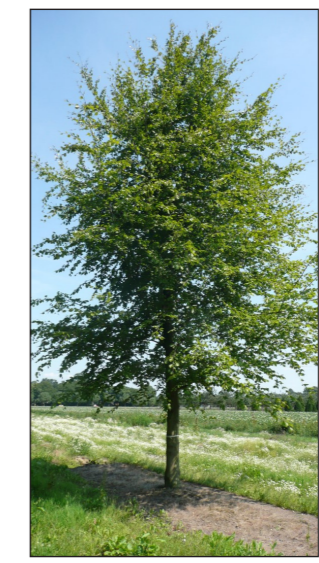
Gewone beuk ( Fagus sylvatica )