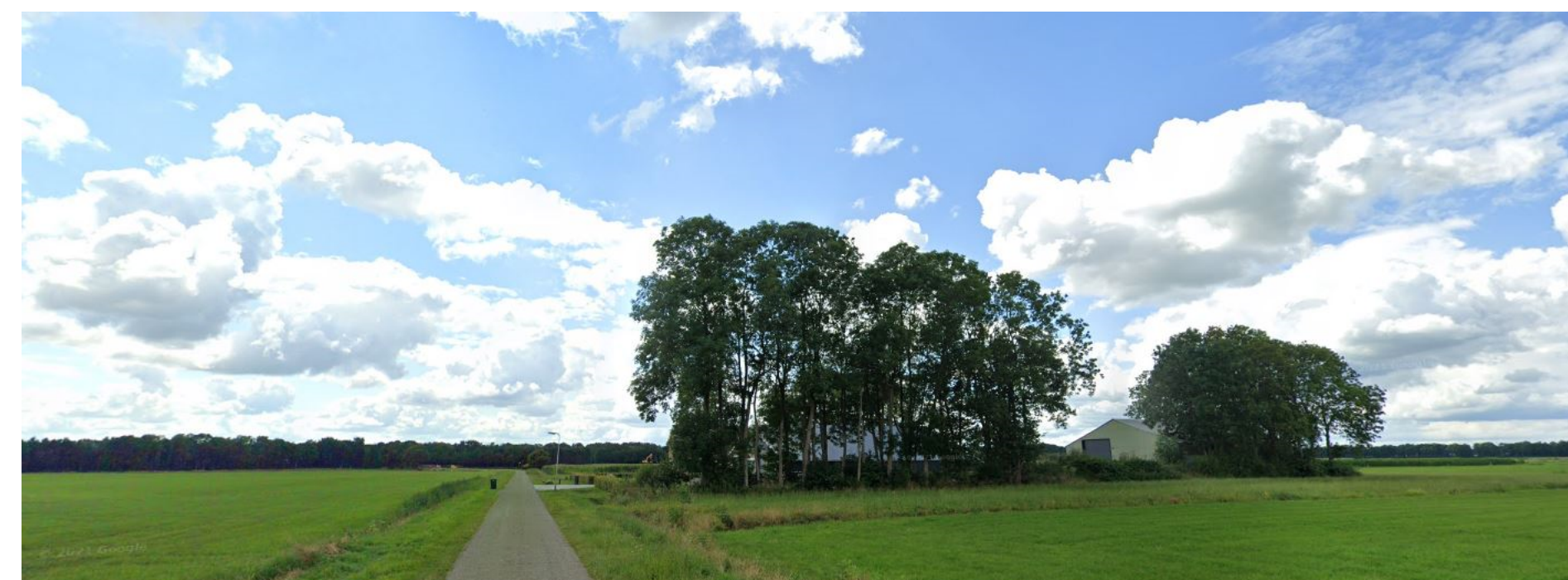
Aanzicht huidige groene erf dat als een soort groen eiland in het openbeekdal ligt