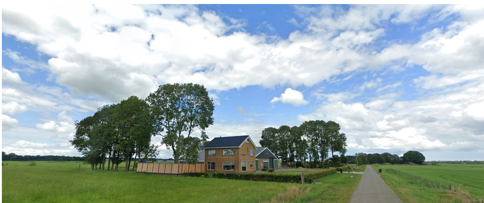
Aanzicht komend vanaf Plopsland

1e jaar onkruid bestrijding ,vrijhouden beplanting dmv maaien of schoffelen. na 1 jaar inboeten in het 3e/4e jaar na aanplant 1e gefaseerde dunning , zgn wijkers en blijvers , het eindresultaat is een dichte singel met enkele uitgegroeide bomen met daaronder een gevarieerde onderbeplanting die gefaseerd word afgezet ( eens in de 6 jaar)