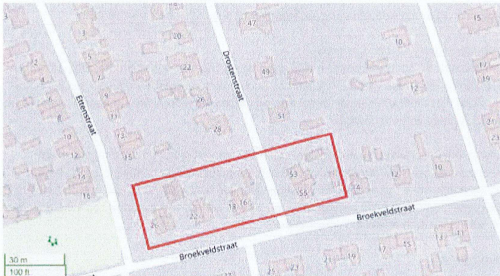
Figuur 1: Globale ligging van het plangebied.

Op 14 september 2021 heeft Stichting Woonservice Drenthe(hierna: ontheffinghouder) een aanvraag gedaan voor een ontheffing van de Wnb. Het project betreft de sloop van 8 woonhuizen aan de Broekveldstraat 16 t/m 26 en de Drostestraat 53 en 55 te Sleen en deze te vervangen door nieuwe woonhuizen (zie figuur 1). De ontheffinghouder heeft een ontheffing aangevraagd voor de verbodsbepalingen genoemd in artikel 3.1, lid 2 en 3.5, lid 2 en lid 4 van de Wnb voor de volgende soorten: huismus, gierzwaluw en gewone dwergvleermuis.