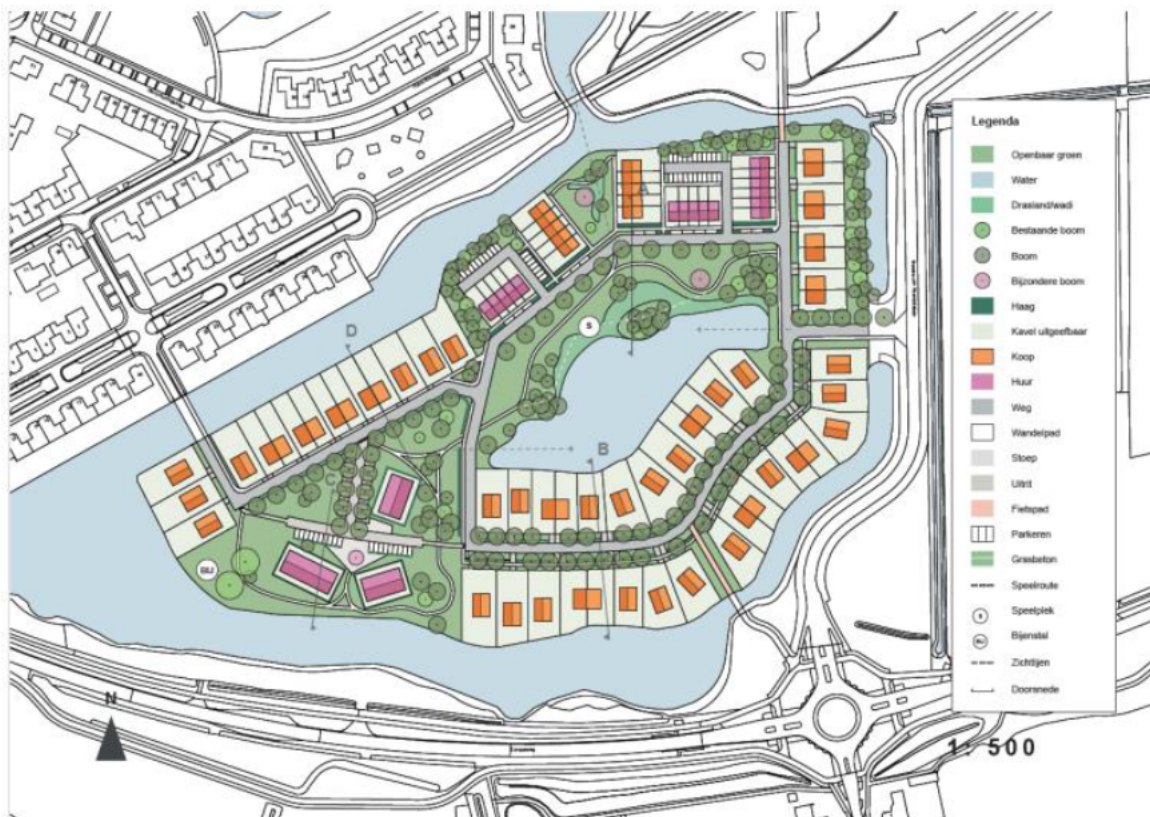
Figuur 2.2. Toekomstige situatie plangebied