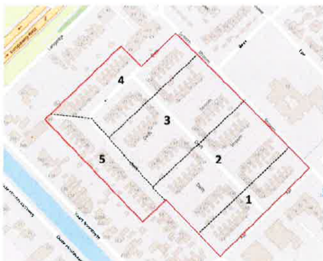
Figuur 2: de vijf deelgebieden waar (aanvullend) ecologisch onderzoek is verricht naar huismussen en vleermuizen.

Het aanvullend onderzoek voor vleermuizen is conform Vleermuisprotocol 2017 uitgevoerd, waarbij het hele onderzoeksgebied is opgedeeld in vijf deelgebieden. In de zomer- en kraamtijd van de vleermuizen zijn er per deelgebied drie veldbezoeken afgelegd, en twee veldbezoeken voor paar- en winterverblijfplaatsen per deelgebied. De veldbezoeken zijn zoveel als mogelijk gelijktijdig uitgevoerd zoals aangegeven in het Activiteitenplan complex 1038 Assen, d.d. 25 april 2022, van AKTB Buro Bakker.