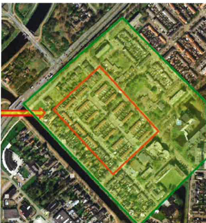
Figuur 1: kaart van het plangebied met rood omlijnd de te slopen woningen van Actium

Op 22 april 2022 hebben wij een aanvraag ontvangen voor een ontheffing van de Wnb van AKTB Buro Bakker namens Actium (hierna ontheffinghouder). Op d.d. 15 augustus 2022 heeft de ontheffinghouder ons, naar aanleiding van de door ons gestelde vragen, aanvullende informatie toegestuurd per mail. Het project betreft de sloop en nieuwbouw van rijtjeswoningen aan de Aar 2 t/m 24 (even), Stroom 4 t/m 50 (even) en Delft 4 t/m 62 (even) en Delft 1 t/m 71 (oneven) in Assen (gemeente Assen). De ontheffinghouder heeft een ontheffing aangevraagd voor de verbodsbepalingen genoemd in artikel 3.1, lid 2 en 4 en artikel 3.5, lid 2 en lid 4, van de Wnb voor de volgende soorten: huismus ( Passer domesticus ) en gewone dwergvleermuis ( Pipistrellus pipistrellus ). De spreeuw ( Sturnus vulgaris ) wordt ook als soort meegenomen in compensatie en mitigatie in het plangebied (ecologische plus).