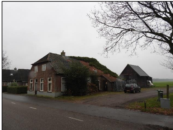
Afbeelding 2.2. Overzicht plangebied.