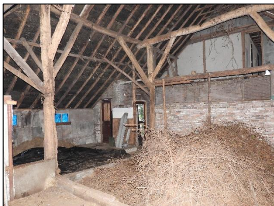
Afbeelding 2.10. Schuur achterzijde woning.