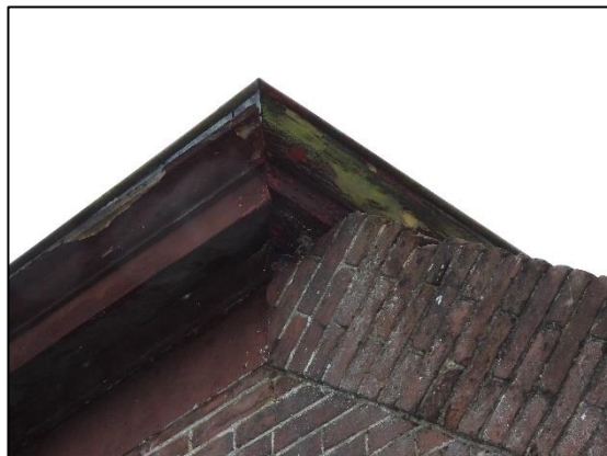
Afbeelding 2.9. Gat in lijstgevel aan voorkant woning.