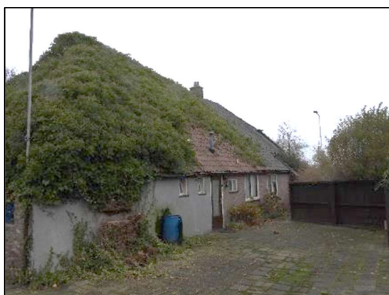
Afbeelding 1.3. Oostzijde woning.