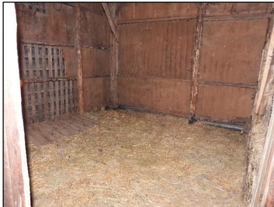
Afbeelding 2.20. Box met stro in vrijstaande schuur.