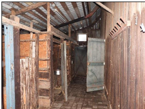
Afbeelding 2.18. Binnenkant vrijstaande schuur.