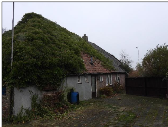
Afbeelding 2.4. Oostzijde woning.