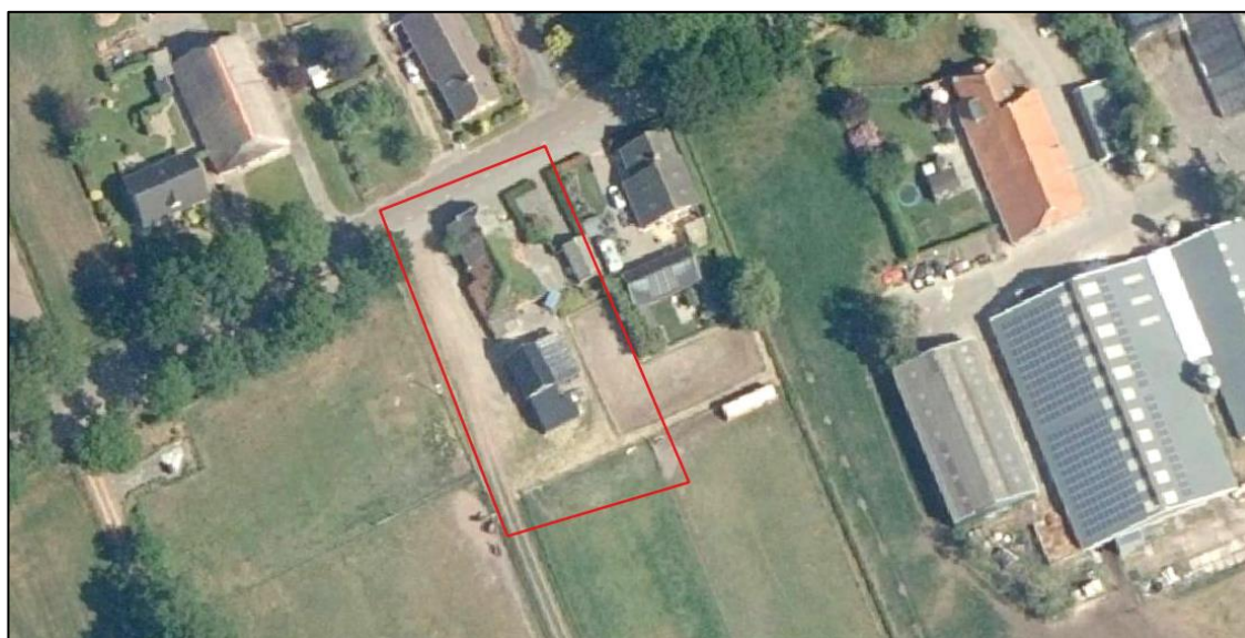
Afbeelding 2.1. Begrenzing van het plangebied (rood kader).