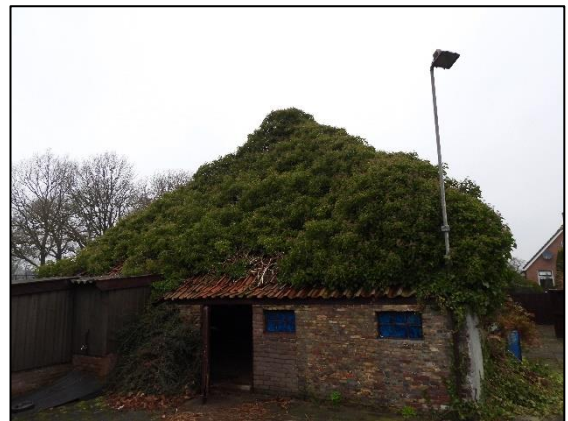
Afbeelding 2.5. Achterzijde woning.