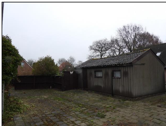
Afbeelding 2.6. Garage.