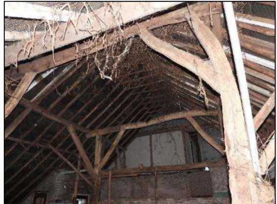
Afbeelding 1.8. Dak van schuur aan woning.