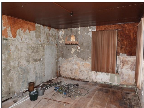
Afbeelding 2.16. Kamer begane grond.