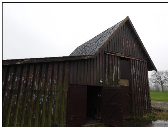
Afbeelding 2.17. Vrijstaande schuur.