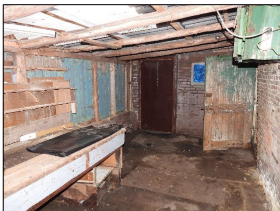
Afbeelding 2.12. Kamer in schuur aan woning.