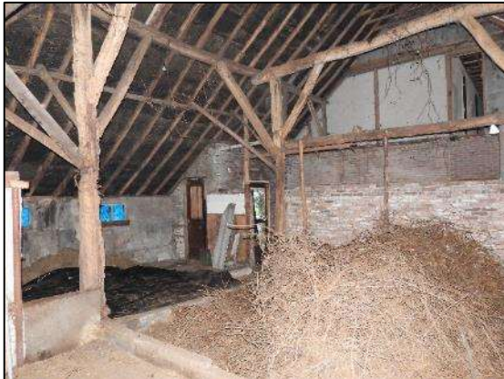
Afbeelding 1.7. Schuur achterzijde woning.