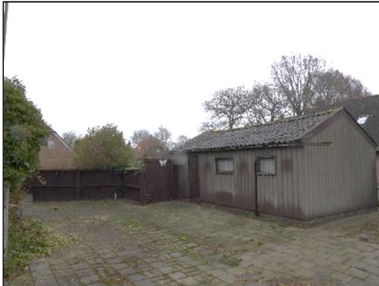
Afbeelding 1.5. Garage.