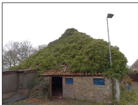
Afbeelding 1.4. Achterzijde woning.