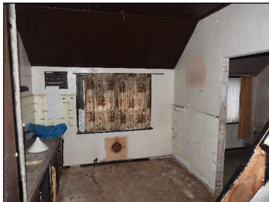
Afbeelding 2.15 Kamer begane grond.