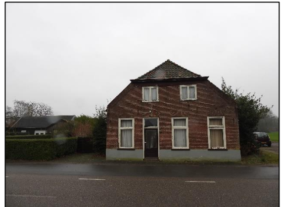
Afbeelding 2.3. Voorkant woning.