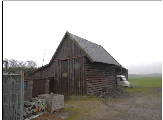
Afbeelding 1.6. Vrijstaande schuur.