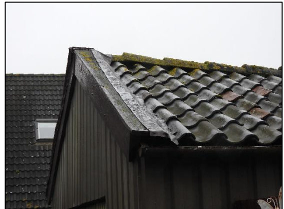
Afbeelding 2.21. Dak van garage.