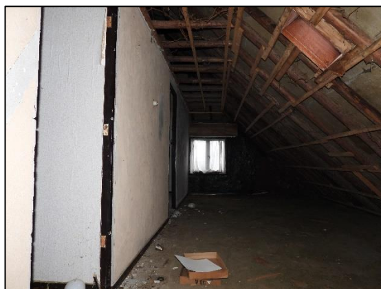
Afbeelding 2.13. Zolder in woning.