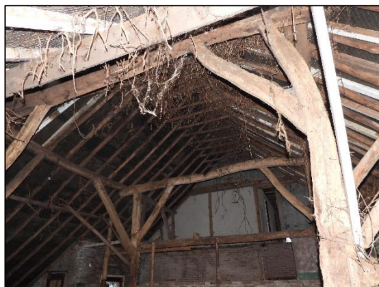
Afbeelding 2.11. Dak van schuur aan woning met houten balken.