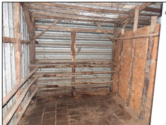
Afbeelding 2.19. Box in vrijstaande schuur.