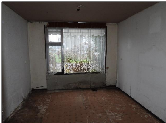
Afbeelding 2.14. Kamer begane grond.