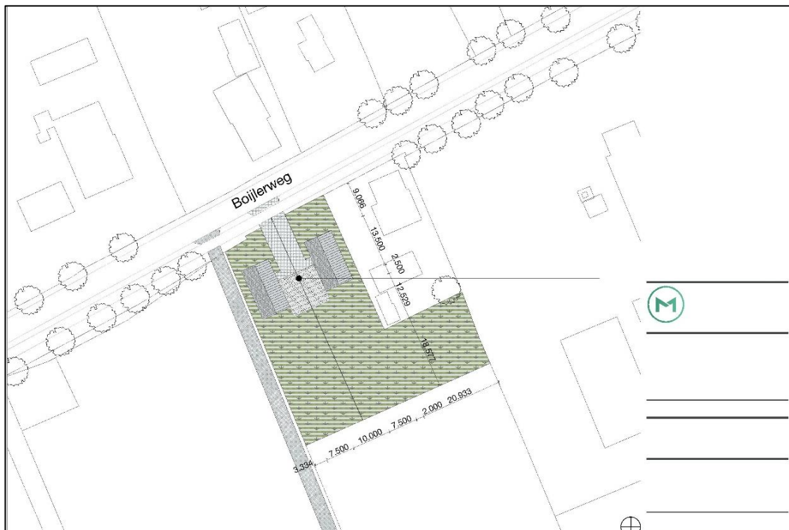
Afbeelding 2.22. Tekening gewijzigde situatie Boijlerweg 36 in Boijl (Bron: M Architecten- & Ingenieursbureau).