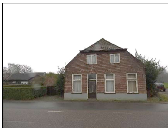
Afbeelding 1.2. Voorkant woning.