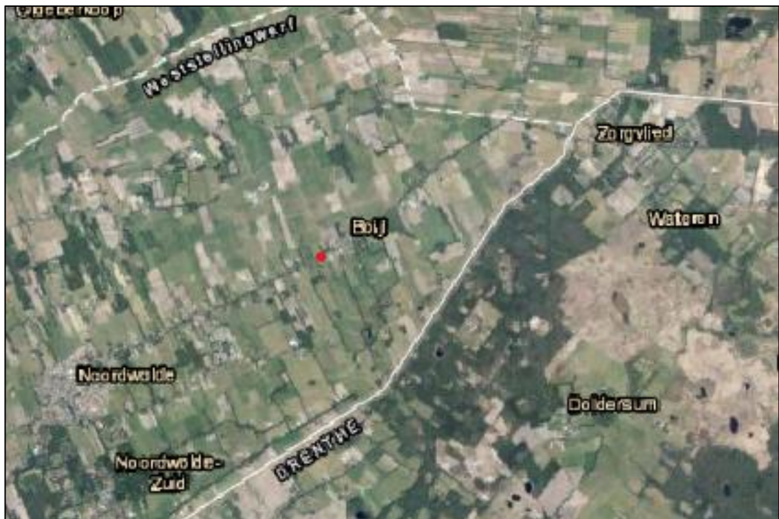
Afbeelding 1.1. Globale ligging van het plangebied (rode stip).

Het plangebied is gelegen in Boijl, ten zuidoosten van Heerenveen en ten zuidwesten van Assen. Ten oosten van Boijl bevindt zich het Nationaal Park Drents-Friese Wold. De brede omgeving van het plangebied bestaat uit woonhuizen, bomen en agrarisch gebied. De globale ligging van het plangebied is weergegeven in afbeelding 1.1.