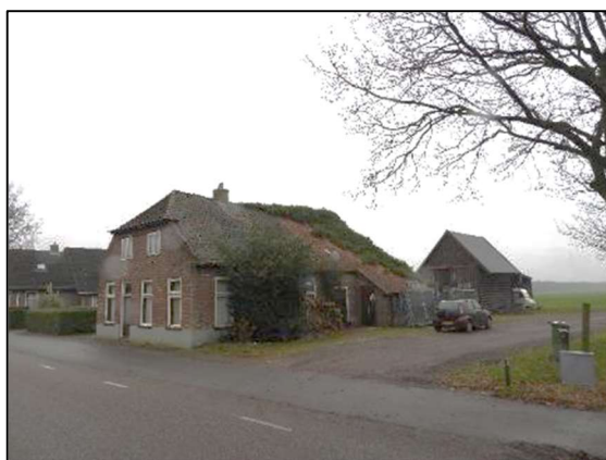
Afbeelding 1.1. Overzicht plangebied.

Een indruk van het plangebied: