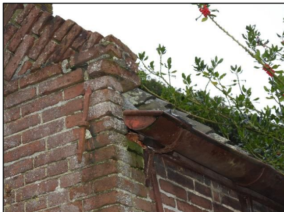
Afbeelding 2.8. Dakgoot aan woning.