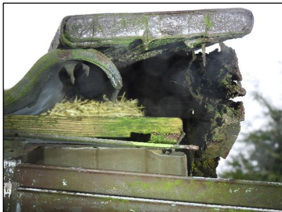
Afbeelding 2.22. Mogelijk nestmateriaal onder dakpannen.