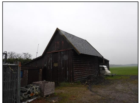
Afbeelding 2.7. Vrijstaande schuur.