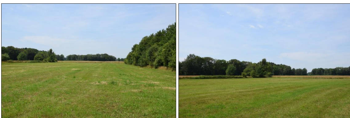
Foto's 1 en 2. Impressie van de plangebieden op 30 juni 2022. Het zicht op de zuidzijde van plangebied 1, gezien vanuit het zuiden.