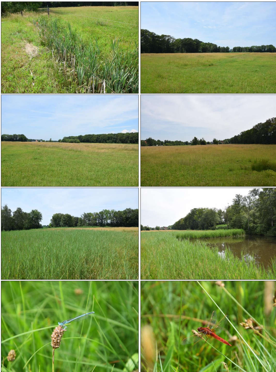
Foto's 3- 10. Impressie van plangebied 1. Met enkele libellensoorten, zoals vuurlibel en blauwe breedscheenjuffer.