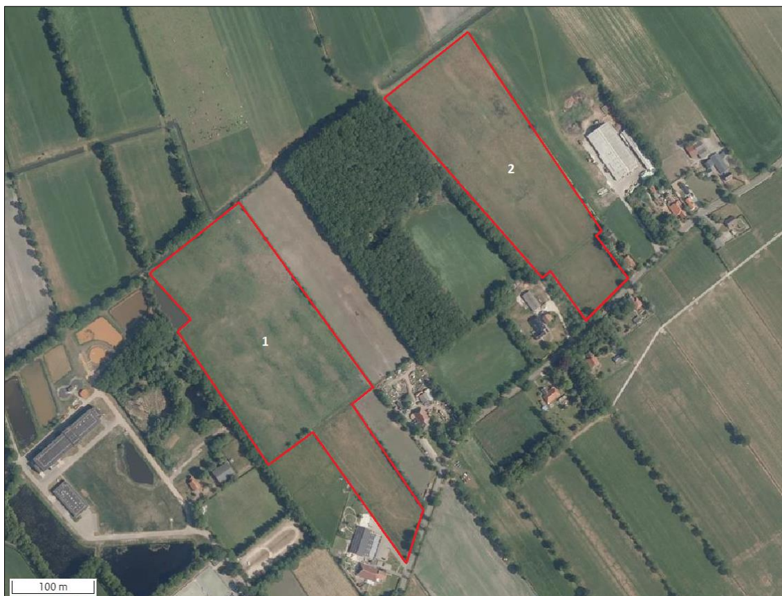
Figuur 1. Locatie van de plangebieden (rood). Bron kaartondergrond: www.satellietdataportaal.nl .