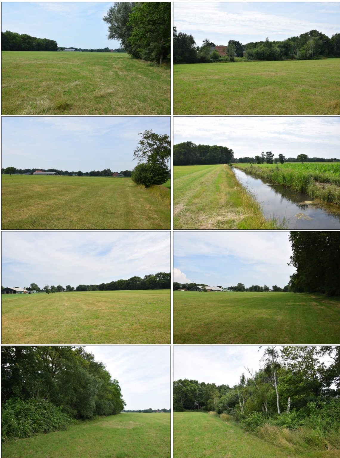
Foto's 10 -18. Impressie van plangebied 2.