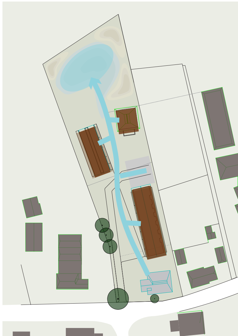
Het waterinzijgebied met nollen en natuurontwikkeling