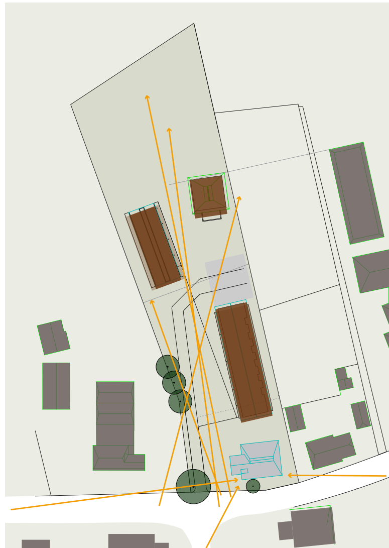
de zichtlijnen over de locatie