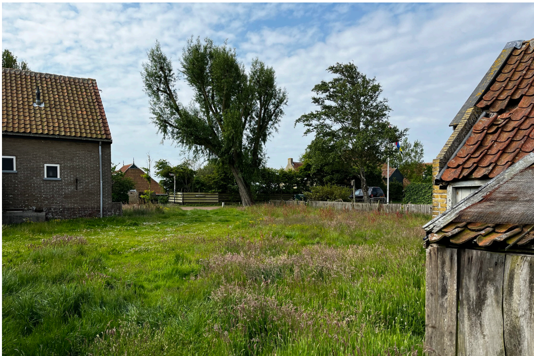
het doorzicht van het achterterrein naar de voorzijde