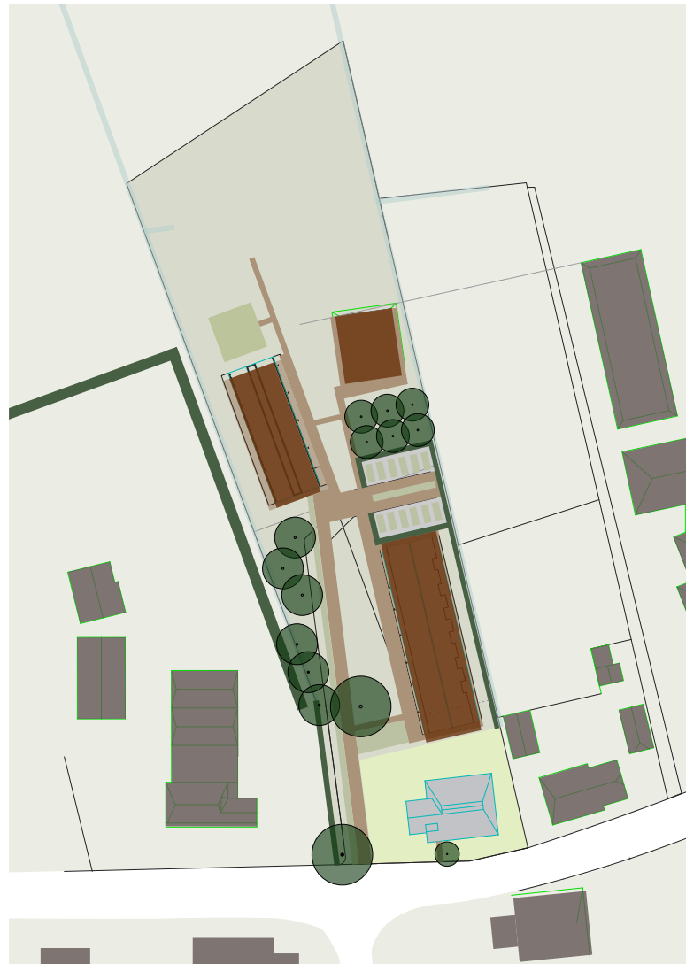
groentetuin boomgaard en losse bomen