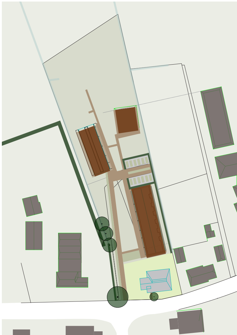
voetpaden parkeren en route