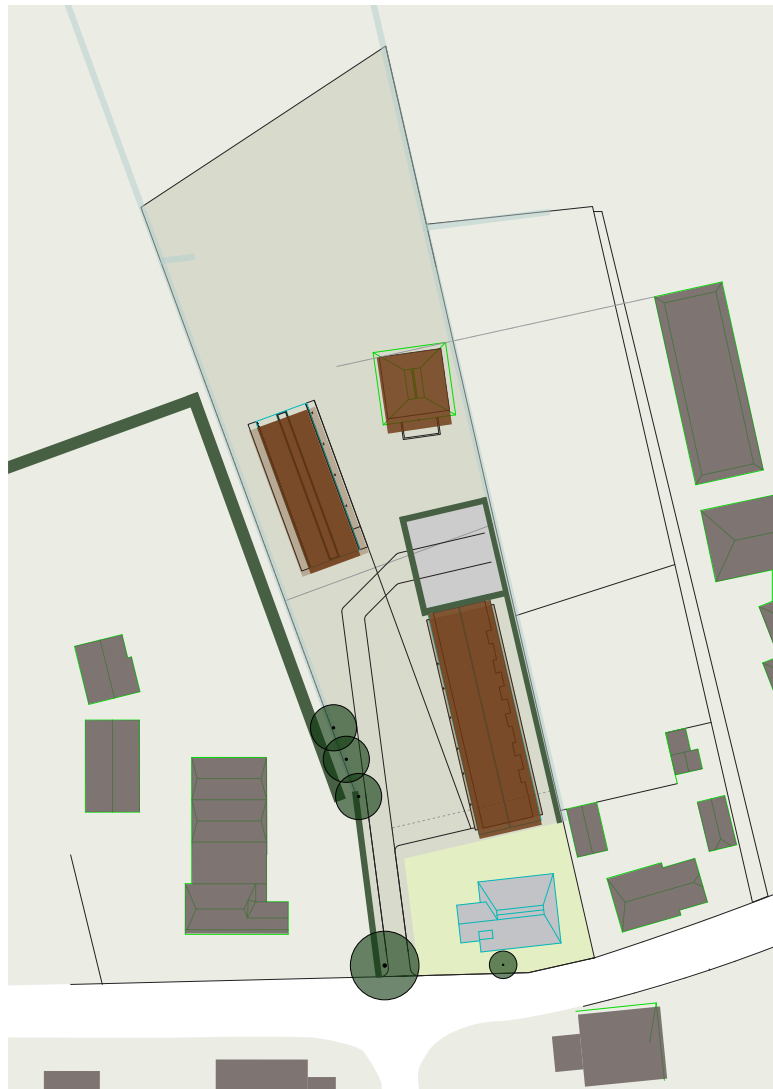
de hagen (1,20 m hoog) deels als rand van het erf en bestaande elzensingel