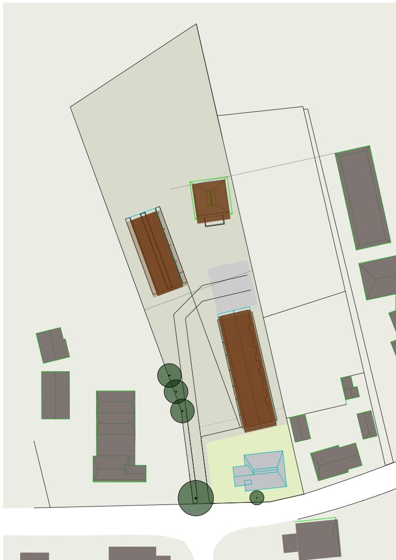
de tuin van de bestaande boerderij