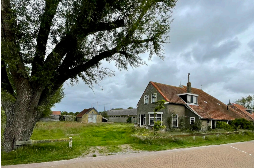
de Lieszijde met de bestaande wilg