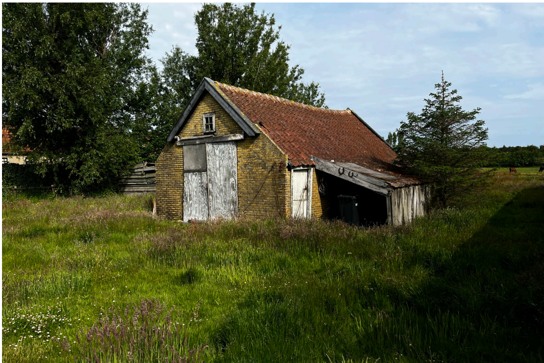
de bestaande wilgen aan de westzijde