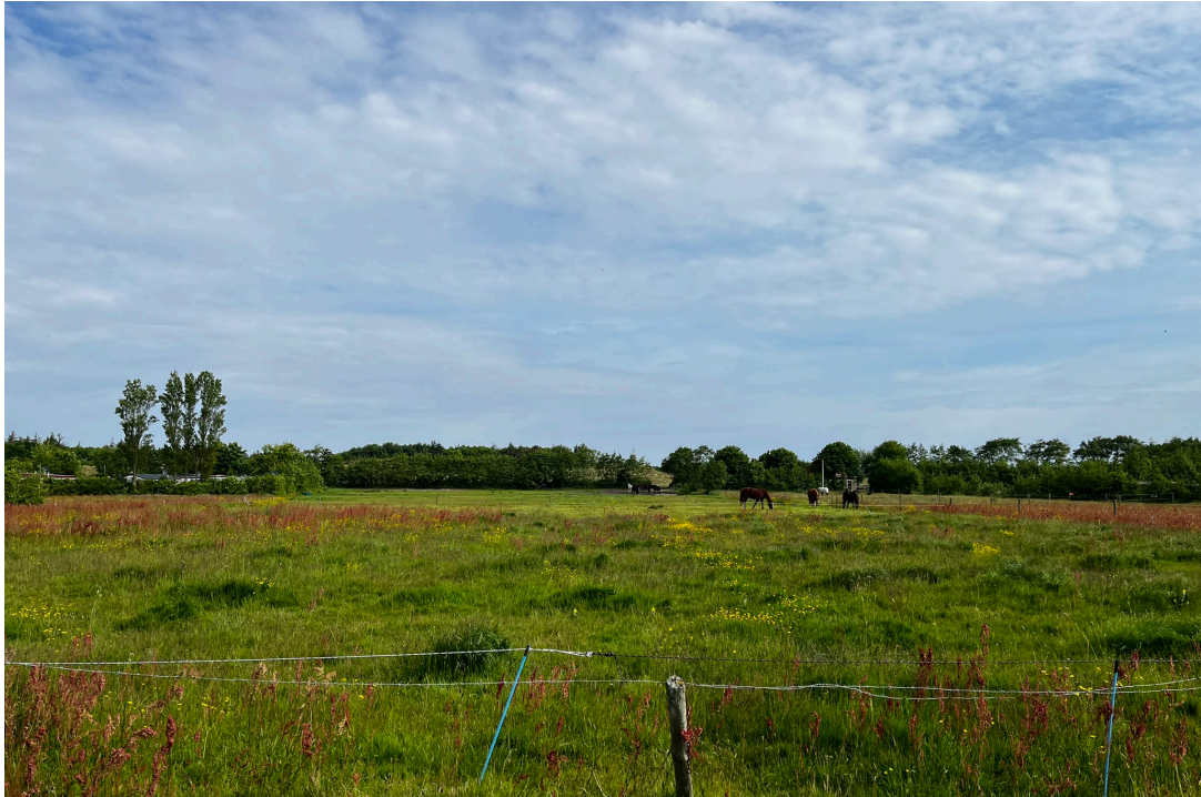
de weide achter de boerderij