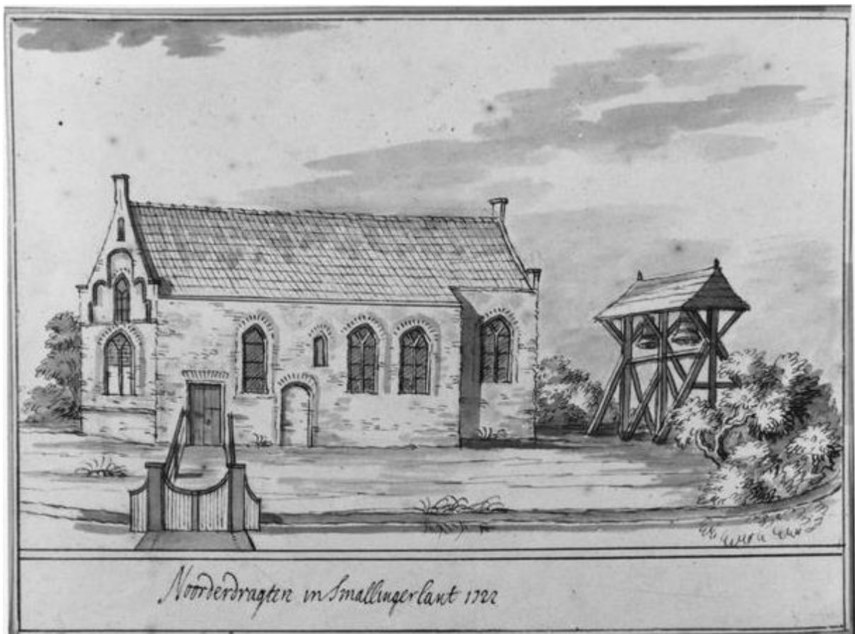
Afbeelding 3. Tekening van de "Noorderdragter" kerk door J. Stellingwerf uit 1722.