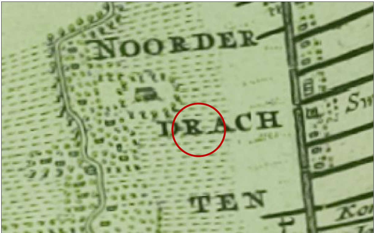
Afbeelding 2. De locatie van plangebied (rode cirkel, bij benadering) op een uitsnede van de kaart van Schotanus.

1848 is het kerkhof zichtbaar (afb. 5). 5 Ook lijkt een van de ontginningsloten direct ten noorden van het plangebied te zijn verbreed.