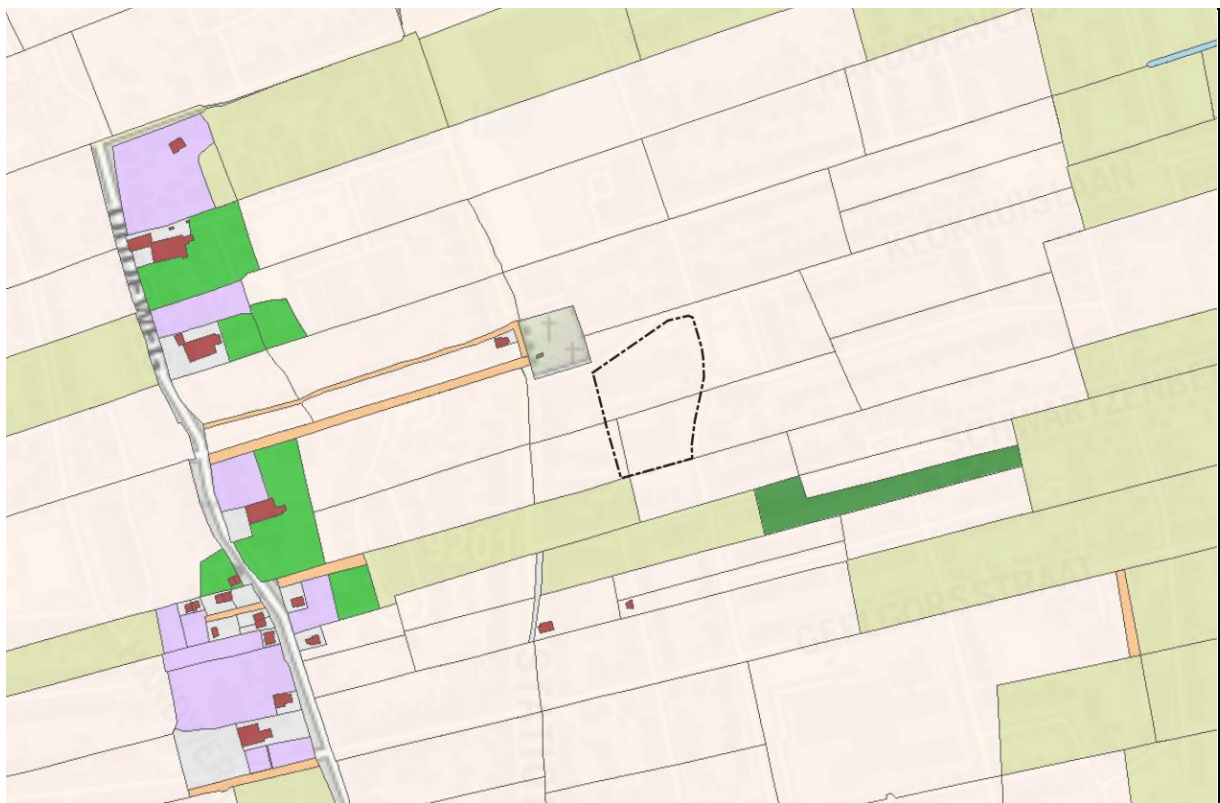
Afbeelding 4. De locatie van plangebied (zwarte stippelijn, bij benadering) op een uitsnede van de kadastrale minuutkaart uit 1828 (collectie RCE).