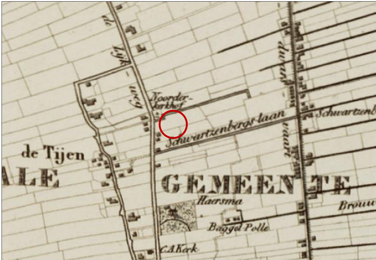
Afbeelding 5. De locatie van plangebied (rode cirkel, bij benadering) op een uitsnede van de kaart van Eekhoff.

In de 20 ste eeuw raakt zowel de noordelijke als de zuidelijke helft van het plangebied bebouwd. In de noordelijke helft wordt het hoofdgebouw rond 1970 gerealiseerd. Rond 1980 en 2010 wordt de bebouwing uitgebreid. Ook de zuidelijke helft van het plangebied raakt rond 1970 bebouwd. Deze bebouwing wordt rond 1993 en 2014 wordt de bebouwing uitgebreid.