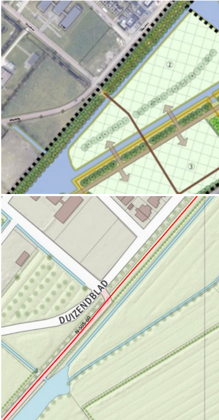
Afbeelding 1: Ontwikkelingen binnen de belemmeringsstrook