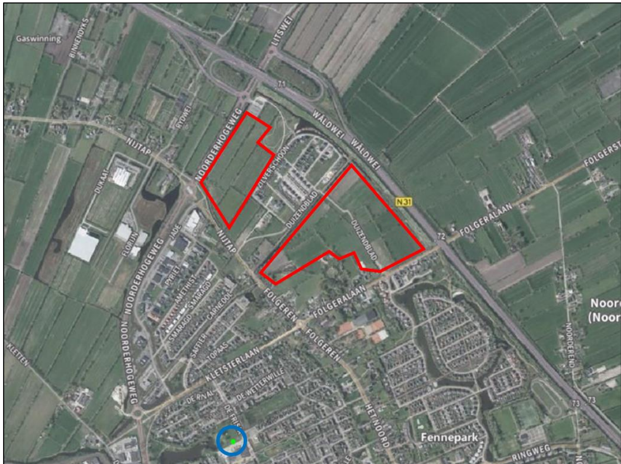
Figuur 2.4. Waarneming van de soort watervleermuis (blauw) op relatief grote afstand van de plangebieden (rood) (bron: NDFF).

Echter, een gedeelte van het zuidoostelijke plangebied was niet geheel toegankelijk, en de bomen binnen dit plangebied waren op afstand niet voldoende zichtbaar om de aanwezigheid van geschikte boomholten vast te stellen, dan wel uit te sluiten. In de ruime omgeving is tevens een waarneming bekend van een boombewonende vleermuissoort (figuur 2.4)(bron: NDFF). Dit betreft de watervleermuis. Daarnaast kunnen gewone dwergvleermuis, ruige dwergvleermuis, gewone grootoorvleermuis en rosse vleermuis gebruik maken van boomholten.