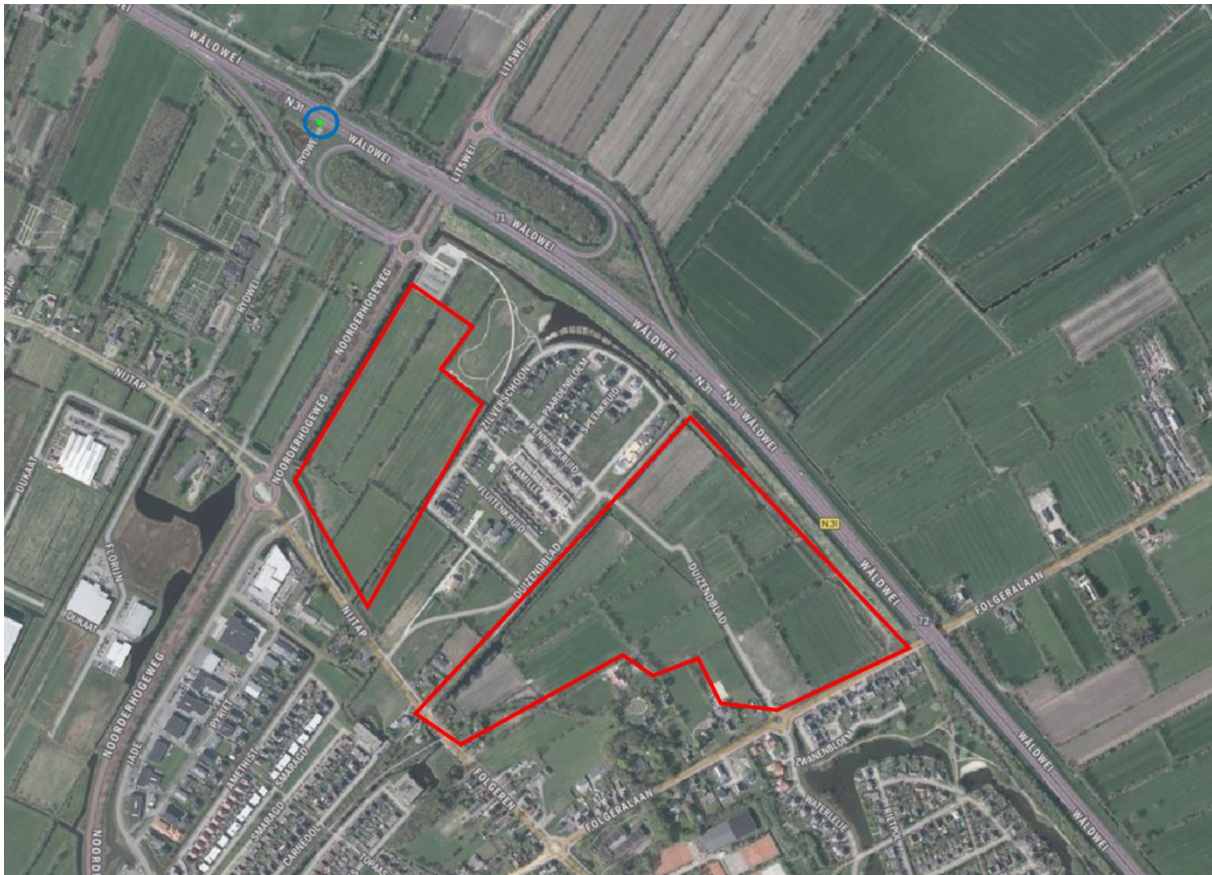
Figuur 2.6. Waarneming van de soort boommarter (blauw) in de omgeving van de plangebieden (rood).

Binnen de plangebieden kunnen tevens lichter beschermde (vrijgestelde) zoogdiersoorten voorkomen, zoals de veldmuis. Hoewel deze soorten voor ruimtelijke ingrepen zijn vrijgesteld binnen de provincie Fryslân, dient men zich wel te houden aan de voor deze soorten geldende zorgplicht.