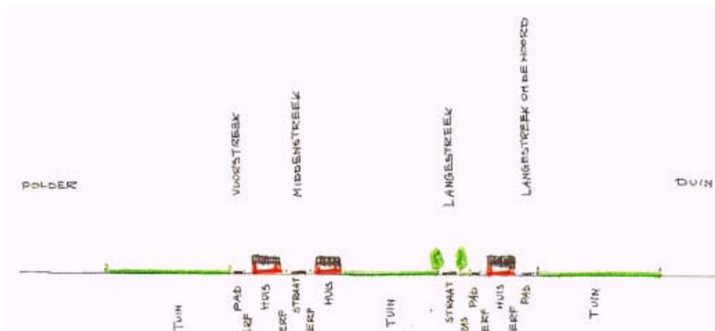
Afbeelding 8 Dwarsprofiel van het dorp