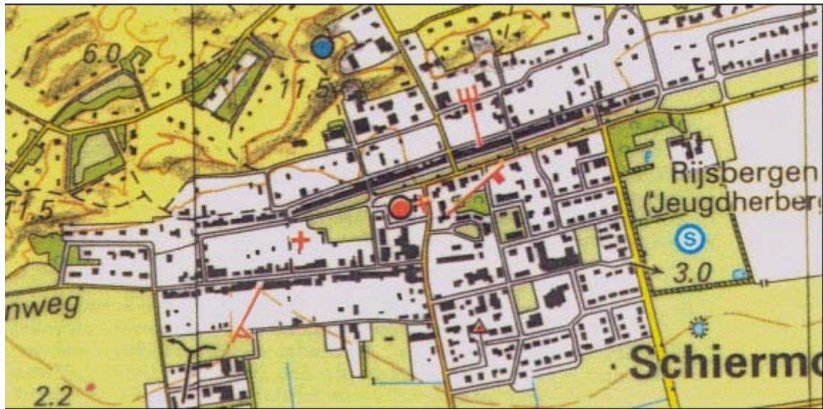
Afbeelding 5 Situatie 2002