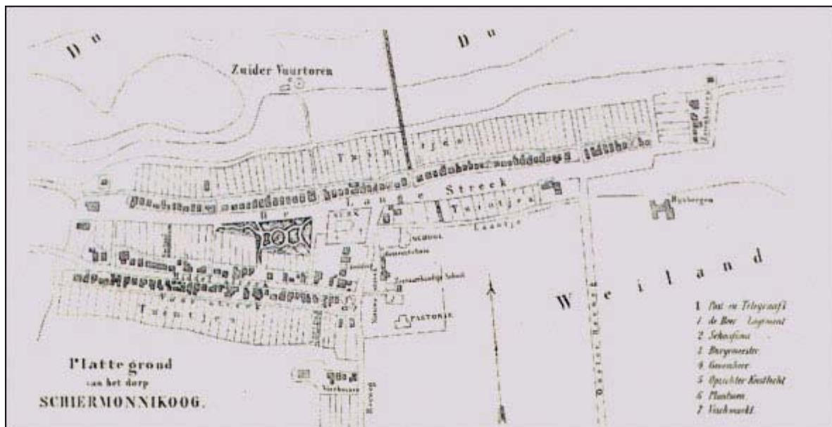
Afbeelding 2 Situatie 1885