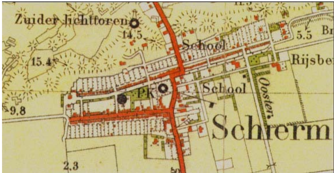
Afbeelding 3 Situatie 1927