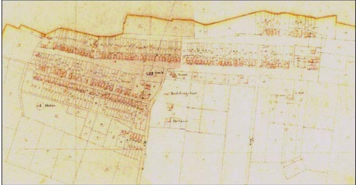
Afbeelding 1 Situatie 1830

van de Voorstreek en Middenstreek - zuidzijde waar een deel van de bebouwing bestaat uit twee ruggelings tegen elkaar geplaatste woningen met topgevel bestaat.