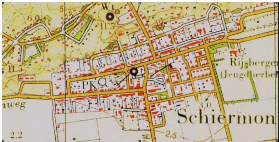
Afbeelding 4 Situatie 1969