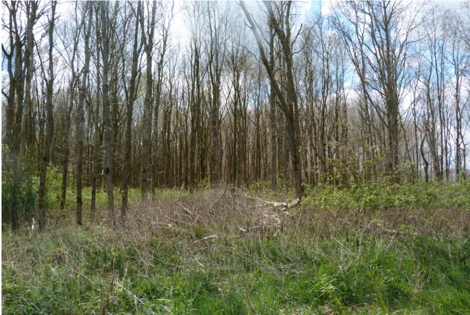
Figuur 4: Jonge eikenopstand. Dit perceel zal deels worden gekapt voor de bouw van het productiegebouw.

Een drietal bosvakken (19b, 19l en 19i, zie bijlage 1 voor de vakindeling) is enkele jaren terug gekapt vanwege essentaksterfte. De vegetatie hier bestaat uit een afwisseling van ruigtesoorten zoals hoog opgaand braamstruweel, pitrus en algemene grassen afgewisseld met struweelsoorten als Amerikaanse vogelpest en vlier.