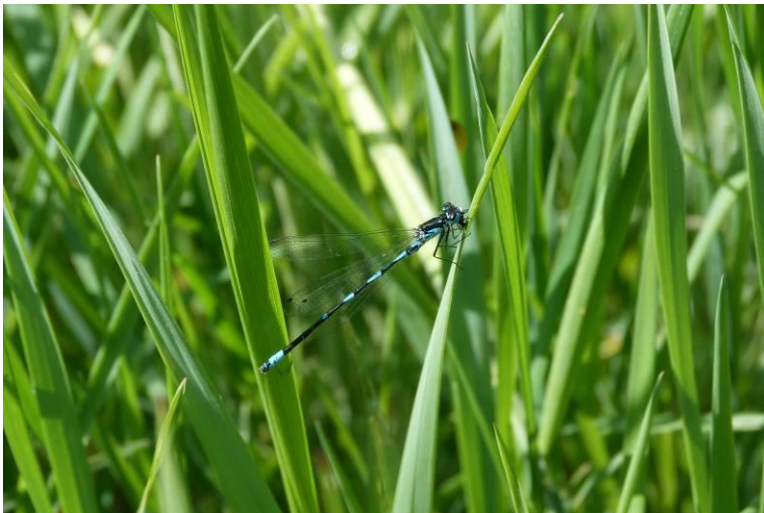
Figuur 41: Variabele waterjuffer Coenagrion pulchellum (man).