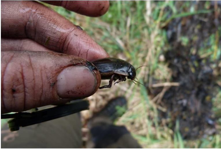
Figuur 43: Veengeelgerande waterkever Dytiscus dimidiatus.