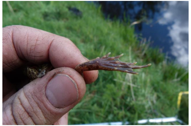
Figuur 17 en 18: Bruine kikker Rana temporaria, Exemplaar 2