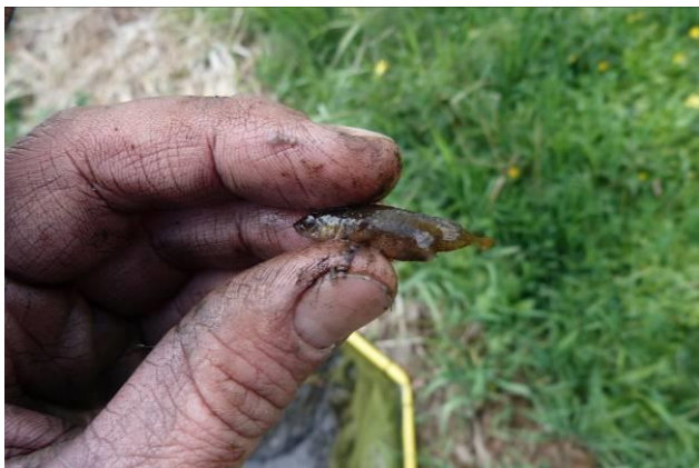
Figuur 36: Tiendoornige stekelbaars Pungitius pungitius.

Tijdens de bemonstering werden een aantal vissoorten aangetroffen die niet beschermd zijn onder de Wet natuurbescherming. In de om te leggen watergang werden meerdere tiendoornige stekelbaarzen Pungitius pungitius aangetroffen (figuur 33).