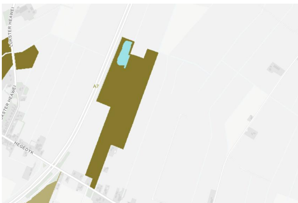
Figuur 44: Uitsnede uit de natuurbeheertypekaart van de provincie Friesland. Donkerbruin: N16.04 Vochtig bos met productie; Lichtbruin: N16.03 Droog bos met productie. Blauw: N04.02 zoete plas.

Het plangebied is op de Natuurbeheerplankaart van de provincie Friesland (versie 2021) aangegeven als N16.04 Vochtig bos met productie. De waterplas aan de noordwestzijde is aangeduid als N04.02 Zoete plas. Deze beide natuurdoelen zijn tevens als ambitie voor de lange termijn aangegeven. Omdat de waterplas niet beïnvloed wordt door de werkzaamheden, richt de verdere uitwerking zich uitsluitend op het bos.