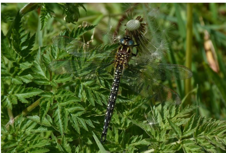
Figuur 42: Glassnijder Brachytron pratense (man).