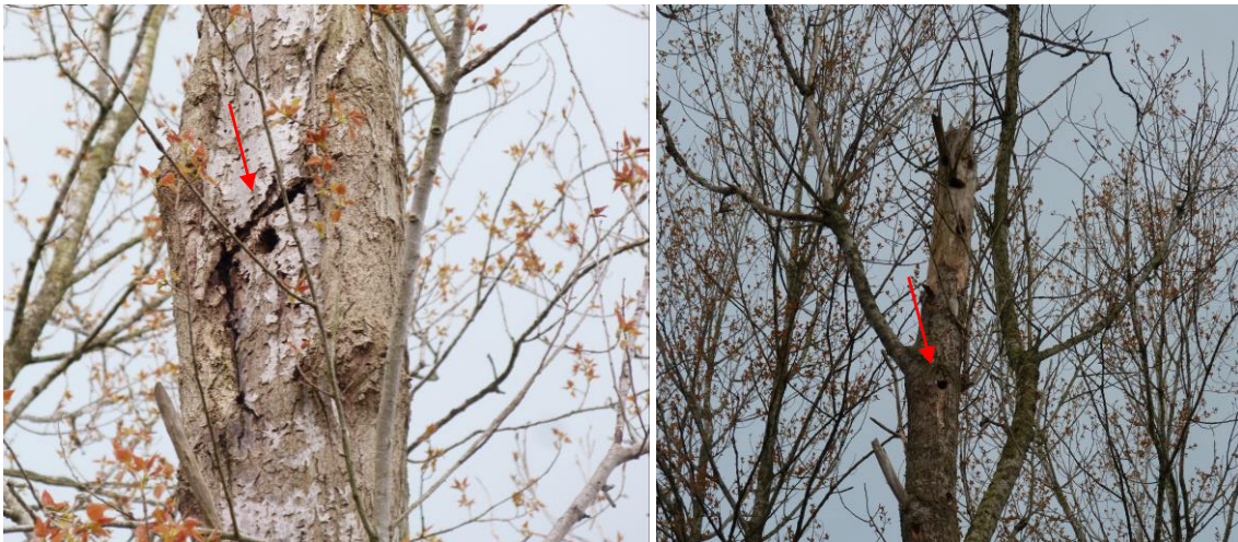
Figuur 8 & 9: Enkele holtes in de populieren.

Het veldbezoek leverde een breed palet aan soorten op. In de bospercelen werden veel algemene soorten aangetroffen als koolmees Parus major , vink Fringilla coelebs , winterkoning Troglodytes troglodytes , merel Turdus merula , houtduif Columba palumbus , boomkruiper Certhia brachydactyla , gaai Garrulus glandarius en zanglijster Turdus philomelos . Ook werden verschillende nestplaatsen van in hollen broedende soorten aangetroffen: de grote bonte specht Dendrocopos major en spreeuw Sturnus vulgaris . De nestplaatsen van de holenbroeders werden voornamelijk aangetroffen bij het bosperceel met populier sp. In een groot aantal bomen werden geschikte holtes aangetroffen die in gebruik waren dan wel potentie hebben om als nestplaats te dienen.