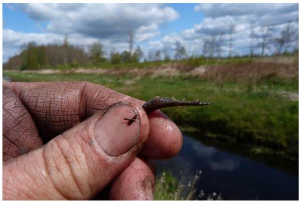
Figuur 23 en 24: Bastaardkikker Pelophylax kl. Esculentus, Exemplaar 2