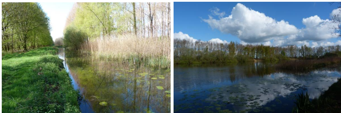
Figuur 13 en 14: Foerageergebied in het noorden van het gebied.

Een negatief effect als gevolg van de inrichting op de functies foerageergebied en vliegroure is zeer beperkt. Een deel van het bos verdwijnt, waaronder het populierenbos waarin de vleermuizen foerageren. Het gebied blijft na de voorgenomen inrichting nog zeer geschikt als foerageergebied en vliegroures blijven gehandhaafd. Daarnaast wordt nieuw foerageerbiotoop toegevoegd in de vorm van een slibvijver. Negatieve effecten op vleermuizen worden daarom niet verwacht. Ook kan bij de inrichting van het gebied nadrukkelijk rekening gehouden worden met vleermuisvoorzieningen, zoals in/aan het gebouw voorzieningen aanbrengen voor vleermuizen, zoals verblijfplaatsen (bijvoorbeeld achter gevelbekleding of in de vorm van specifieke delen van de spouw toegankelijk maken).