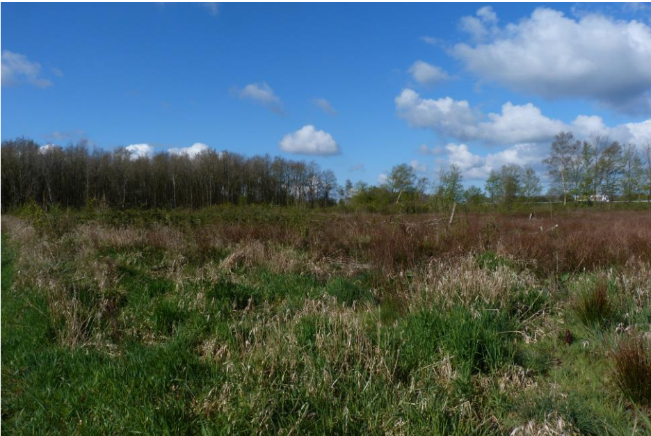
Figuur 5: Impressie van één van de gekapte bospercelen.

Een drietal bosvakken (19b, 19l en 19i, zie bijlage 1 voor de vakindeling) is enkele jaren terug gekapt vanwege essentaksterfte. De vegetatie hier bestaat uit een afwisseling van ruigtesoorten zoals hoog opgaand braamstruweel, pitrus en algemene grassen afgewisseld met struweelsoorten als Amerikaanse vogelpest en vlier.