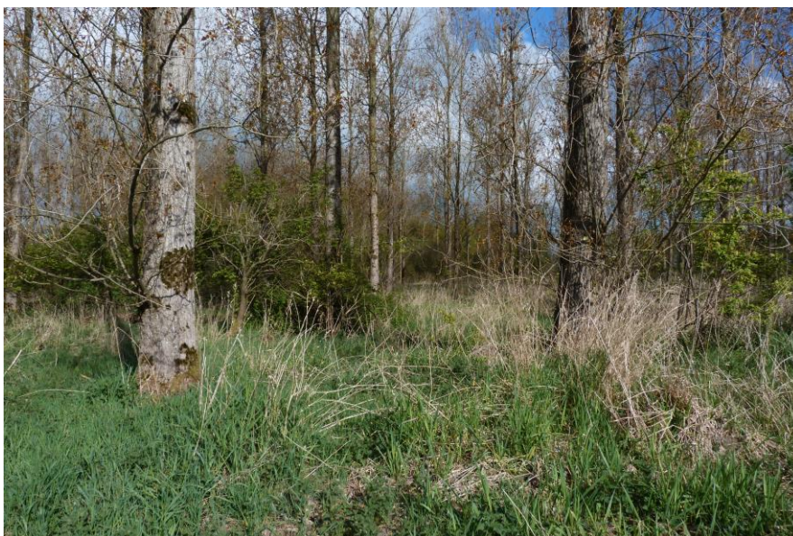
Figuur 7: Impressie van de ondergroei onder de populieren.

Verder werden geen beschermden plantensoorten aangetroffen en deze zijn ook niet te verwachten. De bodemomstandigheden zijn dusdanig dat het gebied veelal te voedselrijk is. Dit doordat de percelen zijn aangelegd op voormalige landbouwpercelen. De begroeiing bestaat daardoor voornamelijk uit algemene ruigtesoorten als braam sp., grote brandnetel Urtica dioica en fluitenkruid Anthriscus sylvestris (figuur 5, 6 en 7). Negatieve effecten op de flora worden daarom niet verwacht.