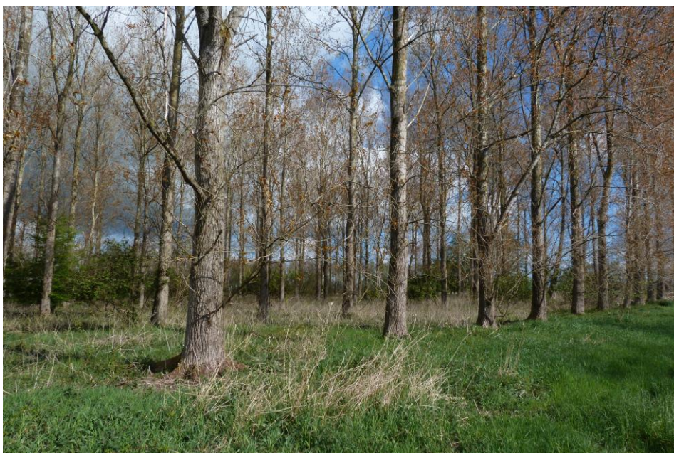
Figuur 3: Bosperceel met populier. Het bosperceel waar de vijver zal worden aangelegd.

Afgelopen decennia zijn in de bosvakken enkele dunningen uitgevoerd. Vanwege de nog relatief jonge leeftijd van de (eiken)bomen is er nauwelijks sprake van dik dood hout of aftakelende bomen. Enkel in het populierbos is sprake van enkele aftakelende bomen. De ondergroei onder de bomen is ijl en bestaat uit algemene plantensoorten, zoals braam, pitrus en witbol.