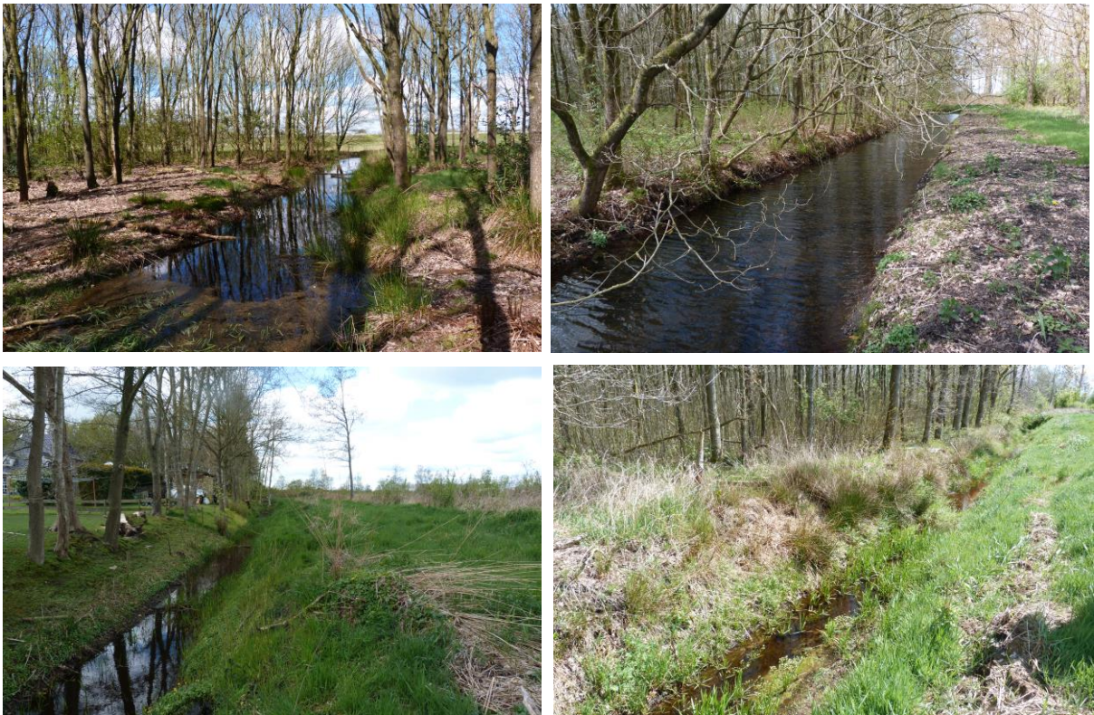
Figuur 31: (Linksboven): Dit betreft de watergang ten noorden van winput 2. In deze watergang ontbreekt een goede modderlaag. Door dat de watergang in het bos ligt, ligt de watergang vol met bladafval.

De grote modderkruiper Misgurnus fossilis werd tijdens de bemonstering van de watergangen niet aangetroffen. De meeste watergangen zijn ongeschikt bevonden als biotoop voor de grote modderkruiper Misgurnus fossilis . Dit komt doordat een modderlaag in de meeste watergangen ontbreekt; ook de gewenste begroeiing van waterplanten is niet overall aanwezig (figuur 32 t/m 35).