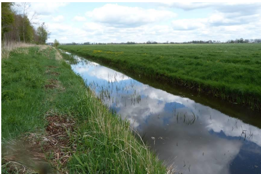
Figuur 35: De nieuw aan te leggen watergang. In de verte is goed te zien dat er sprake is van een rijke begroeiing.

Tijdens het veldbezoek is de betreffende watergang intensief bemonsterd met een schepnet op vis. Vanwege de breedte en diepte van de watergang geeft dit echter geen 100% uitsluitel over het al dan niet voorkomen van de grote modderkruiper in deze watergang. Vanwege mogelijke werkzaamheden aan deze watergang, dan wel intensivering van het onderhoud van deze watergang, zal nader onderzoek naar het voorkomen van de grote modderkruiper Misgurnus fossilis gedaan moeten worden waarbij gerichte vangtechnieken voor deze soorten worden ingezet (d.w.z. e-DNA of elektrovisserij) zodat met meer zekerheid het voorkomen van deze soort uitgesloten kan worden. Na uitvoering van het nader onderzoek kan een uitspraak worden gedaan over het al dan niet aanwezig zijn van een populatie van de grote modderkruiper in deze watergang.