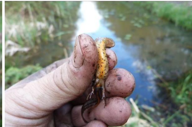
Figuur 27 en 28: Kleine watersalamander Lissotriton vulgaris (vrouw)