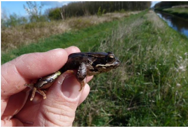
Figuur 16: Bruine kikker Rana temporaria, Exemplaar 1