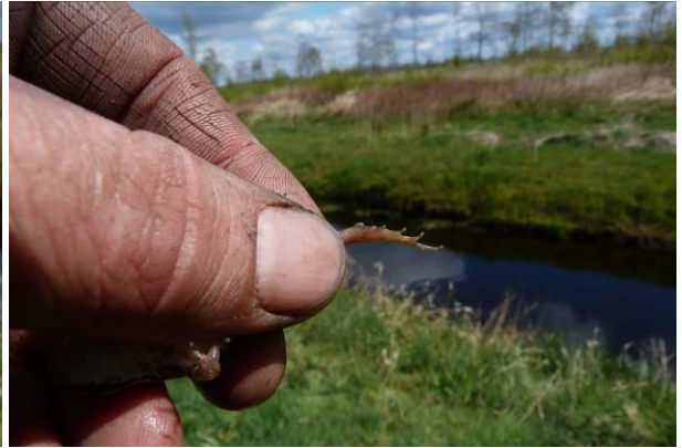
Figuur 25 en 26: Bastaardkikker Pelophylax kl. Esculentus, Exemplaar 3