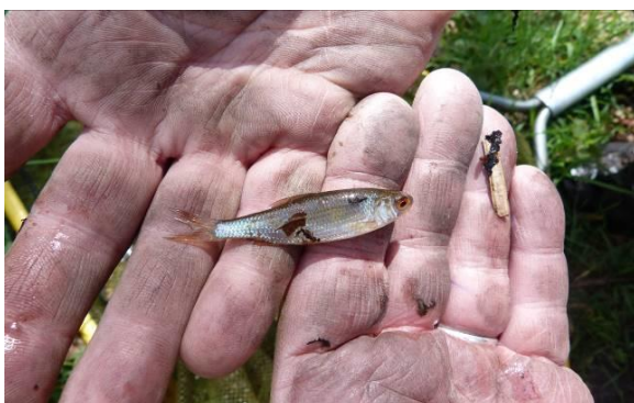
Figuur 39: Blankvoorn Rutilus rutilus.