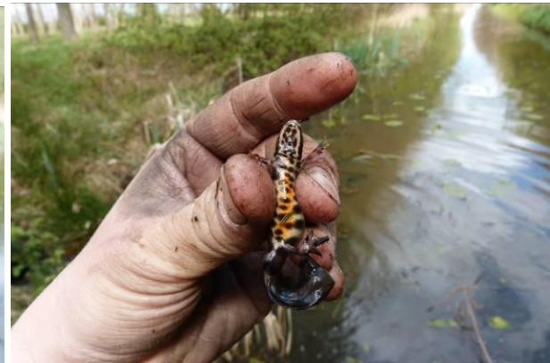
Figuur 29 en 30: Kleine watersalamander Lissotriton vulgaris (man)