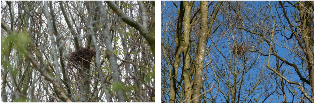
Figuur 11 en 12: De horsten die werden aangetroffen in een beuk (links) en eik (rechts).

Ondanks de diverse horsten die verspreid in het gebied zijn waargenomen, konden op dit moment geen broedwaarnemingen van deze beide soorten in het plangebied worden vastgesteld. De aangetroffen horsten zijn echter potentieel geschikt voor de buizerd of ransuil om in de toekomst in te gaan nestelen. Op het moment dat de uitvoering van de plannen concreet wordt, zal hier nader onderzoek naar moeten worden verricht. Mocht blijken dat een horst bezet wordt in een boom die gekapt moet worden, dan is het noodzakelijk om hiervoor een ontheffing aan te vragen. Dit geldt ook als de betreffende boom buiten het broedseizoen wordt gekapt. De horsten van deze vogels zijn immers jaarrond beschermd onder artikel 3.1 van de Wet natuurbescherming waardoor de bomen waarin deze horsten zich bevinden niet gekapt mogen worden zonder ontheffing van de Wet Natuurbescherming. Dit geldt ook voor de bomen die er direct naast staan, omdat deze belangrijk zijn om de functionaliteit van de betreffende horst te waarborgen.