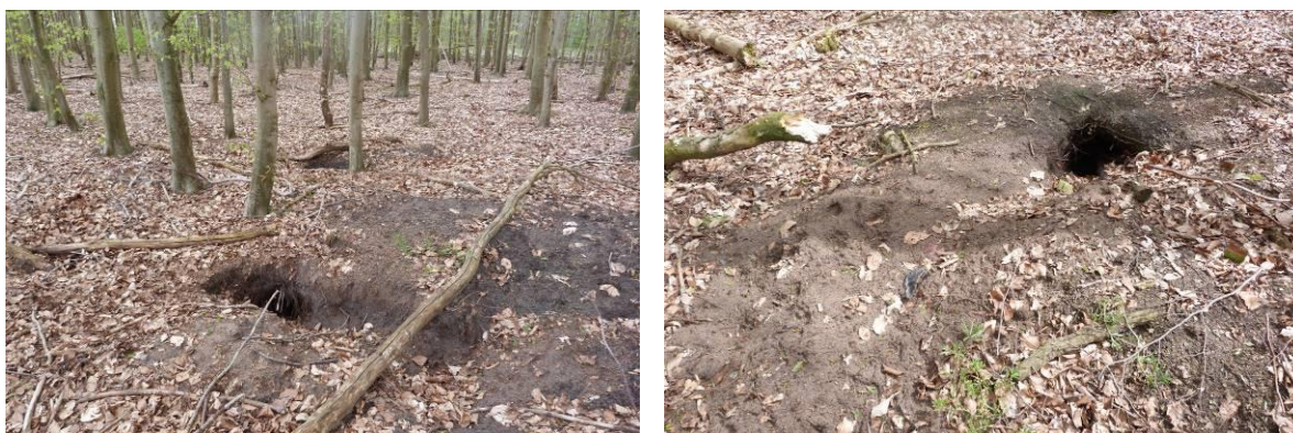
Figuur 15: Dassenburcht in beukenopstand.

In een beukenopstand aan de oostkant van het gebied werd tijdens het veldbezoek een dassenburcht aangetroffen. Inspectie van de burcht wees uit dat de burcht momenteel niet bewoond is. Inspectie van de burcht vond plaats op 7 mei en 18 mei 2021. Er werden alleen (verse) sporen aangetroffen van reeën Capreolus capreolus bij deze burcht. Er zijn geen actieve dassenwissels aanwezig. Waarschijnlijk betreft het een bijburcht die incidenteel gebruikt wordt.