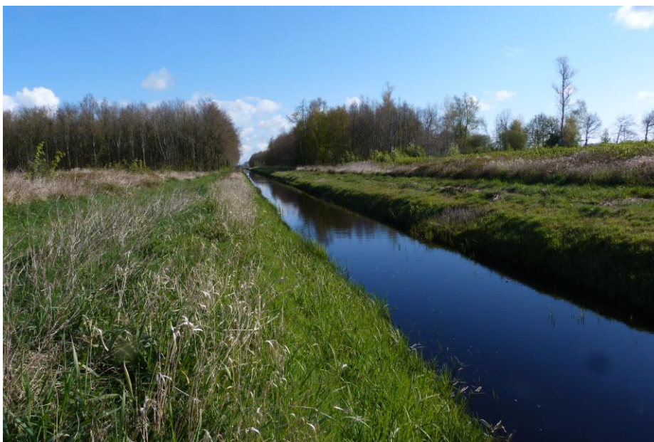
Figuur 6: De aan te passen watergang welke centraal van noord naar zuid door het plangebied loopt.

De watergangen zijn begroeid met een afwisseling van riet Phragmites australis , grote egelskop Sparganium erectum en mannagras Glyceria fluitans . In de brede oostelijke sloot komt holpijp voor. In de westelijke watergang, die uitkomt in een kleine plas, komt gele plomp massaal voor. Enkele ondiepe sloten lopen van oost naar west door het bos. Via duikers zijn deze watergangen verbonden met de grote watergangen. Omdat deze duikers hoog liggen, is er alleen sprake van een verbinding bij een voldoende hoge waterstand in de grote watergangen. De watergangen worden jaarlijks geschoond, waarbij het hekkelmateriaal op de kant wordt gelegd. De taluds van de watergangen en de paden zijn begroeid met algemene graslandsoorten.