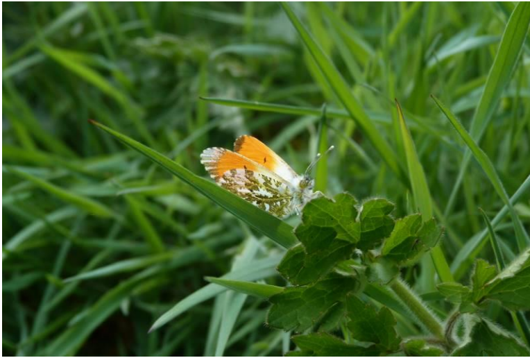
Figuur 40: Oranjetipje Anthocharis cardamines (man).