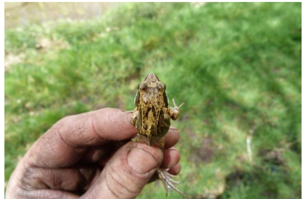
Figuur 19 en 20: Bruine kikker Rana temporaria, Exemplaar 3