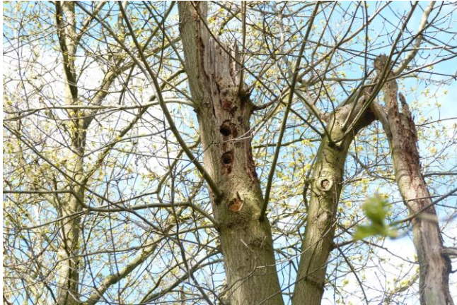
Figuur 10: Nestholte van de grote bonte specht Dendrocopos major in een eik in het zuiden van het gebied.