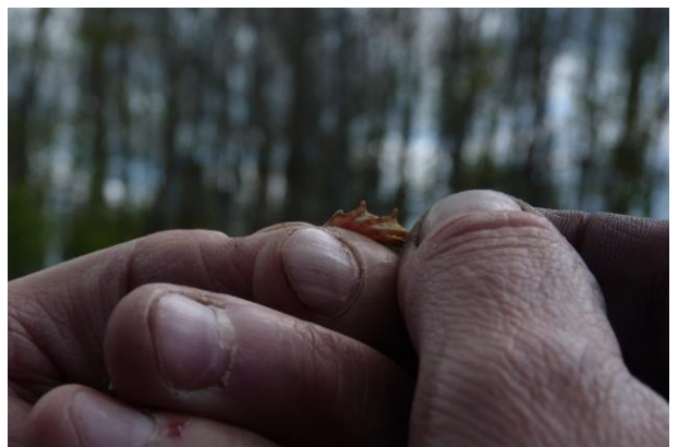
Figuur 21 en 22: Bastaardkikker Pelophylax kl. Esculentus, Exemplaar 1