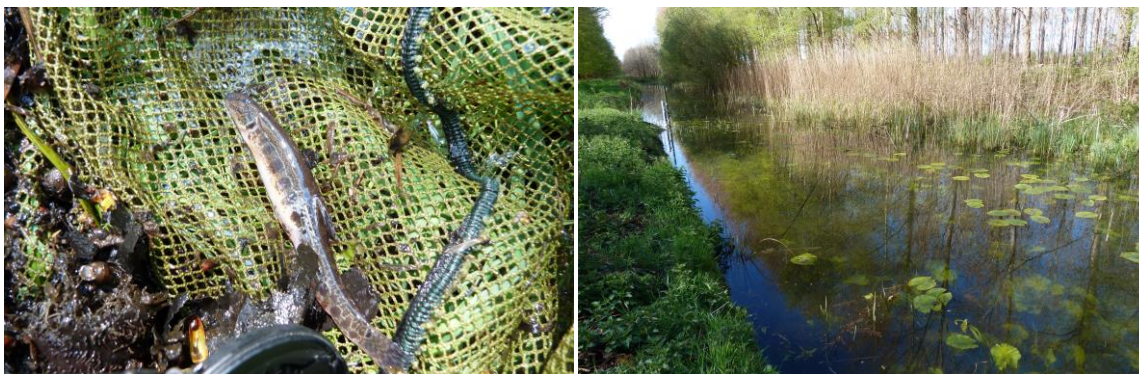
Figuur 37 en 38: Links; Kleine modderkruiper Cobitis taenia (adult), Rechts; Het biotoop waarin het exemplaar werd aangetroffen.

In de bestaande plas in het noorden van het gebied werd een kleine modderkruiper Cobitis taenia aangetroffen en in de watergang ten zuiden van de aan te leggen SW vijver werd een Blankvoorn Rutilus rutilus aangetroffen. Deze soort is gevangen aan het uiteinde van de sloot, op een plek waar veel water instroomde vanuit de aangrenzende grote watergang. Deze soorten ondervinden geen negatieve effecten van de lozing van bewerkt, schoon grondwater tijdens de pilot voor de zuiveringsprocessen.