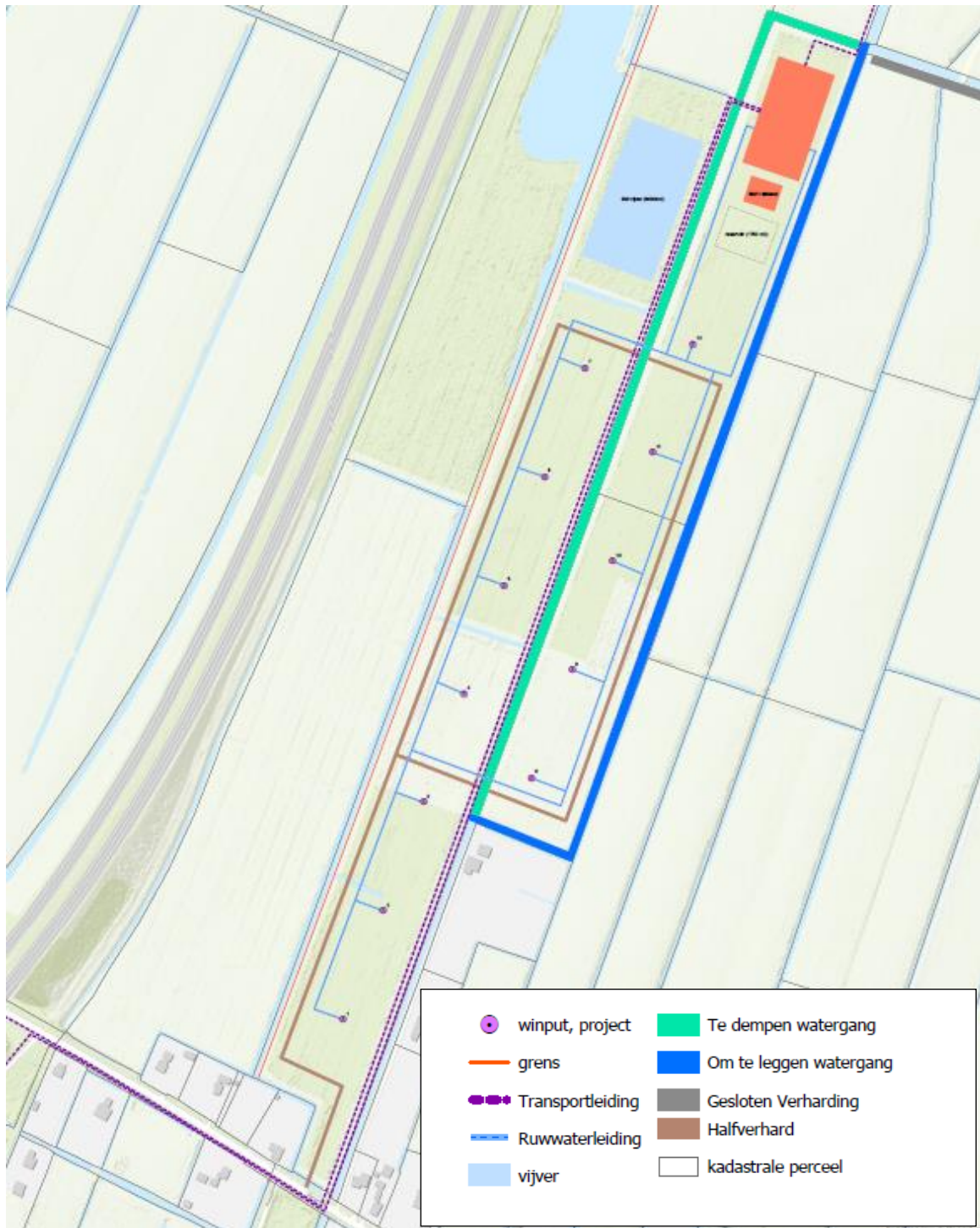
Figuur 2: Beoogde inrichting van de waterwinlocatie Luxwoude