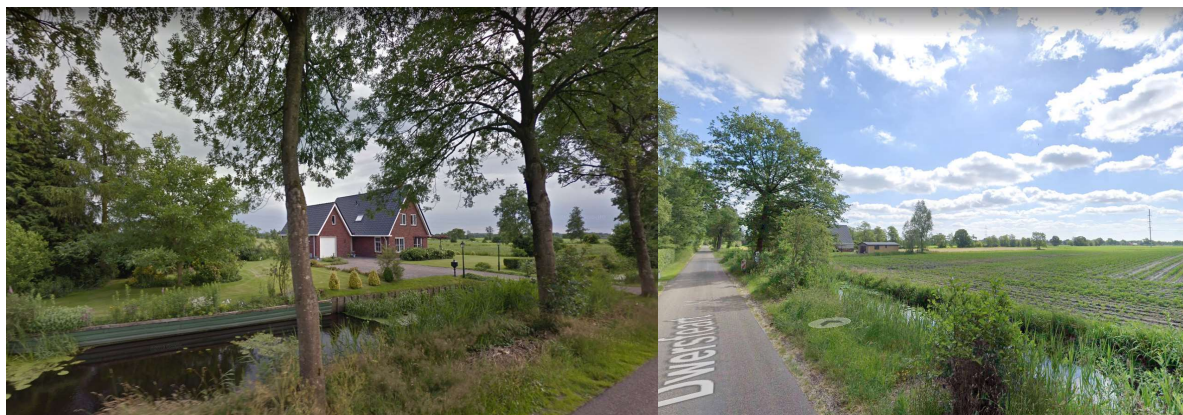
Afbeelding 3 Beelden vanaf de Dwersfeart

Vanaf de Dwersfeart zal de voorbijganger niet of nauwelijks verschil opmerken tussen de bestaande situatie en de nieuwe situatie. De woning blijft aan de voorzijde en aan de rechter zijgevel op een natuurlijke wijze omzoomd door de bomenrijen langs de Dwersfeart en het zandpad. Aan de achtergevel en linker zijgevel blijft de open relatie met de achterliggende weilanden.