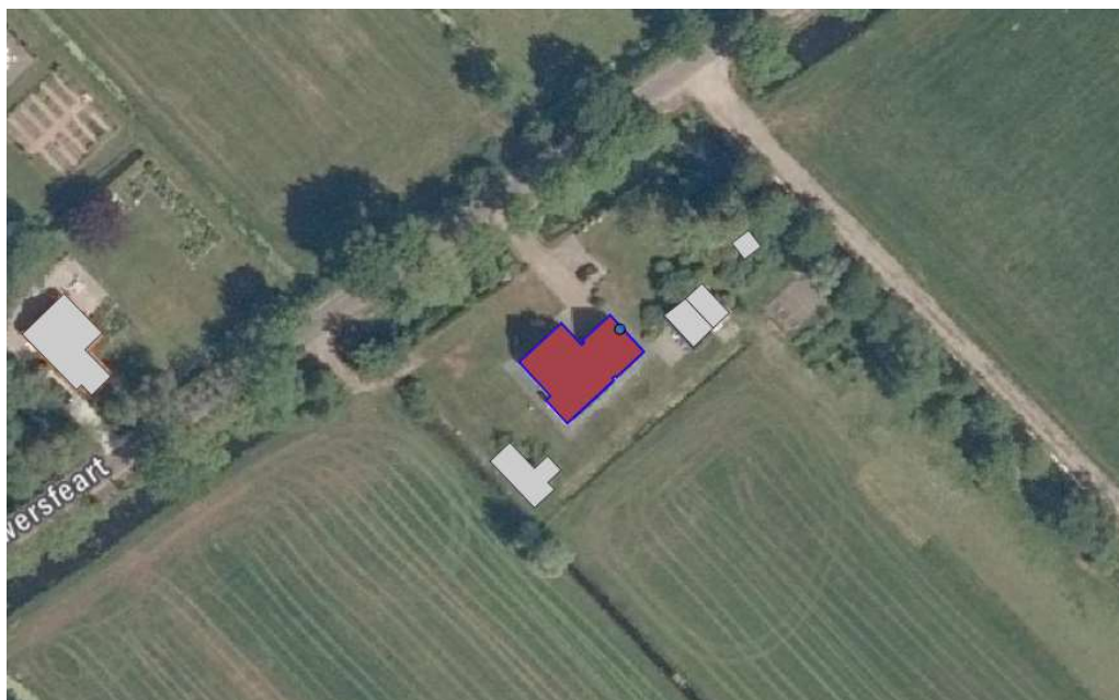
Afbeelding 1 Dwersfeart 19 Gorredijk, bestaande situatie

De bestaande situatie betreft een woonperceel groot ca. 1.853 m 2 . Op de locatie staat een eigentijdse woning met aangebouwde garage en enkele bijgebouwen. Bouwjaar van de woning is 2008. In 2021 is een tijdelijke wooneenheid gerealiseerd op de locatie.