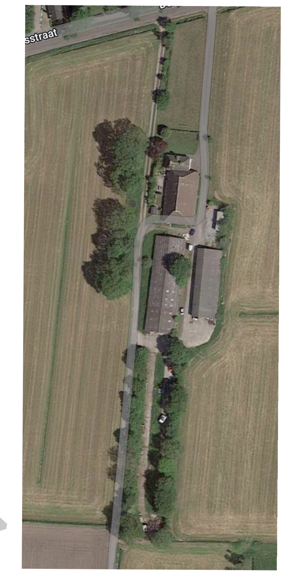
foto situatie Bestand