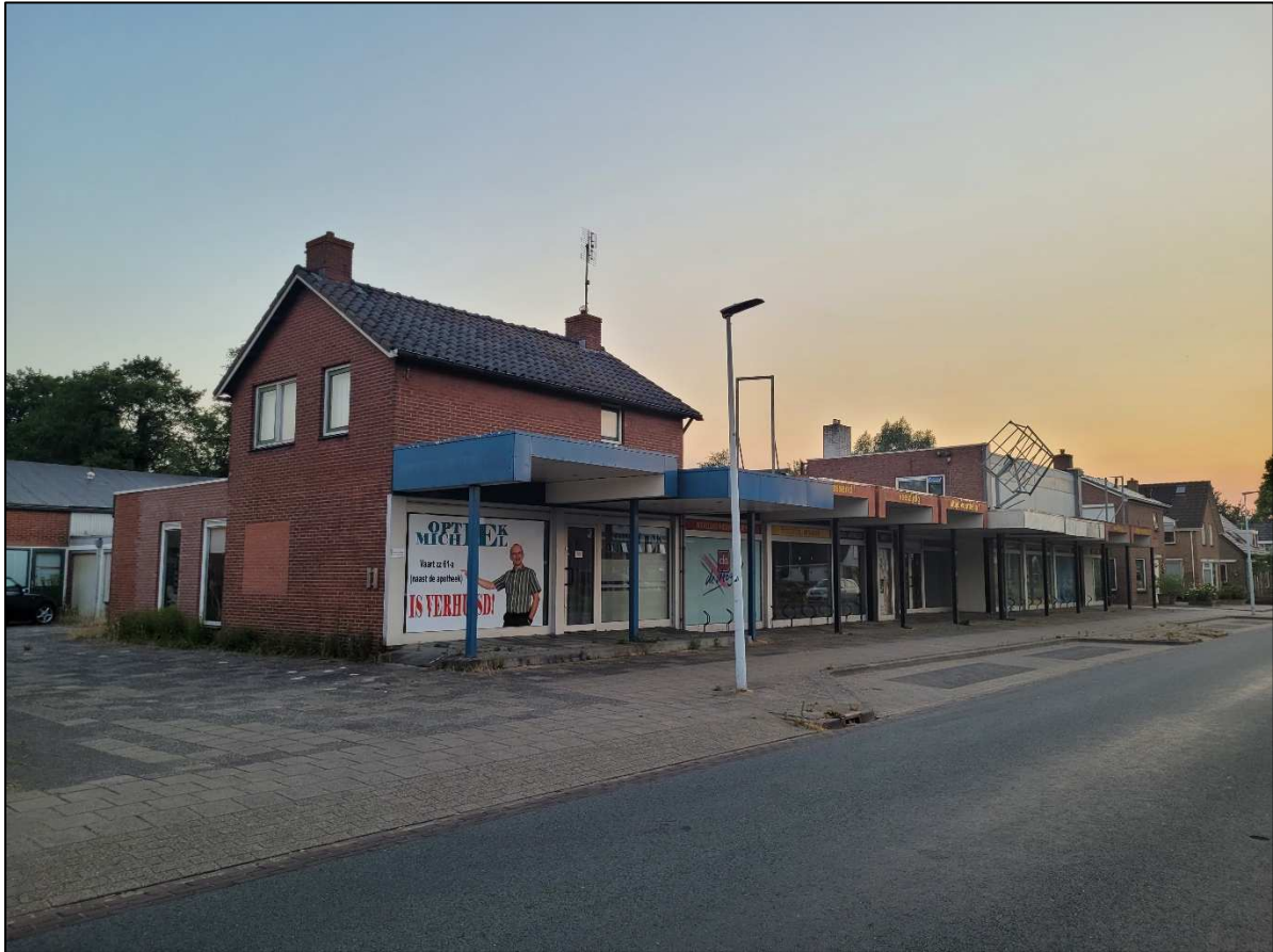
Foto 1 Vaart Zuidzijde 35 Appelscha