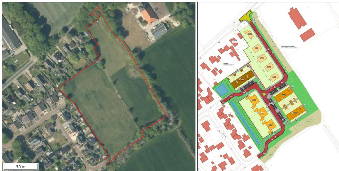
Figuren 1 en 2. Links: de locatie van het plangebied (rood omlijnd). Bron luchtfoto: www.ruimtelijkeplannen.nl . Rechts: de inrichting van de nieuwe woonwijk. Bron: gemeente Ooststellingwerf en Sweco.